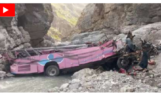
ఊస్తుండటంతో అదుపుతప్పి లోయలోకి పడిపోయినట్లు ప్రాథమిక దర్యాప్తులో తేలిందన్నారు.