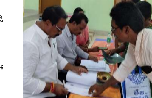
పెద్ద సంఖ్యలో ప్రజల పాల్గొన్నారు.

వివరాలు స్వీకరించి వారి సమస్యలు విని సంబంధిత అధికారులతో ఫోన్లో మాట్లాడి సమస్యలను త్వరగా పరిష్కరించాలని ఆదేశించారు వారి సమస్యలను సత్వర పరిష్కారం చూపడం ప్రభుత్వ లక్ష్యమని గురుమూర్తి తెలిపారు. ఈ కార్యక్రమంలో నియోజకవర్గ పరిశీలకులు కనపర్తి శ్రీనివాస్ పార్టీ నాయకులు, ప్రజాప్రతినిధులు కార్యకర్తలు మరియు