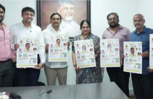
తెలియజేశారు ఇలాంటి కార్యక్రమాలు చేస్తున్న బి ఎన్ ఐ విజయవాడ సభ్యులను అభినందించారు. యువత అందరూ ఈ జాబ్ మేళాను ఉపయోగించుకొని వారి విద్యార్హతను బిట్టి ప్రతి ఒక్కరు ఈ జాబ్ మేళాలో పాల్గొనాలని తెలియజేశారు.

మేళా పోస్టర్ ను లాంచ్ చేశారు. ఈ సందర్భంగా ఎంపీ కేశినేని చిన్ని మాట్లాడుతూ బి ఎన్ ఐ విజయవాడ పది సంవత్సరాలు పూర్తి చేసుకున్న సందర్భంగా ముందుగా సభ్యులందరికీ శుభాకాంక్షలు తెలియజేశారు స్కీల్ డెవలప్మెంట్ సహకారంతో ఇంత పెద్ద జాబ్ మేళా విజయవాడలో జరగడం గొప్ప విషయం అని తెలియజేశారు ఈ జాబ్ మేళాలో దాదాపు 100కు పైగా ప్రముఖమైన కంపెనీలు అనేక రకాల పరిశ్రమలు నేరుగా ఈ జాబ్ మేళాలో పాల్గొని నిరుద్యోగుల అందరిని నేరుగా రిక్రూట్ చేసుకోవడం శుభ పరిణామం అని