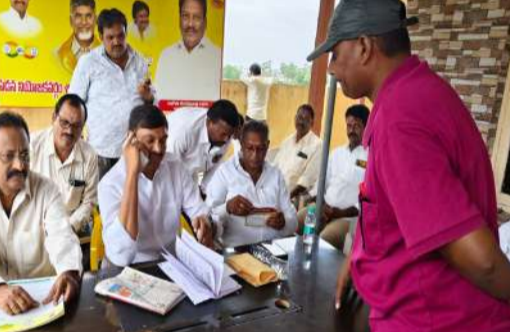
అధికారులు రైతులకు తగు సూచనలు ఇవ్వాలన్నారు. ఈ కార్యక్రమంలో పలువురు డీసీపీ నాయకులు, కార్యకర్తలు పాల్గొన్నారు.

అంశాలపై ప్రజలు నుండి వివరాలును స్వీకరించిన ఆయన... ప్రజలు ఇస్తున్న వివరాలపై అధికారులు నిర్లక్ష్యం చేయకుండా, ఎప్పటికప్పుడు సమస్యలు పరిష్కరించేలా జవాబుదారీతనంగా ఉండాలన్నారు. ప్రజల నుంచి వచ్చిన అర్జీలపై తీసుకున్న చర్యలు గురించి సమాచారం తనకు చేరవేయాలని అధికారులను ఎమ్మెల్యే కాగిత ఆదేశించారు. ప్రస్తుతం వర్షాభావ పరిస్థితుల నేపథ్యంలో వ్యవసాయ