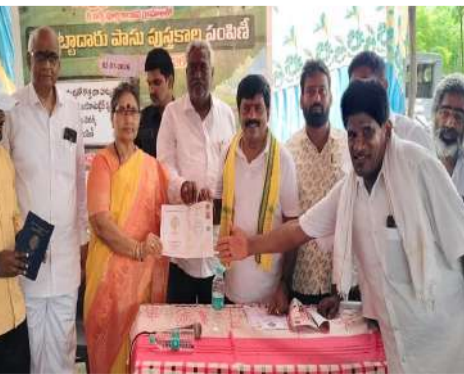
పేర్కొన్నారు. ఈ కార్యక్రమంలో మండల ఎస్పీపి కూటమి నాయకులు, రైతులు, మండల అధికారులు పాల్గొన్నారు.

పుస్తకాల్లోని తప్పులను సవరించి, ఇప్పుడు కేవలం ప్రభుత్వ రాజముద్ర మరియు క్యూఆర్ కోడ్లతో అత్యంత పారదర్శకంగా వీటిని రూపొందించారని చెప్పారు. రీ-సర్వే పూర్తయిన రైతులకు, స్థానిక గ్రామ సభల ద్వారా రెవెన్యూ సిబ్బంది వీటిని అందజేయనున్నారని తెలిపారు. వెబ్ ల్యాండ్ వివరాలతో కూడిన ఈ కొత్త పాసు పుస్తకాలు రైతులకు పూర్తి భరోసా కల్పించనున్నాయని ఎమ్మెల్యే