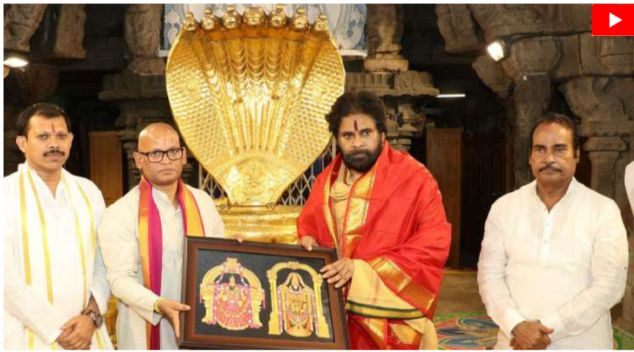
తిరుమల(చైతన్యరథం): తిరుమల వెంకటేశ్వరస్వామిని ఉప ముఖ్యమంత్రి పవన్కళ్యాణ్ గురువారం దర్శించుకున్నారు. రైల్వేకోడూరు నియోజకవర్గంలో