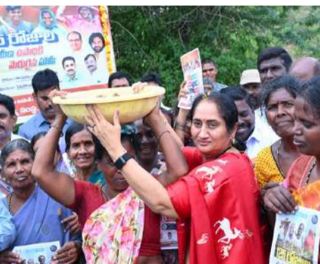
జరుగుతుందని మంత్రి పేర్కొన్నారు. కార్యక్రమంలో కూటమి నాయకులు కార్యకర్తలు అధికారులు తదితరులు పాల్గొన్నారు.

ఉపాధి హామీ పథకం ద్వారా గ్రామీణ పేదలకు ఉపాధి కల్పించడంతో పాటు వర్షపు నీటి ప్రతి బొట్టును ఒడిసిపట్టేలా అభివృద్ధి పనులు చేపడుతున్నామని తెలిపారు. పనిదినాలను 100 రోజుల నుంచి 125 రోజులకు పెంచడం వల్ల కూలీలకు మరింత ఉపాధి, ఆదాయం లభిస్తుందన్నారు. ప్రతి అర్జిత కలిగిన కుటుంబం ఉపాధి హామీ పథకాన్ని సద్వినియోగం చేసుకోవాలని, ఈ పనుల ద్వారా భూగర్భ జలాలు పెరిగి వ్యవసాయానికి కూడా మేలు