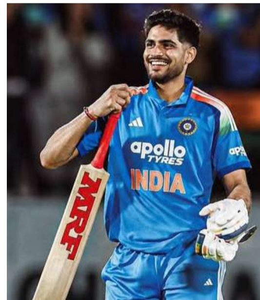
ప్రమాదం లేకపోలేదు. 2017 తర్వాత భారత్ టెస్టుల కోసం శ్రీలంక పర్యటనకు వెళ్లడం ఇదే తొలిసారి. అప్పట్లో విరాట్ సారథ్యంలో భారత్ 3-0తో సిరీస్ ను కైవసం చేసుకుంది.

డబ్ల్యూటీసీ పైనల్ ఆశలను గిల్ సేన సజీవంగా ఉంచుకోవాలంటే శ్రీలంక గడ్డపై కచ్చితంగా గెలవాల్సిందే. అయితే లంకేయులను వారి స్వదేశంలో ఓడించడం అంతకంటే కాదు. శ్రీలంక జట్టు గత కొంత కాలంగా సొంత గడ్డపై అద్భుత విజయాలతో దూసుకుపోతోంది. ఈ దశాబ్దంలో ఆడిన 21 టెస్ట్ మ్యాచ్లో 11 విజయాలను శ్రీలంక సమోదు చేసింది. శ్రీలంకను తక్కువగా అంచనా వేస్తే బోల్తాపడే