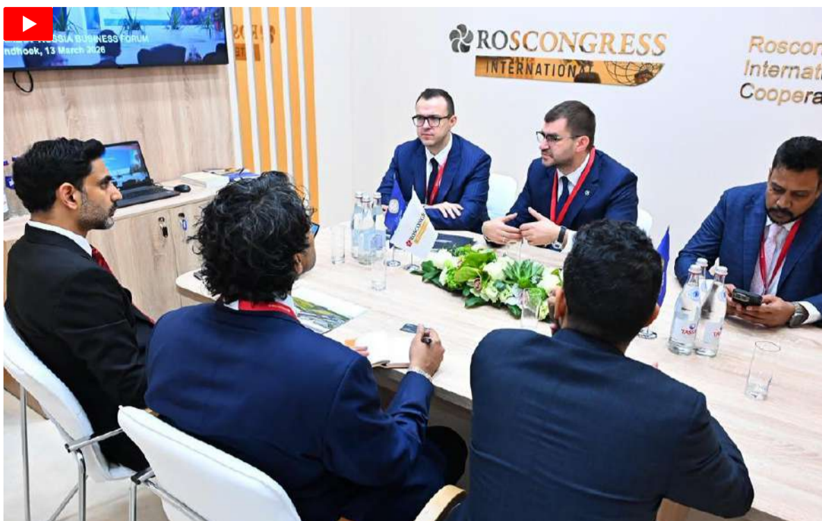
గాల్వనైజ్డ్ వైర్ ఫ్యాక్టరీ నిర్మాణం చేపట్టాలని కోరారు. నోవోస్టల్-ఎమ్ సప్లయ్ చైన్ తో ప్రత్యేకమైన వాటర్ ప్రాజెక్ట్ కూడిన ముడి పదార్థాల లాజిస్టిక్స్ హబ్ ను అభివృద్ధి చేయడానికి ఒక

ఆంధ్రప్రదేశ్ లోని శ్రీసిటీలో తక్షణ రైల్వే సైడింగ్ కన్సెప్టివిటీతో ఒక ప్రకృత సైక్లన్, రైల్వే ట్రాక్ రోలింగ్ మిల్లు ఏర్పాటు చేయాలని, చెన్నై-బెంగళూరు పారిశ్రామిక కారిడార్ పరిధిలో ప్రాంతీయ ఆటోమోటివ్, షిప్ బిల్డింగ్ పరిశ్రమలకు నేరుగా మెటీరియల్ సరఫరా చేసే ఒక ప్రత్యేకమైన హార్బర్