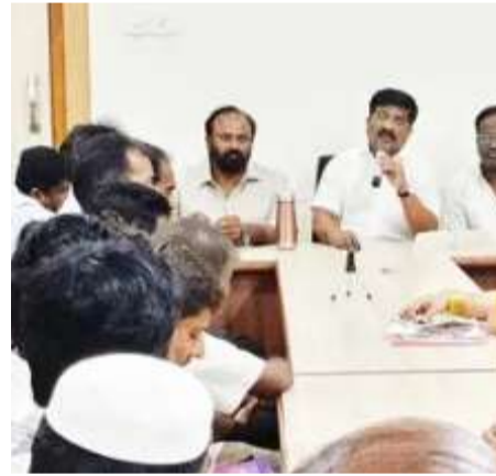
మార్కాపురం (చైతన్యరథం): రెండేళ్ల పాలనలో కూటమి ప్రభుత్వం చేసిన అభివృద్ధిని ప్రజల్లోకి తీసుకెళ్లాలని