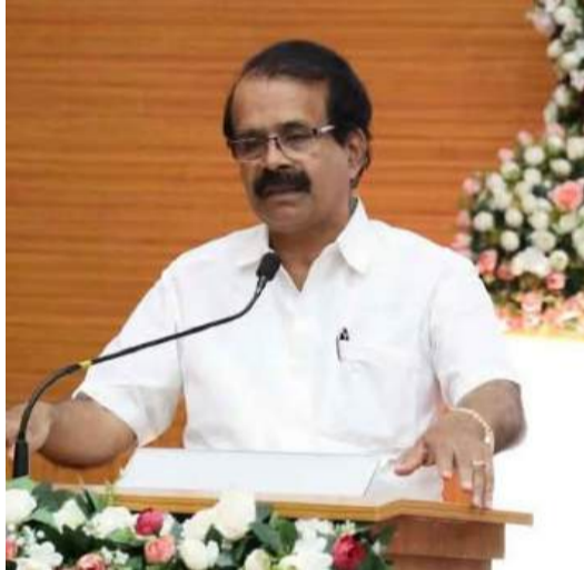
అవకాశం దక్కని సంగతి తెలిసింది. 1960 సెప్టెంబర్ 20న కేరళలోని కొట్టాయం జిల్లాలో

ఢిల్లీ: బీజేపీ సీనియర్ నేత జార్జ్ కురియన్ తన కేంద్ర మంత్రి పదవికి రాజీనామా చేశారు. ఆయన రాజీనామాను రాష్ట్రపతి ద్రౌపది ముర్ము ఆమోదించినట్లు రాష్ట్రపతి భవన్ మంగళవారం ప్రకటించింది. ప్రధానమంత్రి నరేంద్ర మోదీ సలహా మేరకు కురియన్ రాజీనామాను ఆమోదించినట్లు అధికారికంగా ప్రకటించింది. ఈ రాజీనామా వెంటనే అమల్లోకి వచ్చినట్లు పేర్కొంది. కేంద్ర మైనారిటీ వ్యవహారాలు, మత్స్య, పశుసంవర్ధక, పాడి పరిశ్రమల శాఖల్లో సహాయ మంత్రిగా సేవలందించిన కురియన్.. రాజ్యసభ పదవీకాలం ముగియడంతో పదవి నుంచి తప్పుకోవాల్సి వచ్చింది. ఇటీవల జరిగిన రాజ్యసభ ఎన్నికల్లో ఆయనకు బీజేపీ తరఫున