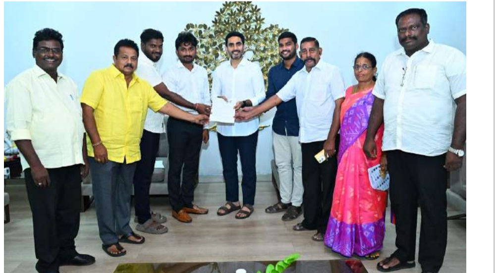
అమరావతి (చైతన్య రథం): కేంద్ర ఎన్నికల సంఘం చేపట్టిన స్పెషల్