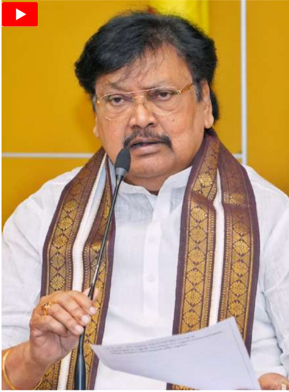
మీ హయాంలో దమనకాండ మరిచారా..