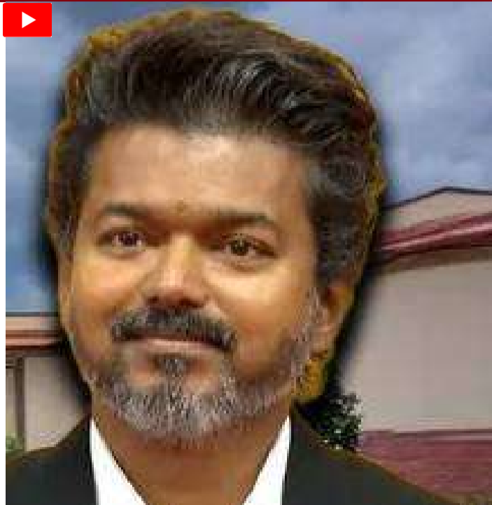
కోర్టు పేర్కొంది. అస్పష్టమైన, నిరాధార ఆరోపణలతో కూడిన పిటిషన్ ను స్వీకరించలేమని సుప్రీం కోర్టు ధర్మాసనం స్పష్టం చేసింది.

తమిళనాడు ప్రభుత్వానికి సుప్రీం కోర్టులో ఊరట దక్కింది. అసెంబ్లీలో సీఎం విజయ్ బలపరీక్షపై సీబీఐ విచారణ కోరుతూ దాఖలైన పిటిషన్ ను సర్వోన్నత న్యాయస్థానం కొట్టివేసింది. పిటిషన్ లో పేర్కొన్నవి అస్పష్టమైన ఆరోపణలు మాత్రమేనని సుప్రీం కోర్టు వ్యాఖ్యానించింది. ఆరోపణలకు బలం చేకూర్చే ఆధారాలు లేవని సీజేఐ జస్టిస్ సూర్యకాంత్ నేతృత్వంలోని ధర్మాసనం అభిప్రాయపడింది. మే 13న అసెంబ్లీ వేదికగా జరిగిన బలపరీక్షలో ప్రభుత్వ ఏర్పాటుకు కావాల్సిన తన సంఖ్యబలాన్ని సీఎం విజయ్ నిరూపించుకున్నారు. వీసీకే, సీపీఐ, సీపీఎం, బయూఎమ్ఎల్ పార్టీలు టీఎన్ కే అధినేత విజయ్ కు మద్దతు పలికాయి. 25 మంది అన్నాడీఎంకే రెబల్ ఎమ్మెల్యేలు కూడా టీఎన్ కే అధినేత విజయ్ కు అండగా నిలిచారు. డీఎంకే మాత్రం వాకౌట్ చేసింది. ఈ క్రమంలో సీఎంకు సభలో మద్దతు తెలిపిన ఎమ్మెల్యేల సంఖ్య 120కు చేరింది. మేజిక్ ఫిగర్ కు అదనంగా ఇద్దరు ఎమ్మెల్యేల మద్దతును సీఎం సాధించారు. అయితే, బలపరీక్షలో అక్రమాలు జరిగాయని ఈ సందర్భంగా ప్రతిపక్షం ఆరోపించింది. ఈ నేపథ్యంలో బలపరీక్షపై విచారణ కోరుతూ దాఖలైన పిటిషన్ ను చీఫ్ జస్టిస్ సూర్యకాంత్, జస్టిస్ వి. మోహనలతో కూడిన ధర్మాసనం కొట్టివేసింది. పిటిషన్ లో పేర్కొన్న ఆరోపణలకు బలం చేకూర్చే ఆధారాలేవీ లేవని సుప్రీం