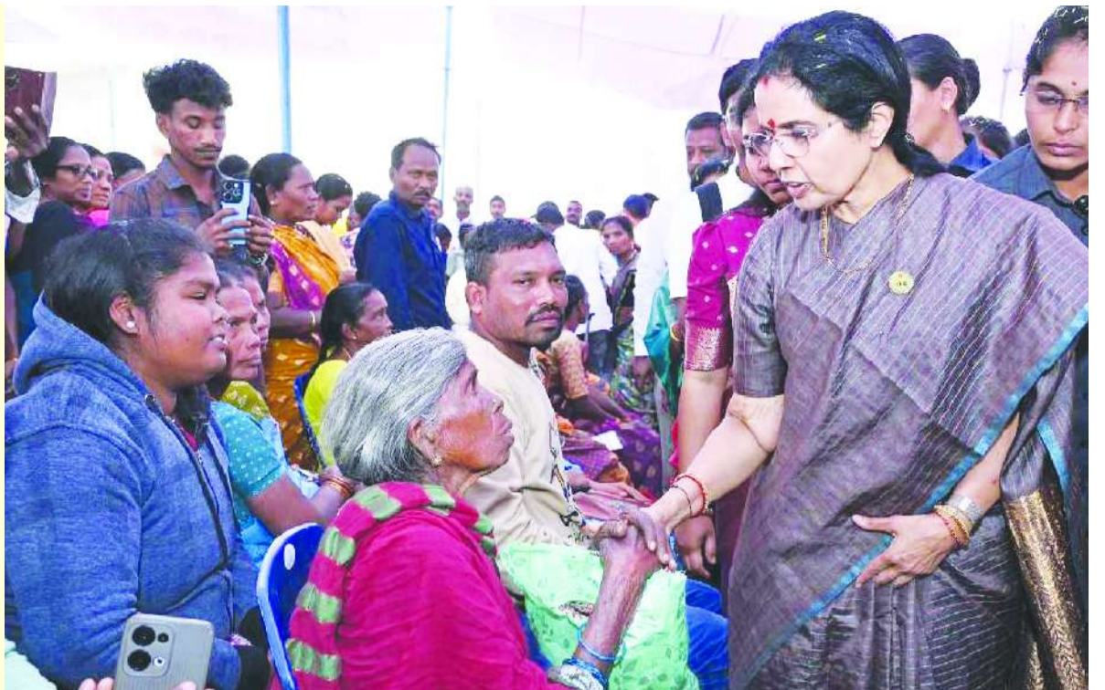
నిర్వహించి ప్రజల్లో చైతన్యం తీసుకొరవడం కూడా ఎంతో గొప్ప విషయం. ఒక చిన్నారి చిరునవ్వు కోసం చేసే ప్రతి ప్రయత్నం సమాజాన్ని మరింత మానవీయంగా మారుస్తుంది.

సమాజంలో చాలామందికి తెలియని బాధ తలసేమియా. ప్రతినెలా రక్తం ఎక్కించుకోవాల్సిన చిన్నారులు, వారి కుటుంబాలు ఎదుర్కొనే కష్టాలు చాలా పెద్దవి. అలాంటి పిల్లల కోసం ప్రత్యేక తలసేమియా కేర్ సెంటర్ ఏర్పాటు చేసి ఉచిత రక్త మార్పిడి, ఉచిత మందులు, ఉచిత ఫిల్టర్లు, ఉచిత ఆహారం అందించడం కేవలం సేవ కాదు... అది మానవత్వం. ప్రస్తుతం 273 మంది పిల్లలకు ఈ సేవలు అందుతున్నాయి. అంతేకాదు విశాఖపట్నం, హైదరాబాద్ లో తలసేమియా అపగాహన రన్