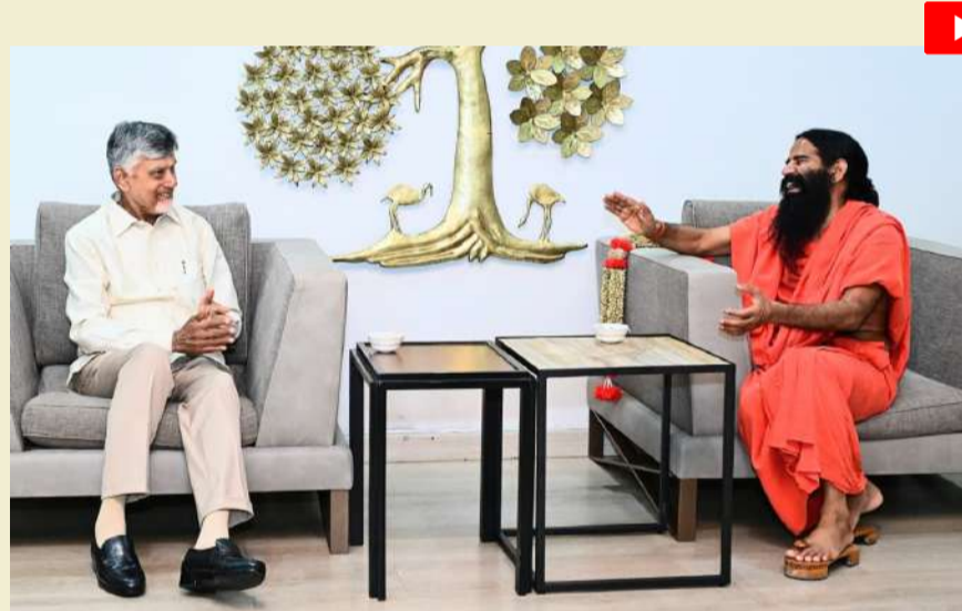
సీఎం క్యాంప్ కార్యాలయంలో ముఖ్యమంత్రి చంద్రబాబు నాయుడిని యోగా గురువు బాబా రామ్ దేవ్, పతంజలి అధినేత ఆచార్య బాలకృష్ణన్ మర్యాదపూర్వకంగా కలిశారు. యోగా దేశో పాల్గొనేందుకు రాష్ట్రానికి వచ్చిన బాబా రామ్ దేవ్, బాలకృష్ణన్ సీఎం ఆహ్వానం మేరకు నివాసానికి వచ్చారు. ఈ సందర్భంగా వారితో యోగా దేశో కార్యక్రమం నిర్వహణపై ముఖ్యమంత్రి చంద్రబాబు చర్చించారు.

అన్నదాత సుఖీభవ- పీఎం కిసాన్ కార్యక్రమంలో పాల్గొనేందుకు సీఎం చంద్రబాబు పల్నాడు జిల్లా చిలకలూరిపేటలో పర్యటించనున్నారు. శనివారం ఉదయం 11.55 గంటలకు అమరావతి నుంచి బయలుదేరి మధ్యాహ్నం 12.15 గంటలకు చిలకలూరిపేట మండలం లింగంగుంట్ల గ్రామానికి చేరుకుంటారు. మధ్యాహ్నం 12.30 గంటలకు లింగంగుంట్ల గ్రామంలోని అంగన్ వాడీ కేంద్రాన్ని సందర్శించి సౌకర్యాలను పరిశీలిస్తారు. అనంతరం 12.50 గంటల నుంచి 1.20 గంటల వరకు రైతులతో ముఖాముఖీ అవుతారు. 2.15 గంటల నుంచి 3.45 గంటల వరకు పార్టీ కార్యక్రమాలతో సమావేశ మవుతారు. సాయంత్రం 3.50 గంటలకు ప్రజావేదిక సభలో ప్రసంగిస్తారు. సాయంత్రం 6 గంటలకు లింగంగుంట్ల నుంచి బయలుదేరి రాత్రి 6.20 గంటలకు క్యాంప్ కార్యాలయానికి చేరుకుంటారు.