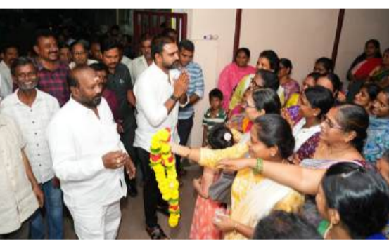
పనుల్లో భాగంగా భవనానికి అవసరమైన మరమ్మతులు చేపట్టడంతో పాటు వివాహాలు, సామాజిక కార్యక్రమాలు నిర్వహించేందుకు అనుకూలంగా సదుపాయాలు కల్పించినట్లు తెలిపారు. పెళ్లి కొడుకు, పెళ్లికూతురు కోసం ప్రత్యేక గదులను కూడా ఏర్పాటు చేసినట్లు పేర్కొన్నారు. కార్యక్రమాల సందర్భంగా భోజనాల ఏర్పాటుకు అనువైన సదుపాయాలు కూడా కల్పించామని వివరించారు.

భకార్యాలు, సామాజిక కార్యక్రమాలు నిర్వహించుకునే అవకాశాలు కోల్పోయారన్నారు. కమ్యూనిటీ హాల్స్ నిర్మాణం వెనుక ప్రధాన ఉద్దేశ్యం పేద, మధ్యతరగతి కుటుంబాలకు తక్కువ ఖర్చుతో కార్యక్రమాలు నిర్వహించుకునే వేదిక కల్పించడమేనని తెలిపారు. కూటమి ప్రభుత్వం అధికారంలోకి వచ్చిన తరువాత ప్రజల అవసరాలను దృష్టిలో పెట్టుకుని సచివాలయాలకు ప్రత్యామ్నాయ భవనాలను గుర్తించి, కమ్యూనిటీ హాల్స్ను తిరిగి ప్రజల వినియోగానికి అందుబాటులోకి తీసుకొస్తున్నామని చెప్పారు. ఇందులో భాగంగా రాజేంద్రనగర్ కమ్యూనిటీ హాల్ను పూర్తిస్థాయిలో అభివృద్ధి చేసి ప్రజలకు అందిస్తున్నట్లు వెల్లడించారు. ఆధునికీకరణ