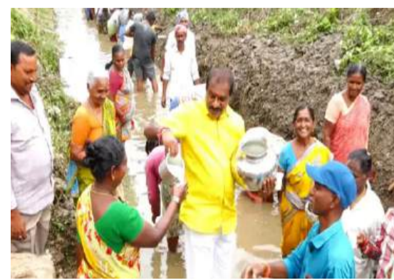
శ్రామికులకు మజ్జిగ నా అందజేయడం తనకు ఎంతో సంతృప్తి, ఆనందంగా ఉందని మంత్రి తెలిపారు.

ఒక్కరితో మంత్రి ఆప్యాయంగా పలకరిస్తూ మీకు ఎప్పుడూ అండగా ఉంటానని భరోసా ఇచ్చారు. స్వచ్ఛమైన పల్లెల్లో మంచి మనసుతో మెలిగే ప్రజలంటే తనకు మమకారం అని, ఆ ఉద్దేశంతోనే గత ఏడాది వేసవిలో మజ్జిగను అందజేయడంతో శ్రామికులు ఎంతో ఆనందం వ్యక్తం చేశారని, దీంతో ఈ ఏడాది కూడా కొనసాగేలాగా పిలుపునిచ్చానన్నారు. ఉపాధి