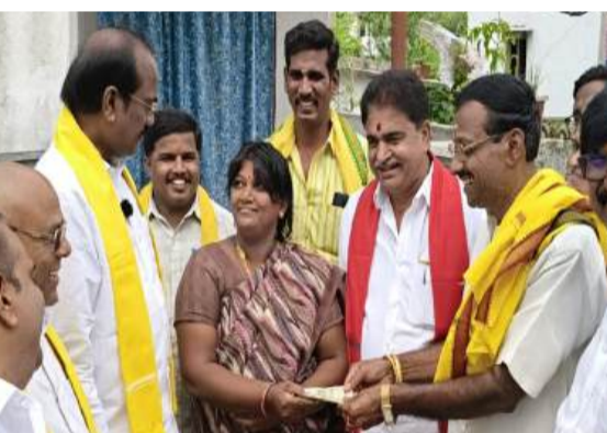
ఎమ్మెల్యే చంటి,, ప్రజా ప్రశాంతతను భగ్నం చేయాలనుకునే కుట్రలకు, బెదిరింపులకు కూటమి ప్రభుత్వం తలాగ్గేదే లేదంటూ స్పష్టం చేశారు.

విగ్రహాలే లేకుండా చేస్తామంటూ వైసీపీ నాయకులు చేసిన వ్యాఖ్యలను తప్పుపట్టారు. వైసీపీ అధికారంలోకి వస్తే విగ్రహాలే లేకుండా చేస్తారో, మనుషుల్ని సైతం లేకుండా చేస్తారోనంటూ వ్యంగ్యాస్త్రాలు సంధించారు. అసలు 2029 వరకూ వైసీపీ మనుగడలో ఉంటుందా అని ఆయన సందేహం లేవనెత్తారు. దేశంలోనే అత్యధిక కేసులున్న రాజకీయ నాయకుడు ఆ పార్టీ అధినేత జగన్ రెడ్డి అంటూ ఎద్దేవా చేసిన