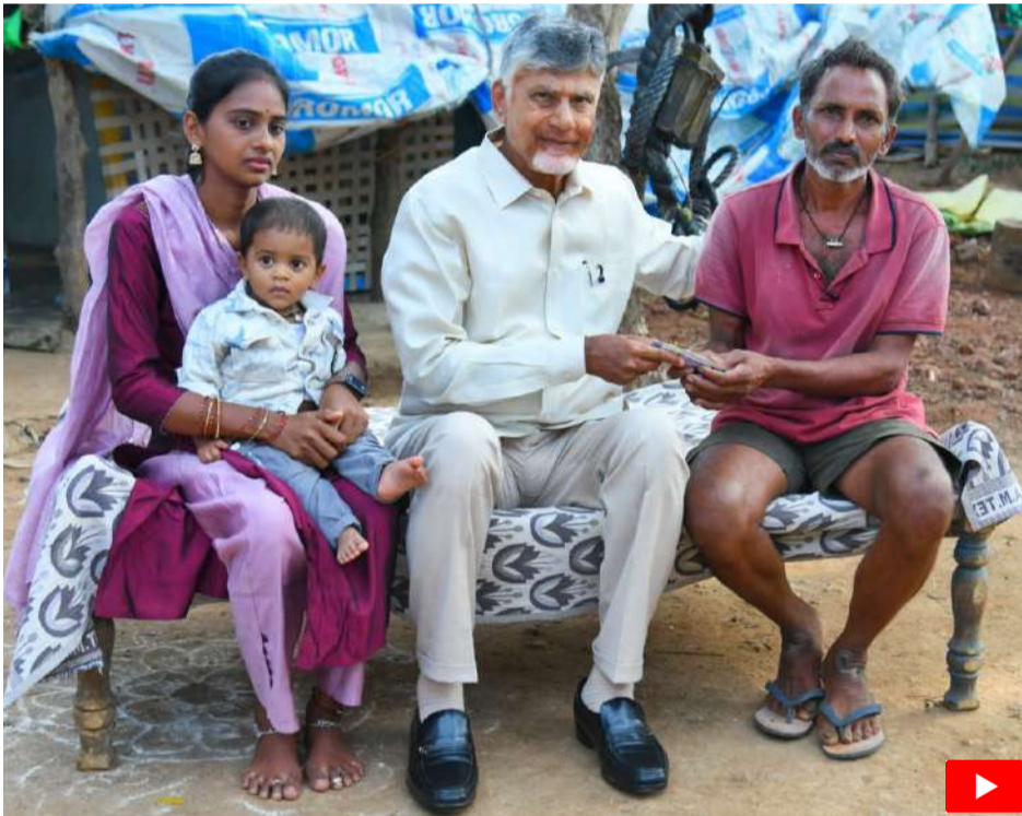
రాష్ట్రంలో కూటమి ప్రభుత్వం ప్రజా సంక్షేమమే ధ్యేయంగా "సుపరిపాలనా యజ్ఞం" చేస్తుంటే ఓర్వలేని వైసీపీ నేతలు రాక్షసుల్లా ఆటంకాలు సృష్టిస్తున్నారు

ముఖ్యమంత్రి నారా చంద్రబాబునాయుడు తీవ్రస్థాయిలో ధ్వజమెత్తారు. కాకినాడ జిల్లా తుని నియోజకవర్గం చామవరంలో సోమవారం జరిగిన 'పేదల సేవ'లో ఎన్టీఆర్ భరోసా పెన్షన్ల పంపిణీ కార్యక్రమానికి ఆయన ముఖ్య అతిథిగా హాజరయ్యారు. ఈ సందర్భంగా జరిగిన భారీ బహిరంగ సభనుద్దేశించి సీఎం మాట్లాడుతూ... అధికారంలోకి వచ్చిన మొదటి రోజు నుంచే పేదల జీవితాల్లో వెలుగులు నింపేందుకు శ్రమిస్తున్నామని స్పష్టం చేశారు. గత ఐదేళ్ల విధ్వంసకర పాలన నుంచి రాష్ట్ర ప్రజలకు విముక్తి లభించిన జూన్ 4 వరిత్రలో నిలిచిపోతుందన్నారు. ఇప్పటివరకు రికార్డు స్థాయిలో రూ.65,887 కోట్లు పెన్షన్ల రూపంలో పంపిణీ చేశామని వెల్లడించారు. విశాఖ రైల్వే జోన్ ఏర్పాటుతో రాష్ట్ర ప్రజల కల సాకారమైందన్నారు. వైసీపీ నేతల కుట్రలు, కుతంత్రాల రాజకీయాలు సాగనిప్పుమని హెచ్చరించారు. 'స్వర్ణాంధ్ర విజన్ -2047' తమ లక్ష్యమన్నారు. రాష్ట్రానికి అనేక పరిశ్రమలు తరలి వస్తున్నాయని, యువత అవకాశాలను సద్వినియోగం చేసుకోవాలని పిలుపునిచ్చారు. ఈ ఏడాది జూలై నాటికి పోలవరం ఎడమ కాలువ పనులను పూర్తి చేసి విశాఖపట్నం వరకు నీరు తీసుకెళ్తామని ప్రకటించారు.