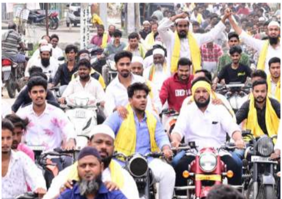
గుంటూరు (చైతన్యరథం): విజనరీ లీడర్ సీఎం చంద్రబాబునాయుడు ఆధ్వర్యంలో