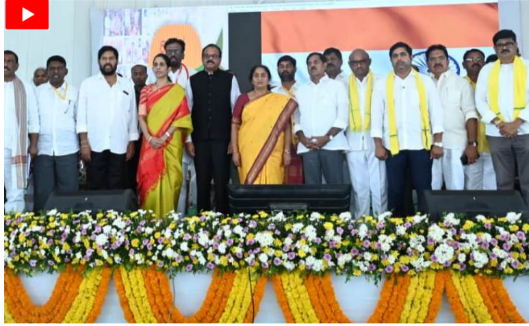
సుస్థిర పాలనతోనే అభివృద్ధి

సుస్థిర పాలనతోనే అభివృద్ధి సాధ్యమవుతుందని మంత్రి సవిత తెలిపారు. గుజరాత్ వరుసగా బీజేపీ ప్రభుత్వాలు రావడంతోనే ఆ రాష్ట్రంలో అభివృద్ధి సాధ్యమవుతుందని, దేశంలోనే అగ్రగణ్యంగా నిలిచిందని తెలిపారు. కేంద్రంలోనూ ప్రధాని నరేంద్రమోడి నేతృత్వంలో వరుస విజయాలు సాధించడంతోనే దేశంలో అభివృద్ధిలో దూసుకుపోతోందన్నారు. ఏపీలోనూ సుస్థిర పాలన ఉంటేనే అభివృద్ధి సాధ్యమవుతుందని, ఇందుకు ప్రజలంతా కూటమి ప్రభుత్వం వెంటే నిలవాలని పిలుపునిచ్చారు. 2019 ఎన్నికల్లో మరోసారి సీఎం చంద్రబాబునాయుడు అధికారంలోకి వచ్చి ఉంటే, నేడు దేశంలోనే ఏపీ నెంబర్ వన్ గా నిలిచి ఉండేదన్నారు. దురదృష్టవశాత్తు జగన్ అధికారంలోకి రావడంతో, రాష్ట్రంలో విధ్వంస పాలన సాగిందన్నారు. దీనివల్ల రాష్ట్రం అన్ని విధాలా వెనుకబడిపోయిందని మంత్రి సవిత ఆవేదన వ్యక్తంచేశారు.