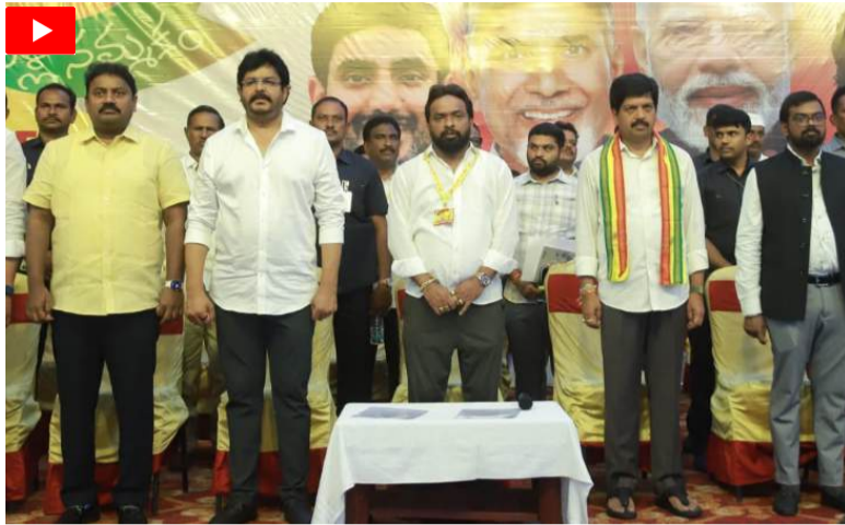
వ్యవసాయ రంగంలో అన్నదాత సుభీభవ