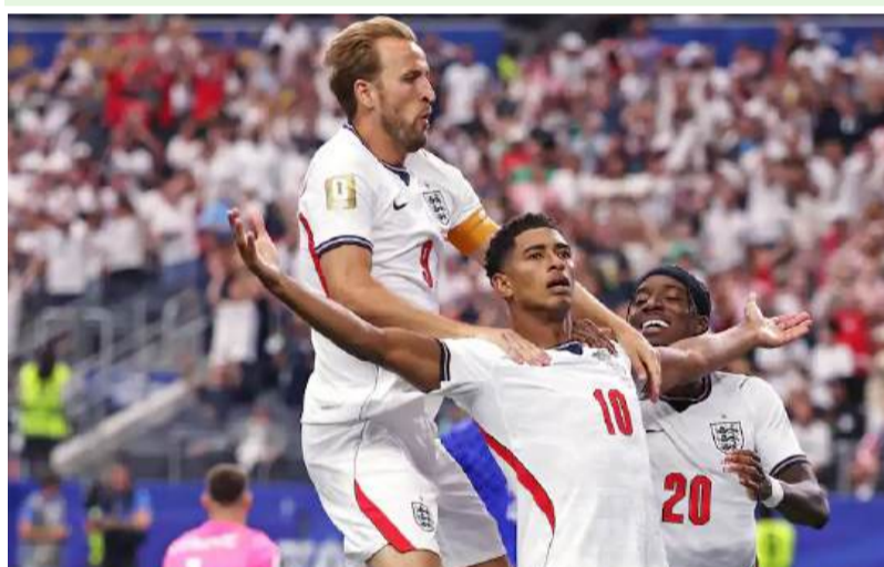
క్రోయేషియాపై 4-2 తో ఘన విజయం

ఫిఫా వరల్డ్ కప్ 2026 గ్రూప్ ఎల్ ఓపెనింగ్ మ్యాచ్లో ఇంగ్లాండ్ టీమ్ అద్భుత ప్రదర్శన చేసింది. టెక్సాస్లోని డల్లాస్ స్టేడియం వేదికగా జరిగిన ఈ ఉత్సాహభరిత పోరులో క్రోయేషియాపై 4-2 తేడాతో ఇంగ్లాండ్ ఘన విజయం సాధించి తమ వరల్డ్ కప్ ప్రస్థానాన్ని ఘనంగా ప్రారంభించింది. కొత్త హెడ్ కోచ్ థామస్ తుచెల్ నేతృత్వంలో ఇంగ్లాండ్ కు ఇది తొలి మేజర్ టోర్నమెంట్ విజయం. ఈ మ్యాచ్లో ఇంగ్లాండ్ కెప్టెన్ స్టార్ ఆటగాడు హ్యరీ కేన్ రెండు గోల్స్ తో చెలరేగాడు.