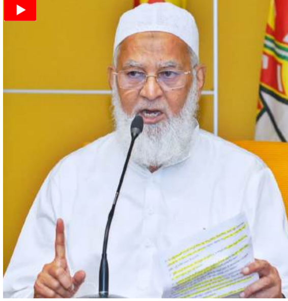
అభివృద్ధికి నిరంతర ప్రోత్సాహం అందిస్తూ రైతుల ఆదాయం పెరిగేలా చర్యలు తీసుకుంటున్నారని చెప్పారు.