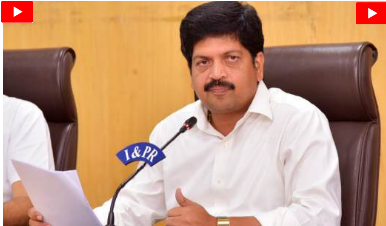
జాతీయ, అంతర్జాతీయ సంస్థల పెట్టుబడులు...

కేంద్ర ప్రభుత్వ గనులు మరియు ఖనిజాల (అభివృద్ధి మరియు నియంత్రణ) చట్టం -ఎంఎడిఆర్ యాక్ట్ నిబంధనలకు అనుగుణంగా రాష్ట్రంలో ఖనిజ బ్లాకుల వేలంపాటలను వేగవంతం చేశామని మంత్రి తెలిపారు. ఇప్పటివరకు 21 ఖనిజ బ్లాకులను వేలం వేయగా 11 మైనింగ్ లీజులు మరియు 10 కాంపోజిట్ లైసెన్సులు మంజూరు చేసినట్లు వెల్లడించారు. ఈ చర్యల ఫలితంగా గనుల రంగంలో పెట్టుబడిదారుల ఆసక్తి గణనీయంగా పెరిగి రాష్ట్రంలో భారీ పెట్టుబడులు, పారిశ్రామిక అభివృద్ధి, ఉపాధి అవకాశాల సృష్టికి మార్గం సుగమమైందని పేర్కొన్నారు.