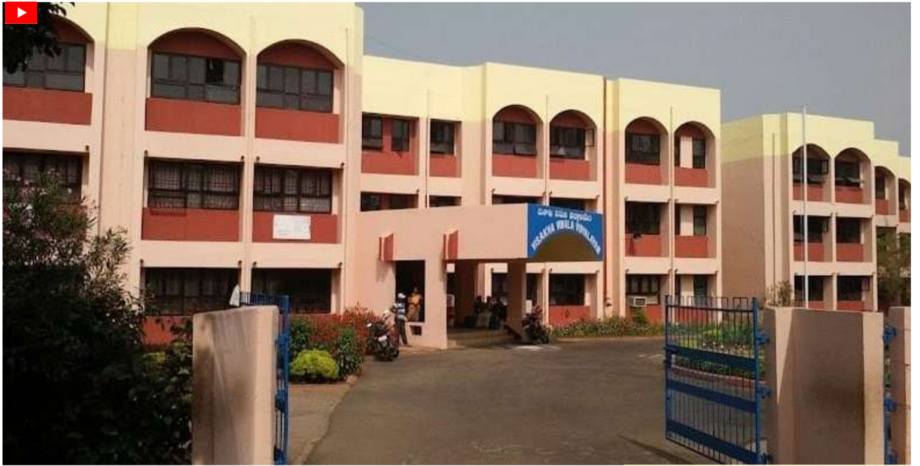
సమన్వయంగా పనిచేయడంతో విశాఖ విమల విద్యాలయం పునఃప్రారంభం అయింది. ప్రభుత్వమే