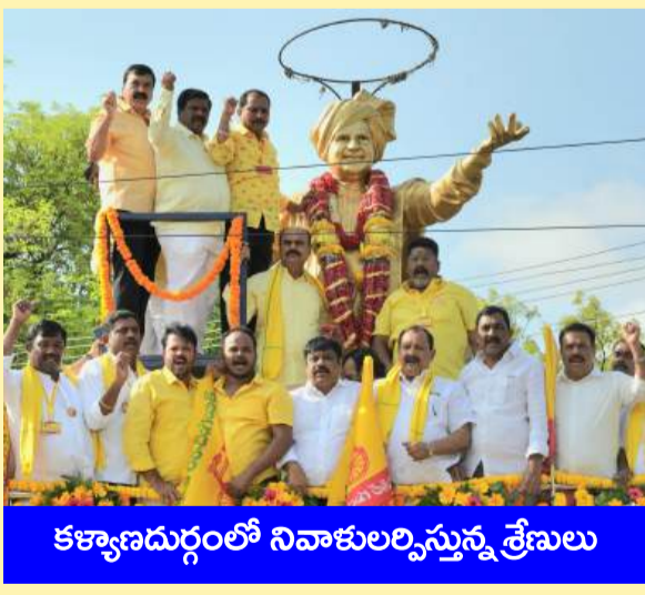
కళ్యాణదుర్గంలో నివాళులర్పిస్తున్న శ్రేణులు