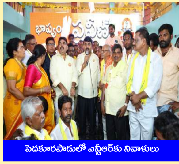
పెదకూరపాడులో ఎన్టీఆర్ కు నివాళులు