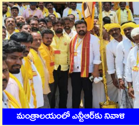
మంత్రాలయంలో ఎన్టీఆర్ కు నివాళి