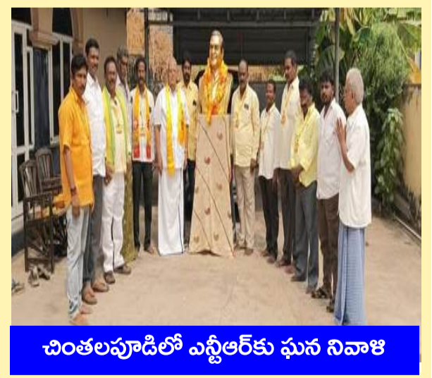
చింతలపూడిలో ఎన్టీఆర్ కు ఘన నివాళి