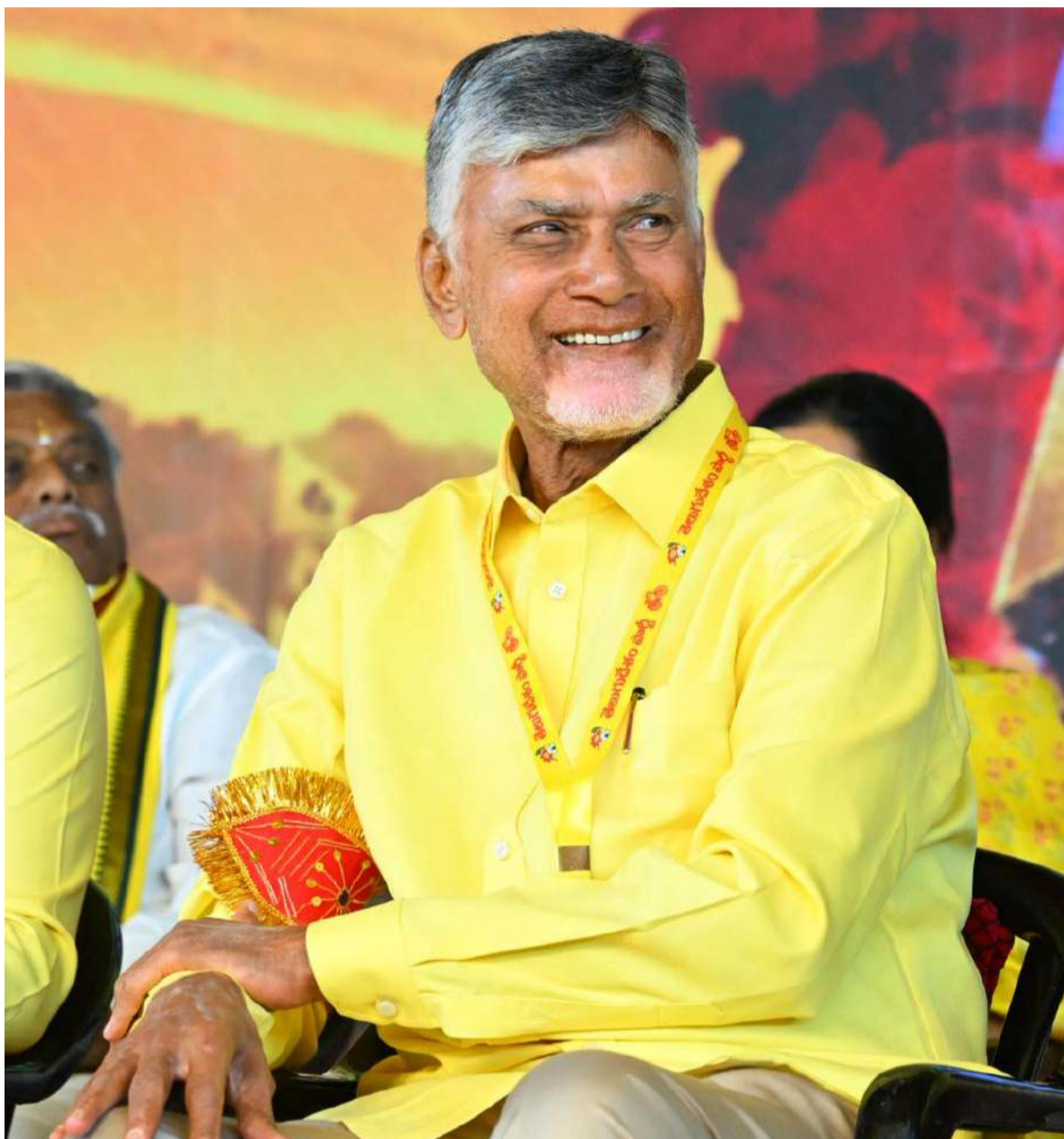
ఎన్టీఆర్ ఖ్యాతి మరెవరికీ సాధ్యం కాదు

'తెలుగు జాతి ఉన్నంత వరకూ తెలుగువారి గుండెల్లో శాశ్వతం గా నిలిచిపోయే వ్యక్తి ఎన్టీఆర్.