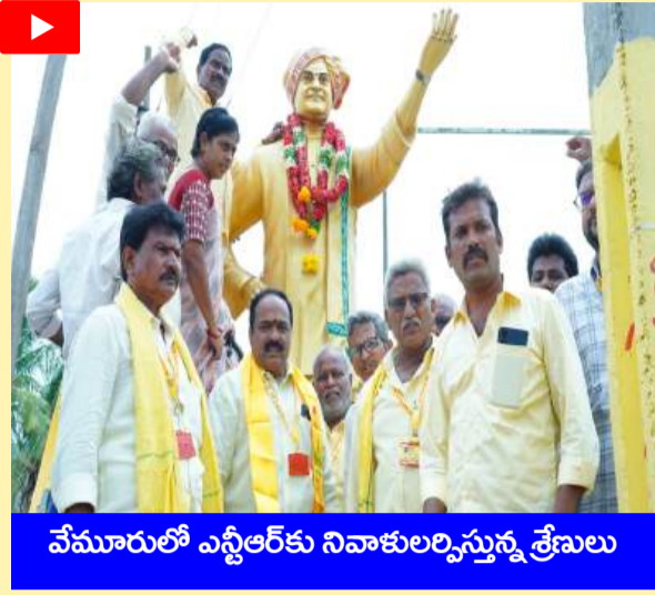
వేమూరులో ఎన్టీఆర్ కు నివాళులర్పిస్తున్న శ్రేణులు