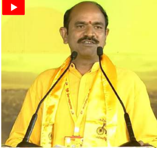
కాపాడుకుంటూ ప్రజలకు మంచి సేవలు అందించే విధంగా కృషి చేస్తానని మనస్ఫూర్తిగా తెలియజేస్తున్నాను’.

తెలుగు వాడి గుండెల్లో చిరస్థాయిలా నిలిచిపోతుంది. టీడీపీ జెండా పట్టుకుని ఒక బాధ్యత గల కార్యకర్తగా పనిచేసిన నన్ను ఈ రోజు ఎంపీగా నిలబెట్టిన ఘనత చంద్రబాబుదే. ఈ పదవిని నేను బాధ్యతగా చేయలేనేమోనని భయపడి వెనుకడుగు వేస్తే చంద్రబాబు ధైర్యం చెప్పి ముందకు నడిపించారు. ఒక్క ఆంధ్రప్రదేశ్లోనే కాదు ఏ దేశం వెళ్లినా తెలుగుదేశం కార్యకర్తకు ఉండే గౌరవం చాలా గొప్పది. సామాన్య వ్యక్తిగా ఉన్న నన్ను కోట్ల మంది ప్రజలకు సేవచేసే నాయకుడిగా తీర్చిదిద్దిన పార్టీ టీడీపీ. పార్టీని ఎల్లప్పుడూ