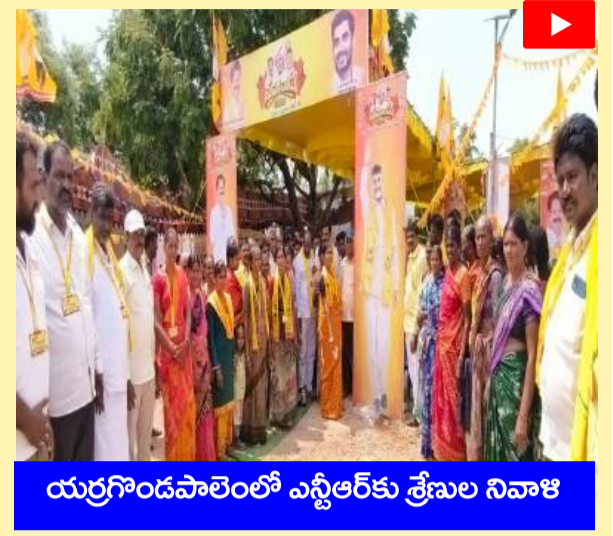
యర్రగొండపాలెంలో ఎన్టీఆర్ కు శ్రేణుల నివాళి