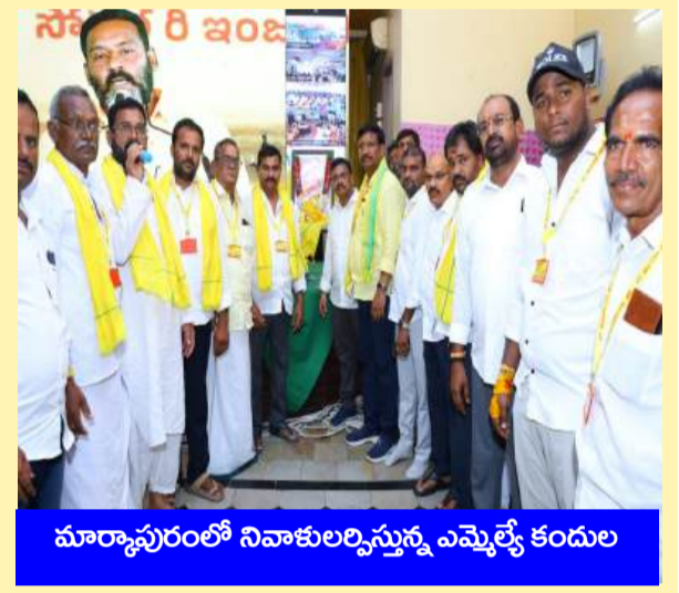
మార్కాపురంలో నివాళులర్పిస్తున్న ఎమ్మెల్యే కందుల