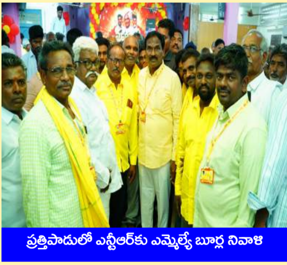
ప్రత్తిపాడులో ఎన్టీఆర్ కు ఎమ్మెల్యే బూర్ల నివాళి