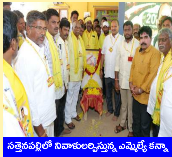
సత్తెనపల్లిలో నివాళులర్పిస్తున్న ఎమ్మెల్యే కన్నా