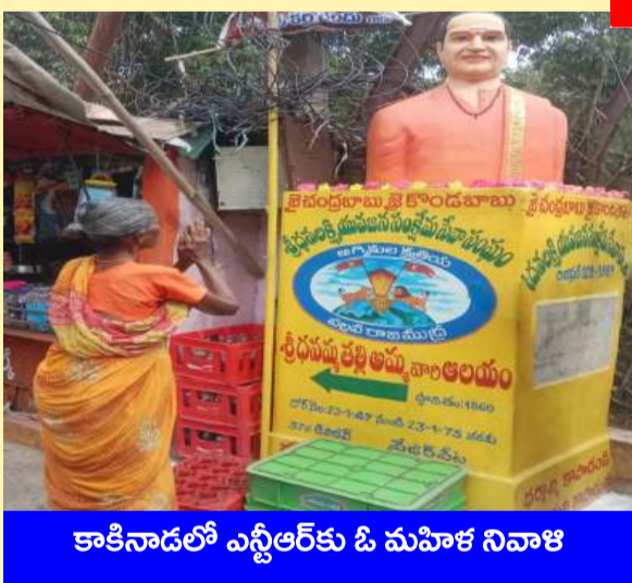
కాకినాడలో ఎన్టీఆర్ కు ఓ మహిళ నివాళి