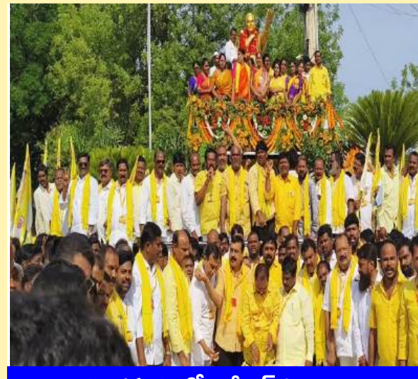
అనంతపురంలో ఎన్టీఆర్ కు నివాళి