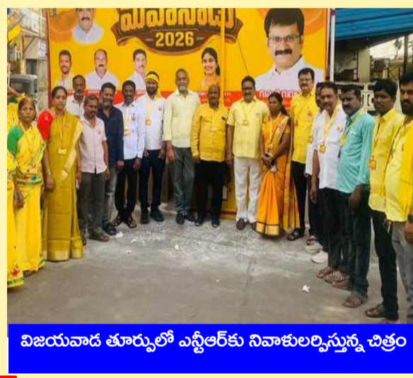
విజయవాడ తూర్పులో ఎన్టీఆర్ కు నివాళులర్పిస్తున్న చిత్రం