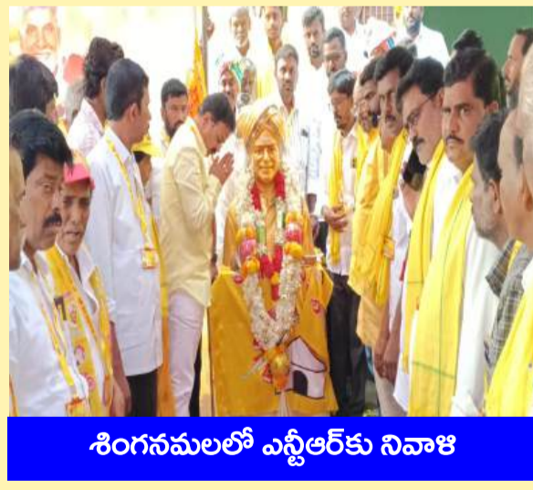
శింగనమలలో ఎన్టీఆర్ కు నివాళి