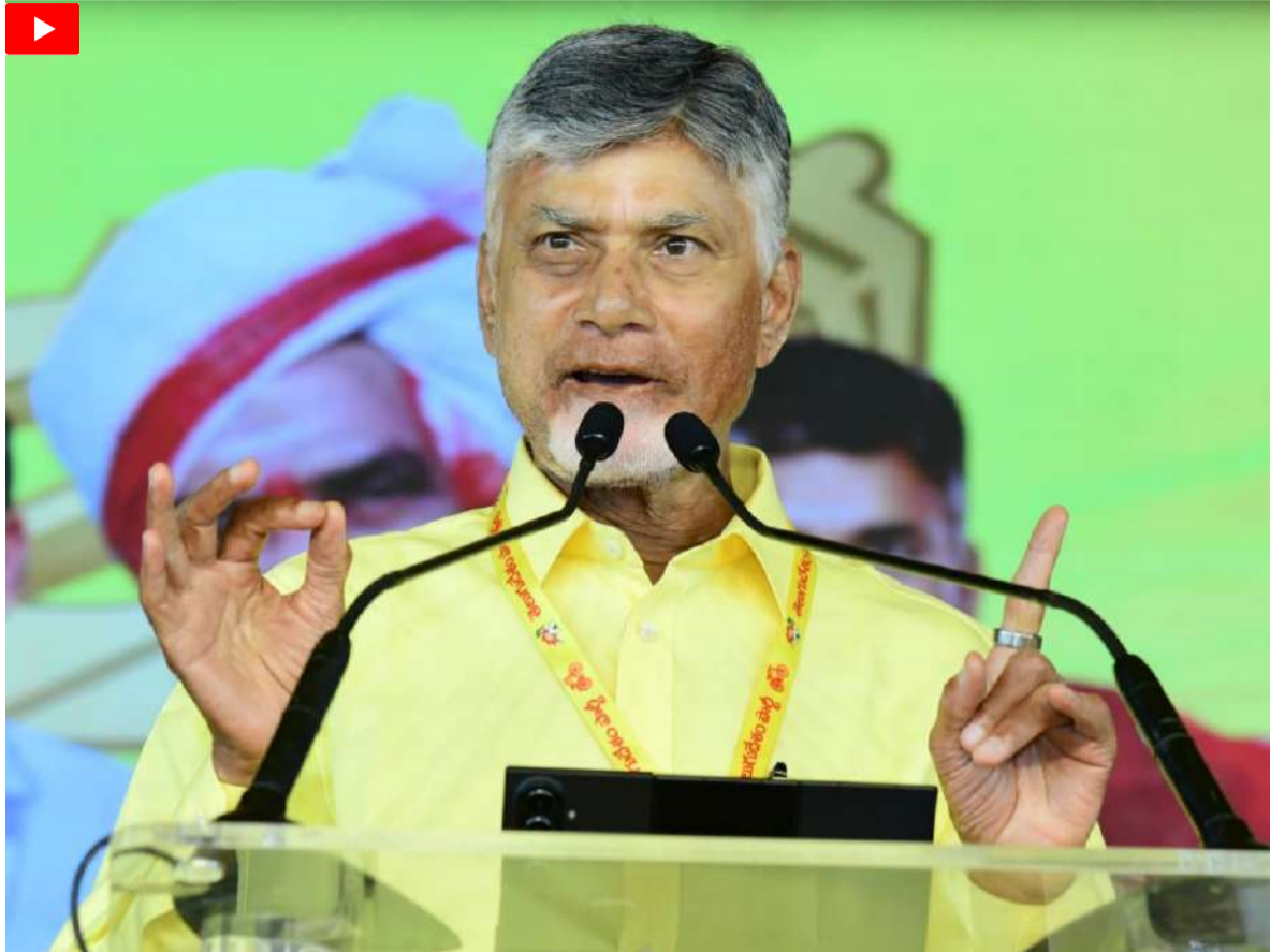
రాష్ట్రం మీద గొడవల వేటు పడకూడదు

“రాష్ట్రంలో గొడవల పార్టీ నేరాలు ఘోరాలు చేస్తోంది. రాజకీయాల్లో ఇలాంటి వాటిని నేను ఎప్పుడూ ఊహించలేదు. బాబాయిని హత్య చేసి నాచేతికే మరక అంటించే ప్రయత్నం చేశారు. గొడవల పార్టీకి అధికారం పోయింది.. ప్రతిపక్ష హోదా పోయింది.. అయినా అహంకారం మాత్రం పోలేదు. కుట్ర, కుతంత్రాలు మాత్రం మానటం లేదు. దేశంలో ఏ రాజకీయ పార్టీకైనా యువత, రైతులు, మహిళలు ఇతర వర్గాలు విభాగాలుగా ఉంటాయి. కానీ గొడవల పార్టీకి గంజాయి బ్యాచ్, బ్లెడ్ బ్యాచ్, సోషల్ మీడియా సైకోల బ్యాచ్, ఫేక్ ప్రచారాల కోసం పేటీఎం బ్యాచ్, హత్యా రాజకీయాల కిరాయి హంతక బ్యాచ్, దేవాల యాలపై దాడి చేసే బ్యాచ్, కల్తీ లిక్కర్ బ్యాచ్ కూడా మరో విభాగంగా గొడవల పార్టీకి ఉంది. ఇలా ఏడు విభాగాలు ఏర్పాటు చేసుకుని రాష్ట్రాన్ని విధ్వంసం చేసేందుకు కుట్రలు పన్నుతోంది. ప్రభుత్వం చేసే మంచి పనులను ప్రజలకు అర్థమయ్యే చెప్పడానికి ఎంత బాధ్యతగా తీసుకుంటారో.. గొడవల పార్టీ కుట్రలను ఎండగట్టే విషయంలోనూ అంతే బాధ్యత తీసుకోవాలి. గొడవల పార్టీ కుట్రలను ప్రజలకు వివరించాలి.. వాళ్లు చేసే నష్టాన్ని ప్రజలకు అవగాహన కల్పించాలి. ఇవన్నీ చేయాలంటే పబ్లిక్ తో కనెక్టివిటీ అనేది ముఖ్యం. వాళ్ల తప్పులను ఎండగడుతున్న సందర్భంలో మనం కూడా జాగ్రత్తగా ఉండాలి. ఏ స్థాయి వాళ్లకైనా క్యారెక్టర్ ముఖ్యం. మరక అంటకూడదు. ఎవరూ వేలెత్తి తప్పు పట్టని విధంగా నేతలు, కార్యకర్తలు పనిచేయాలి. ప్రజా జీవితంలో ఉండే వాళ్లకు ఓపిక అవసరం. స్థానిక ఎన్నికల్లో మనం అంతా కలిసి సత్తా చాటాలి. ప్రతి ఎన్నికల్లో గెలవాలి. 2029 ఎన్నికలకు ఇప్పటి నుంచే సిద్ధం కావాలి. ఎన్డీయే భాగస్వామ్య పార్టీలు, నేతలు, కార్యకర్తలతో సమన్వయంతోపాటు సఖ్యతతో మెలగాలి. గొడవల పార్టీ నెవర్ అగైన్, ఎన్డీయే అగైన్ అండ్ అగైన్ అనేది నినాదమే మనది కావాలని పిలుపు ఇచ్చారు.