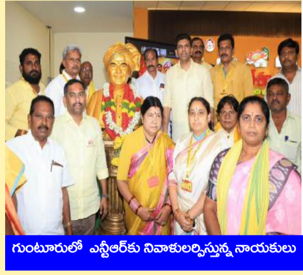
గుంటూరులో ఎన్టీఆర్ కు నివాళులర్పిస్తున్న నాయకులు