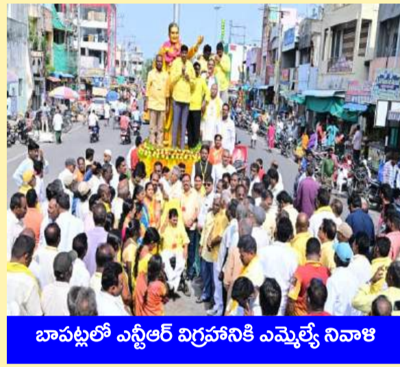
బాపట్లలో ఎన్టీఆర్ విగ్రహానికి ఎమ్మెల్యే నివాళి