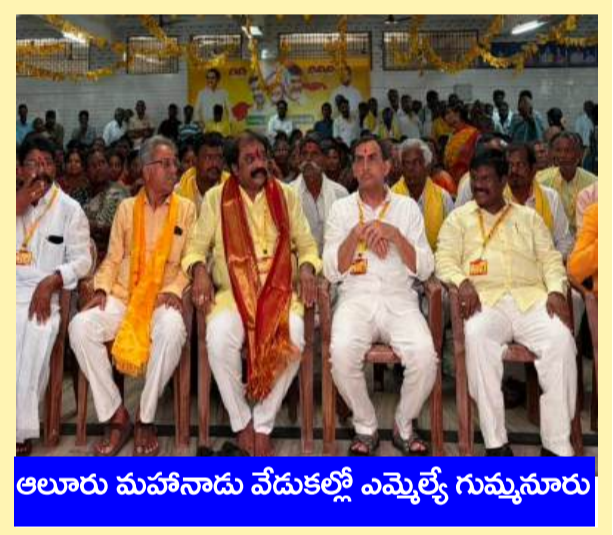
అలూరు మహానాడు వేడుకల్లో ఎమ్మెల్యే గుమ్మనూరు