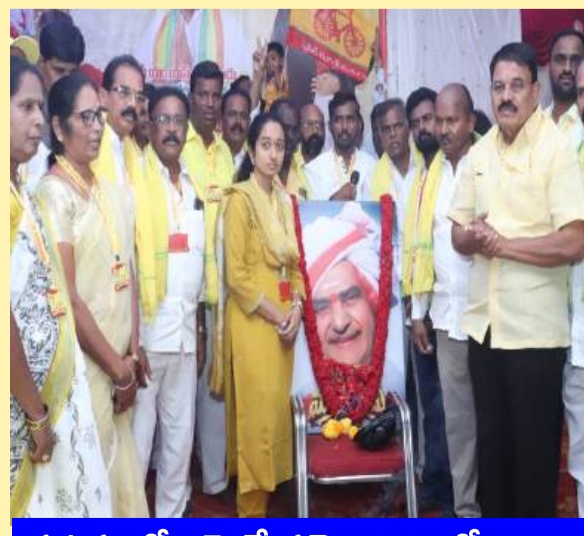
పుట్టపర్తిలో ఎమ్మెల్యే పల్లె ఆధ్వర్యంలో నివాళి