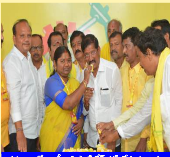
కర్నూలులో ఎంపీ బస్తిపాటి కేకే కట్ చేస్తున్న చిత్రం