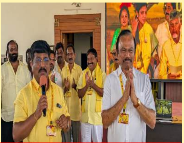
కనిగిరిలో కార్యకర్తలకు నేతల సందేశం