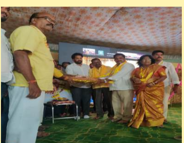
అమలాపురంలో కార్యక్రమాన్ని ప్రారంభిస్తున్న ఎంపీ