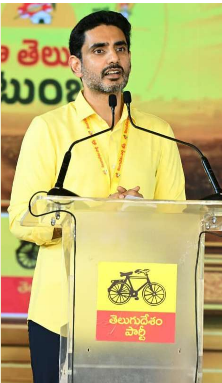
టీడీపీలో కార్యకర్త అధినేత

బద్దలు కొట్టడం ఎవరివల్లా సాధ్యం కాదు. దేశానికి సంక్షేమం, అభివృద్ధి పరిచయం చేసింది ఎన్టీఆర్. సమాజమే దేవాలయం.. ప్రజలే దేవుళ్లని చెప్పిన మాట మన సిద్ధాంతం. 2 రూపాయలకు కిలో బియ్యం, పెన్షన్, 50/హార్స్ పవర్ విద్యుత్, జనతా వస్త్రాలు, పక్కా ఇళ్లు, గురుకుల పాఠశాలలు, మధ్యాహ్న భోజన పథకం, పటేల్-పట్టాభి విధానం రద్దు, సాగునీటి ప్రాజెక్టుల నిర్మాణం, పరిశ్రమల ఏర్పాటు, రోడ్ల నిర్మాణం, స్థానిక సంస్థల ఎన్నికల్లో బీసీ రిజర్వేషన్లు వంటివి ప్రవేశపెట్టింది ఎన్టీఆర్. స్త్రీశక్తిని మొదట గుర్తించింది, మహిళలకు ఆస్తిలో సమాన హక్కు ఇచ్చింది, మహిళల కోసం ప్రత్యేకంగా పద్యావతి యూనివర్సిటీ పెట్టింది, మహిళలకు స్థానిక సంస్థల్లో రిజర్వేషన్లు ఇచ్చింది అన్న ఎన్టీఆర్ అని గుర్తుచేశారు.