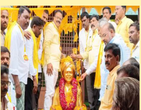
శింగనమల నార్వల మండలంలో