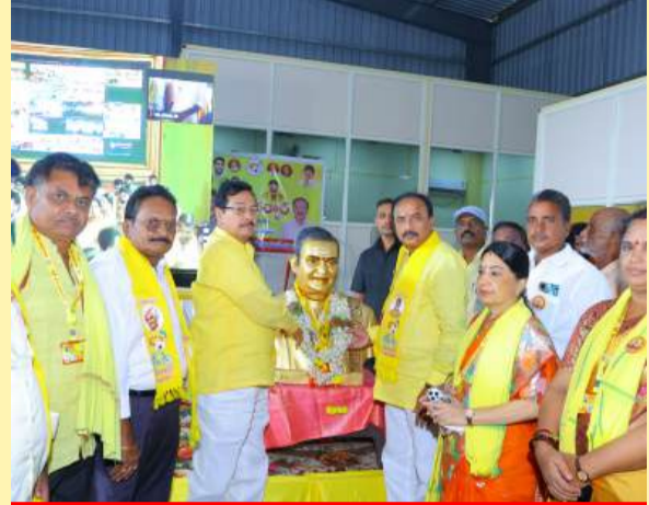
చీరాలలో అన్లైన్ మహానాడులో ఎమ్మెల్యే ఎం.ఎం.కే