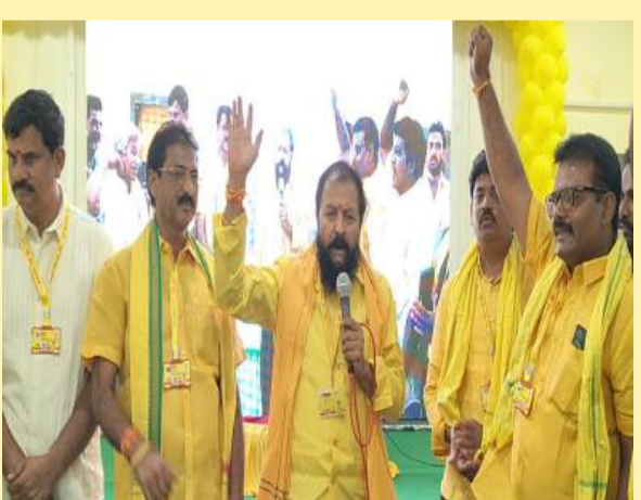
దెందులూరులో ఎమ్మెల్యే చింతమనేని