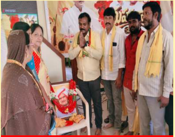
నందికొట్కూరులో ఎన్టీఆర్ కు నివాళులర్పిస్తున్న చిత్రం