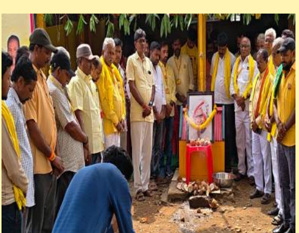
పోలవరం నియోజకవర్గంలో శ్రేణుల సందడి