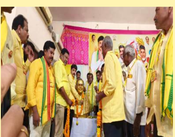
చింతలపూడిలో ఎన్టీఆర్ కు ఘన నివాళి