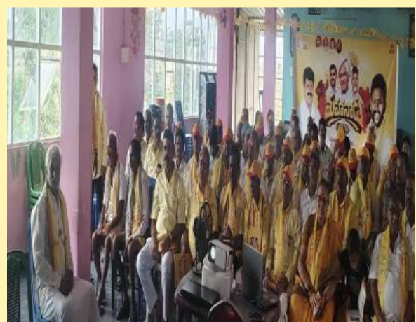
పాతపట్నంలో శ్రేణుల సంబురం