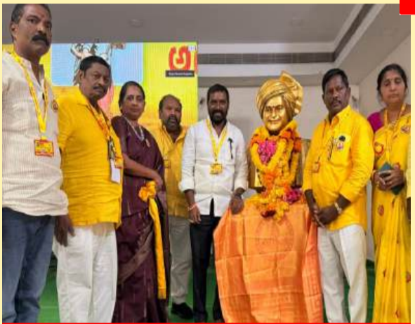
నర్సాపురం పార్లమెంట్ పరిధిలో మహానాడు