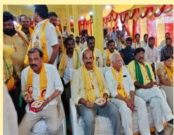
నూజివీడులో శ్రేణులతో మంత్రి పార్థసారథి