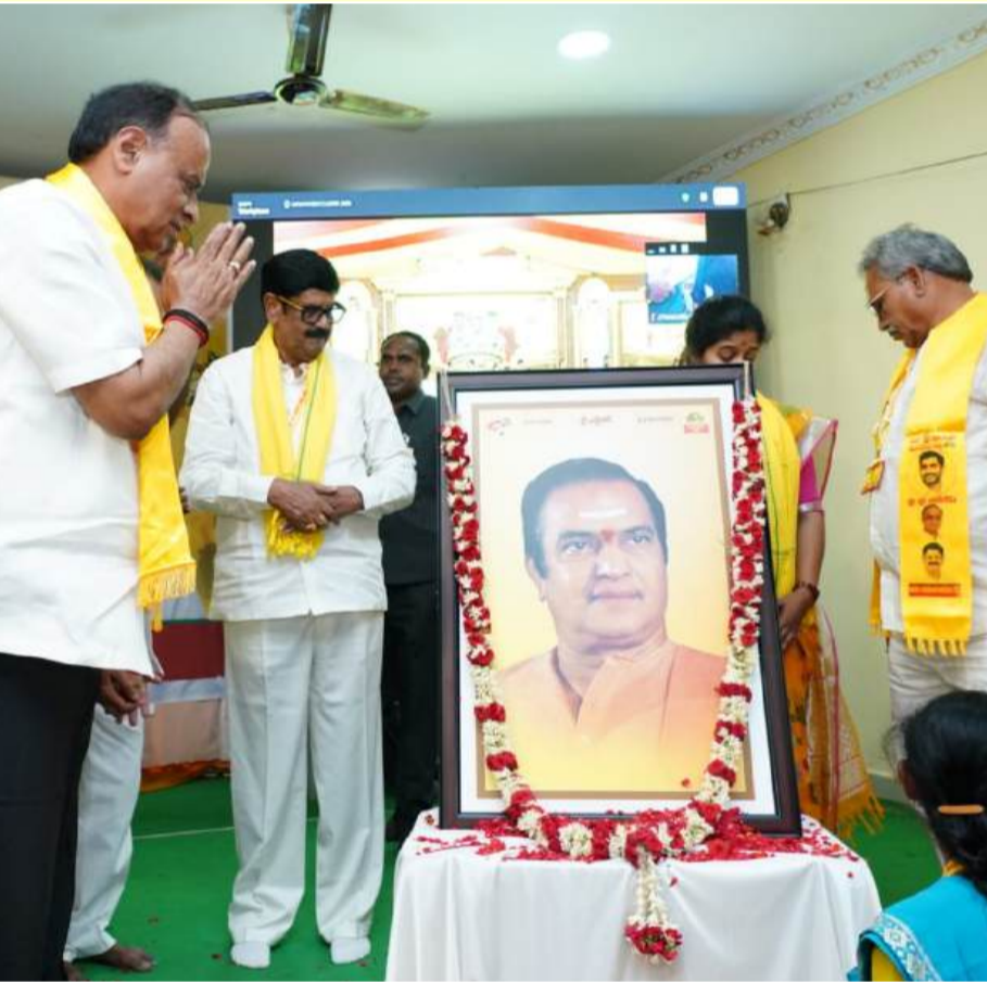
మార్కాపురం జిల్లా యర్రగొండపాలెం నియోజకవర్గంలో యర్రగొండపాలెం మండలం క్షస్ర 3 పరిధిలో బోయలపల్లి గ్రామం వద్ద శ్రీ భవన స్కూల్ నందు ఘనంగా జరుగుతున్న డిజిటల్ మహానాడు వేదికలు