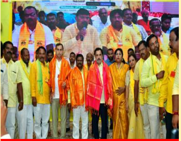
కళ్యాణదుర్గంలో ఘనంగా హైబ్రీడ్ మహానాడు