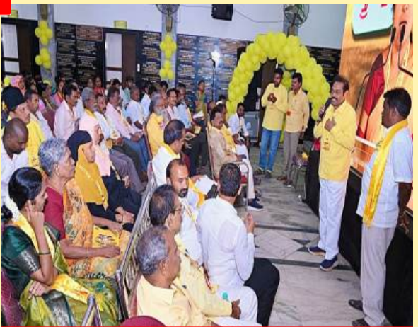
నెల్లూరు నగరంలో సందడిగా మహానాడు