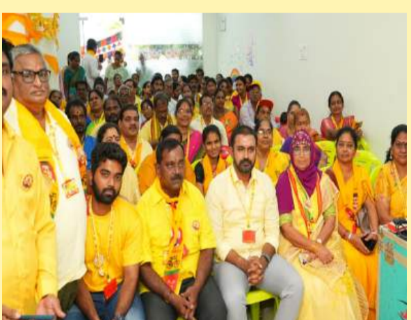
రాజమహేంద్రవరంలో శ్రేణులతో ఎమ్మెల్యే ఆదిరెడ్డి