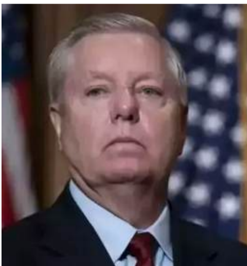
పాకిస్థాన్ పై అమెరికా సెనెటర్ లిండ్సే గ్రాహం తీవ్రంగా మండిపడ్డారు. అమెరికా-ఇరాన్ మధ్య కొనసాగుతోన్న శాంతి చర్చల్లో