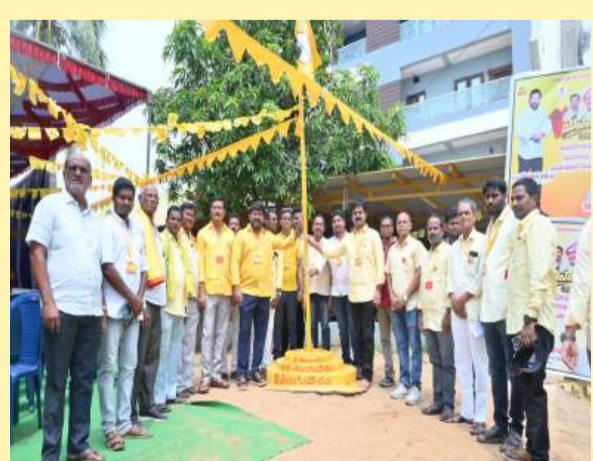
పార్వతీపురంలో పార్టీ జెండా ఆవిష్కరణ