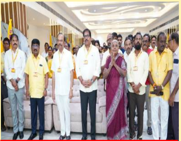
ఒంగోలు వర్షువల్ మహానాడులో పాల్గొన్న నేతలు