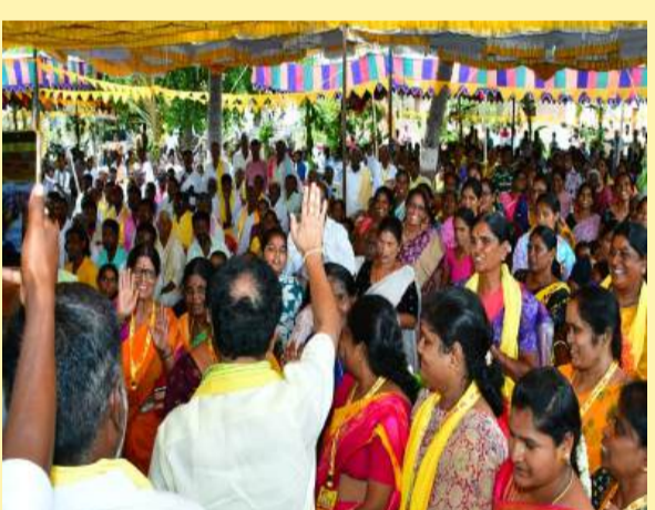
కంబదూరు మండల కేంద్రంలో శ్రేణుల ఉత్సాహం