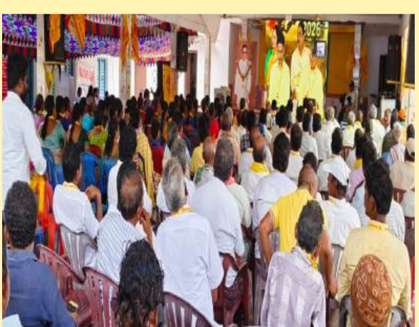
కైకలూరులో మహానాడును తిలకిస్తున్న శ్రేణులు