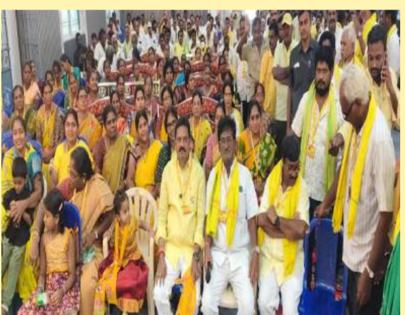
కోవూరులో శ్రేణులతో ఎమ్మెల్యే వీక్షణ