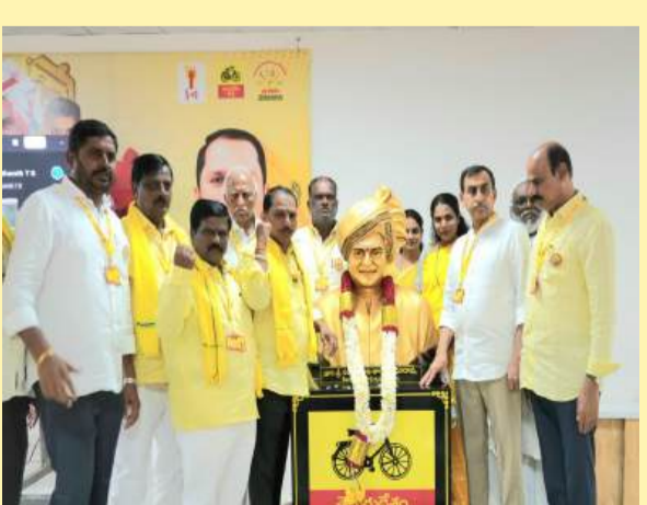
అనంతపురంలో ఎన్టీఆర్ కు ఘన నివాళులు