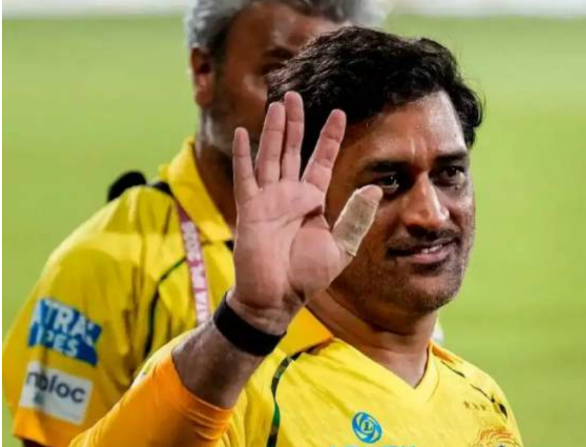
చెన్నై: ఐపీఎల్లో చెన్నై సూపర్ కింగ్స్ అంటే ధోని.. ధోని అంటే చెన్నై సూపర్ కింగ్స్. ఆ జట్టుకు ధోని ఐదు సార్లు టైటిల్స్ అందించాడు. వయసు

పెరుగుతున్నా, గాయాల పాలవుతున్నా ధోనిని ఆ జట్టు వదులుకోవడం లేదు. దీంతో గతేడాది చివర్లో బ్యాటింగ్కు వచ్చి అభిమానులను అలరించాడు. ఈ సీజన్ లో కూడా అలాగే చేస్తాడని అందరూ అనుకున్నారు. అయితే అతడు ఇప్పటివరకు సీఎస్కే తరపున బరిలోకి దిగలేదు. ఫిట్నెస్ సమస్యలతోనే అతడు ఒక్క మ్యాచ్ కూడా ఆడలేకపోయాడు. సీఎస్కే ఇప్పటికే లీగ్ దశలో 13 మ్యాచ్లు ఆడేసింది. తన చివరి లీగ్ మ్యాచ్ను గుజరాత్ టైటాన్స్తో ఈ రోజు (గురువారం) అహ్మదాబాద్లో ఆడనుంది. ఈ మ్యాచ్లో అయినా ధోని ఆడతా డని అభిమానులు ఆశలు పెట్టుకున్నారు. అయితే వారికి నిరాశ తప్పడం లేదు. ఎందుకంటే ధోని అహ్మదాబాద్ కు కాకుండా రాంచీ వెళ్లాడు. ఎందుకు వెళ్లాడనేది తెలియదు కానీ, ఈ రోజు మ్యాచ్కు మాత్రం అందుబాటులో ఉండడం లేదు. ప్రస్తుతం సీఎస్కే 12 పాయింట్లతో ఏడో స్థానంలో ఉంది. గుజరాత్తో మ్యాచ్లో గెలిస్తే సీఎస్కే ఖాతాలో 14 పాయింట్లు ఉంటాయి. పంజాబ్, కేకేఆర్, ఆర్ఆర్ తమ చివరి మ్యాచ్లో ఓడిపోతే సీఎస్కేకు ప్లే ఆఫ్స్ కు చేరే అవకాశం వస్తుంది. ఒకవేళ అద్భుతం జరిగి చెన్నై జట్టు ప్లే ఆఫ్స్ కు చేరితే ధోని ఆడతాడని వార్తలు వస్తున్నాయి. మరి, ధోనిని మరోసారి మైదానంలో చూడాలనుకునే అభిమానుల ఆశలు నెరవేరుతాయో లేదో చూద్దాం.