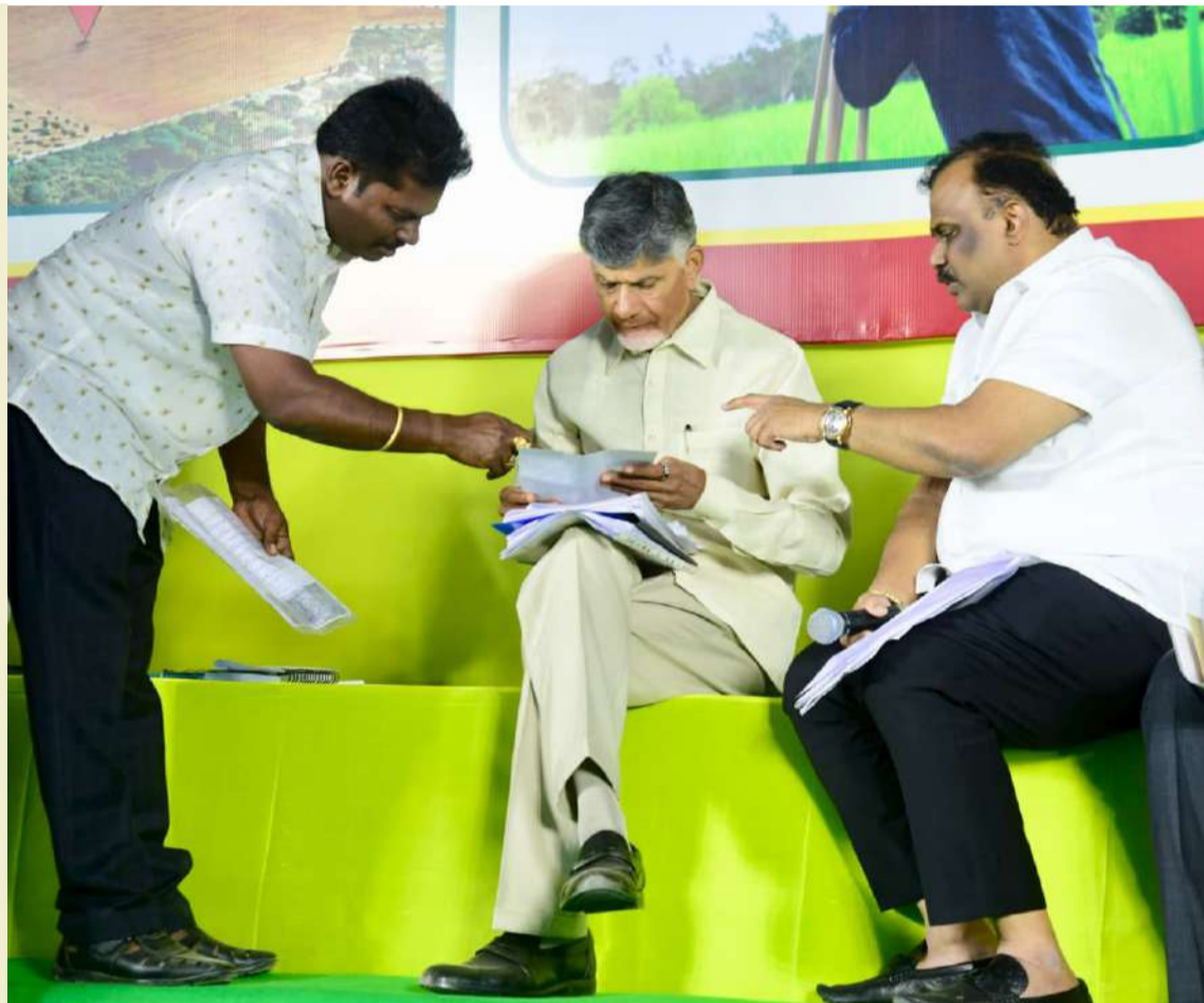
కృష్ణా జిల్లా కంకిపాడు మండలం ఈడుపుగల్లు గ్రామంలో జరిగిన రెవెన్యూ సదస్సులో పాల్గొన్న ముఖ్యమంత్రి నారా చంద్రబాబు నాయుడు, రెవెన్యూ శాఖ మంత్రి అనగాని సత్యప్రసాద్ (ఫైల్ ఫోటో)

రీ సర్వే 2.0లో రైతులను భాగస్వాములను చేసి సమర్థవంతంగా నిర్వహిస్తున్నారు. భవిష్యత్తులో వివాదాలకు తావులేని భూ రికార్డులను రూపొందిస్తున్నారు. రెవెన్యూ వ్యవస్థలో బ్లాక్ చెయిన్ టెక్నాలజీని ఉపయోగిస్తూ రెవెన్యూ, రిజిస్ట్రేషన్, మున్సిపల్ శాఖలను అనుసంధిస్తూ భూములకు డిజిటల్ భద్రతను ప్రభుత్వం కల్పిస్తోంది. రైతులే నేరుగా ఆన్లైన్లో తమ భూములకు సంబంధించి 1బి, ఆడంగల్ కు సొంతంగా డిజిటల్ లాక్ చేసుకునే అవకాశాన్ని కూటమి ప్రభుత్వం తీసుకొచ్చింది. దీంతో రైతుల అనుమతి లేకుండా ఏ అధికారి కూడా ఆ భూమిని మ్యూజీషన్ గానీ, రిజిస్ట్రేషన్ గానీ చేయడానికి వీలులేదు. అలాగే 15 రకాల భద్రతా అంశాలతో రాజముద్రతో పకడ్బందీగా రూపొందించిన కొత్త పట్టాదారు పాస్ పుస్తకాలను కూడా రైతులకు ప్రభుత్వం అందిస్తోంది.