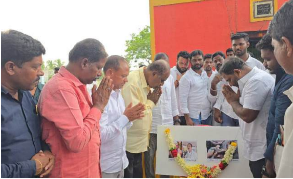
కుప్పం (చైతన్యరథం): వైసీపీ అన్యాయాలపై టీడీపీ నేతలు హయాంలో ఎస్సీలపై జరిగిన దౌర్జన్యాలు, విరుచుకుపడ్డారు. కుప్పం