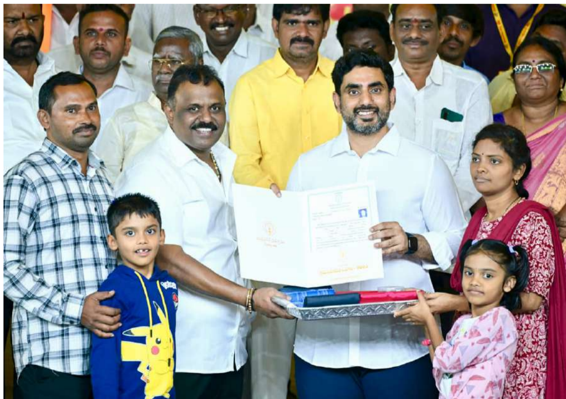
మంగళగిరి నియోజకవర్గంలో పేదల ఇళ్లను క్రమబద్ధీకరించి పట్టాలు అందజేసిన విద్యా, ఐటీ శాఖ మంత్రి నారా లోకేష్, రెవెన్యూ శాఖ మంత్రి అనగాని సత్యప్రసాద్ (ఫైల్ ఫోటో)

ఒకవైపు రెవెన్యూ వ్యవస్థలో పెద్ద ఎత్తున సంస్కరణలు తీసుకొస్తూనే మరోవైపు ఒక గ్రామానికో, కొందరు రైతులకో పరిమితమై ఏళ్లగా పరిష్కారం కాని భూ సమస్యలు ముఖ్యమంత్రి చంద్రబాబు, రెవెన్యూ మంత్రి అనగాని సత్యప్రసాద్ ప్రత్యేక చొరవతో పరిష్కరించబడ్డాయి. తిరుపతి జిల్లాలోని శెట్టిపల్లి గ్రామంలో రెండు వేల కోట్ల రూపాయల విలువ చేసే 380 ఎకరాల భూమిని 2,111 మంది లబ్ధిదారులకు అన్ని అడ్డంకులను తొలగించి అప్పగించారు. శ్రీసత్యసాయి జిల్లా నల్లమడ మండలం గోపెపల్లి గ్రామంలో 20 ఏళ్లుగా పెండింగ్లో ఉన్న 305 ఎకరాలకు పరిష్కారం చూపి రైతుల కళ్లలో ప్రభుత్వం ఆనందం నింపింది. ఏలూరు జిల్లాలో ఒక్క రోజులోనే 142 ఎకరాలను నిషేధిత జాబితా నుంచి తొలగించి భూ యజమానులకు ఊరటనిచ్చారు. సత్యసాయి జిల్లా ముదిగుబ్బ మండలం గుంజేపల్లి గ్రామంలో 13.59 ఎకరాల్లో ఉన్న ఇళ్ల పట్టాల భూములు ఏళ్ల తరబడి పెండింగ్లో ఉండగా నిషేధిత జాబితా నుండి తొలగించి 226 కుటుంబాలకు ప్రభుత్వం పెద్ద ఉపశమనం కల్పించింది.