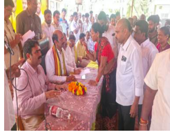
ఈ కార్యక్రమం ప్రజలకు ఎంతో ఉపయోగకరమని, ఈరోజు వచ్చిన అర్జీలను పరిశీలించి సంబంధిత అధికారులు వాటిని ఒకటి రెండు వారాల గడువులో పరిష్కరించడం జరుగుతుందని తెలిపారు.

ఎచ్చెర్ల (చైతన్యరథం): విజయనగరం పార్లమెంట్ సభ్యులు కలిశెట్టి అప్పలనాయుడు సోమవారం రాష్ట్ర ముఖ్యమంత్రి నారా చంద్రబాబు నాయుడు ఆదేశాలు ప్రకారం ఎచ్చెర్ల నియోజకవర్గం, రణస్థలం మండలం, చిల్లపేట రాజాం గ్రామంలో ప్రజల సమస్యలపై “ప్రజా దర్బార్” నిర్వహించి ప్రజల నుండి వచ్చిన వినతలను స్వీకరించి తక్షణ పరిష్కారం కొరకై సంబంధిత అధికారులతో మాట్లాడి ప్రజల సమస్యల పరిష్కారానికి కృషి చేశారు. అనంతరం ఎంపీ మాట్లాడుతూ... ప్రజాసమస్యల పరిష్కారానికి ప్రభుత్వం ఏర్పాటు చేసిన