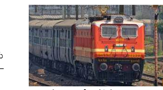
ఈ రైల్లో అన్ని ఏసీ బోగీలే ఉంటాయి. ప్రతి ఆదివారం, శుక్రవారం అనకాపల్లి-చర్లపల్లి రైలు సర్వీసులను ఇప్పటికే ప్రారంభించారు. దీంతో ఈ నెలలో మూడు రైళ్లను అనకాపల్లి నుంచి ఎంపీ సీఎం రమేష్ ప్రారంభించారు.

24 నుంచి అందుబాటులోకి వస్తుంది. ప్రతి ఆదివారం రాత్రి 9 గంటలకు సికింద్రాబాద్ స్టేషన్ నుంచి బయల్దేరి సోమవారం మధ్యాహ్నం 12 గంటలకు అనకాపల్లి చేరుకుంటుంది. అనకాపల్లి-సికింద్రాబాద్ రైలు మే 18 నుంచి ప్రయాణికులకు రెగ్యులర్ రైలుగా అందుబాటులో ఉంటుంది. ప్రతి సోమవారం సాయంత్రం 5.35 గంటలకు అనకాపల్లిలో బయల్దేరి మంగళవారం ఉదయం 8.40 గంటలకు సికింద్రాబాద్ స్టేషన్ కు చేరుకుంటుంది.