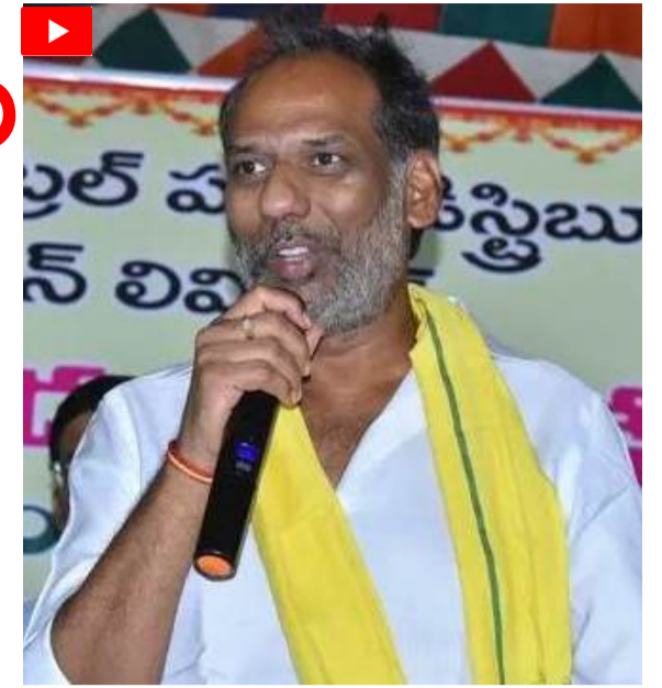
సూచించారు. రాష్ట్ర ప్రజలకు నాణ్యమైన, అంతరాయం లేని సమృద్ధిమైన విద్యుత్ సరఫరా అందించడమే ప్రభుత్వ ప్రధాన లక్ష్యమని పేర్కొన్నారు.

ఘటనలు చోటుచేసుకునే అవకాశాలు ఉన్నందున క్షేత్ర స్థాయిలో సిబ్బంది అప్రమత్తంగా ఉండాలని సూచించారు. అందుకు అవసరమైన సామగ్రి సంసిద్ధంగా ఉంచుకోవాలని సూచించారు. అలాగే కేంద్ర, రాష్ట్ర ప్రభుత్వాల ప్రాధాన్య పథకాలైన సూర్యఘర్, పీఎం కుసుమ్, ఆర్డీఎస్ఎస్ కార్యక్రమాల లక్ష్యాలను నిర్దేశిత గడువులో పూర్తి చేయాలని ఆదేశించారు. ముఖ్యంగా సూర్యఘర్ పథకంలో భాగంగా ఎన్నో లబ్ధిదారుల లక్ష్యంగా పెట్టుకున్న 6లక్షల కనెక్షన్లను జూలై నాటికి పూర్తి చేయడంతో పాటు ఇతర పర్గాలకు కూడా సోలార్ కనెక్షన్లను అందించే కార్యక్రమాన్ని వేగవంతం చేయడం ద్వారా ప్రభుత్వ లక్ష్యాన్ని త్వరగా చేరుకునేలా చర్యలు తీసుకోవాలని