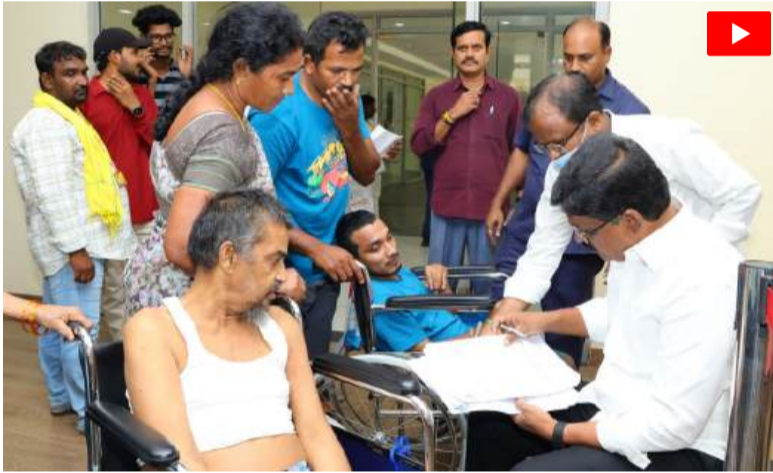
ప్రస్తుతం నా ఆధీనంలో ఉన్న 1.50 ఎకరాల భూమిని ఆన్లైన్ (అడంగల్)లో నమోదు చేయమని రెవెన్యూ అధికారుల చుట్టూ తిరిగినా పట్టించుకోవట్లేదు.