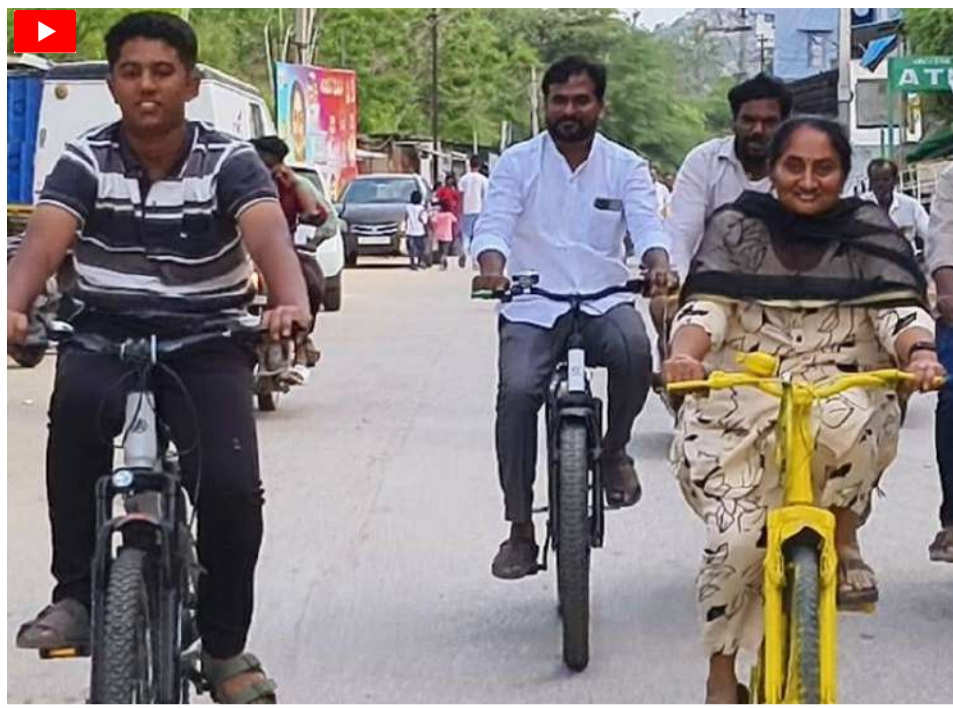
ఇంటి దగ్గర నుండి సైకిల్ పై నుండి బయలుదేరి రైల్వే స్టేషన్ కు వచ్చిన మంత్రి సచిత్ర