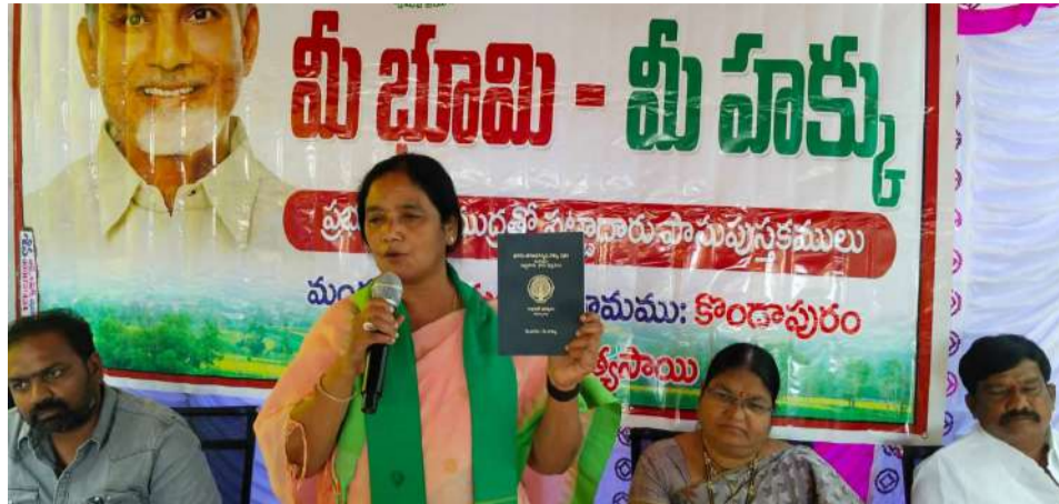
మీభూమి, మీహక్కు కార్యక్రమంలో భాగంగా, రామగిరి మండలం, పెద్ద కొండాపురం పంచాయతీలో, రైతులకు రాజముద్రతో కూడిన పట్టాదారు పాసుపుస్తకాల పంపిణీ కార్యక్రమంలో అధికారులు, రైతులతో కలిసి పాల్గొన్న రాష్ట్ర ఎమ్మెల్యే పరిటాల సునీత

బ్రాహ్మణపల్లి నుండి పందిపర్తి వరకు, మంచేపల్లి నుండి పందిపర్తి వరకు, అలాగే పోలేపల్లి నుండి రాచుపల్లి క్రాస్ వరకు రోడ్ల నిర్మాణానికి త్వరలో శంకుస్థాపన చేయనున్నట్లు తెలిపారు. అదేవిధంగా చాలాకూరు నుండి మండ్లి, జూలకుంట చెరువులకు హెచ్ఎస్ఎస్ఎస్ కాలువ ద్వారా రూ.14 కోట్లతో సాగునీటి ప్రాజెక్టుకు ప్రతిపాదనలు పంపినట్లు తెలిపారు. ఆమోదం వచ్చిన వెంటనే పనులు ప్రారంభించి, సుమారు పది చెరువులకు నీరు అందించేలా చర్యలు తీసుకుంటామని పేర్కొన్నారు. అభివృద్ధి పథంలో ముందుకు సాగుతున్న ప్రభుత్వానికి ప్రజలు మరింత మద్దతు ఇవ్వాలని మంత్రి సవిత కోరారు. ఈ కార్యక్రమంలో కూటమి నాయకులు, కార్యకర్తలు, అధికారులు, ప్రజలు పెద్ద సంఖ్యలో పాల్గొన్నారు.