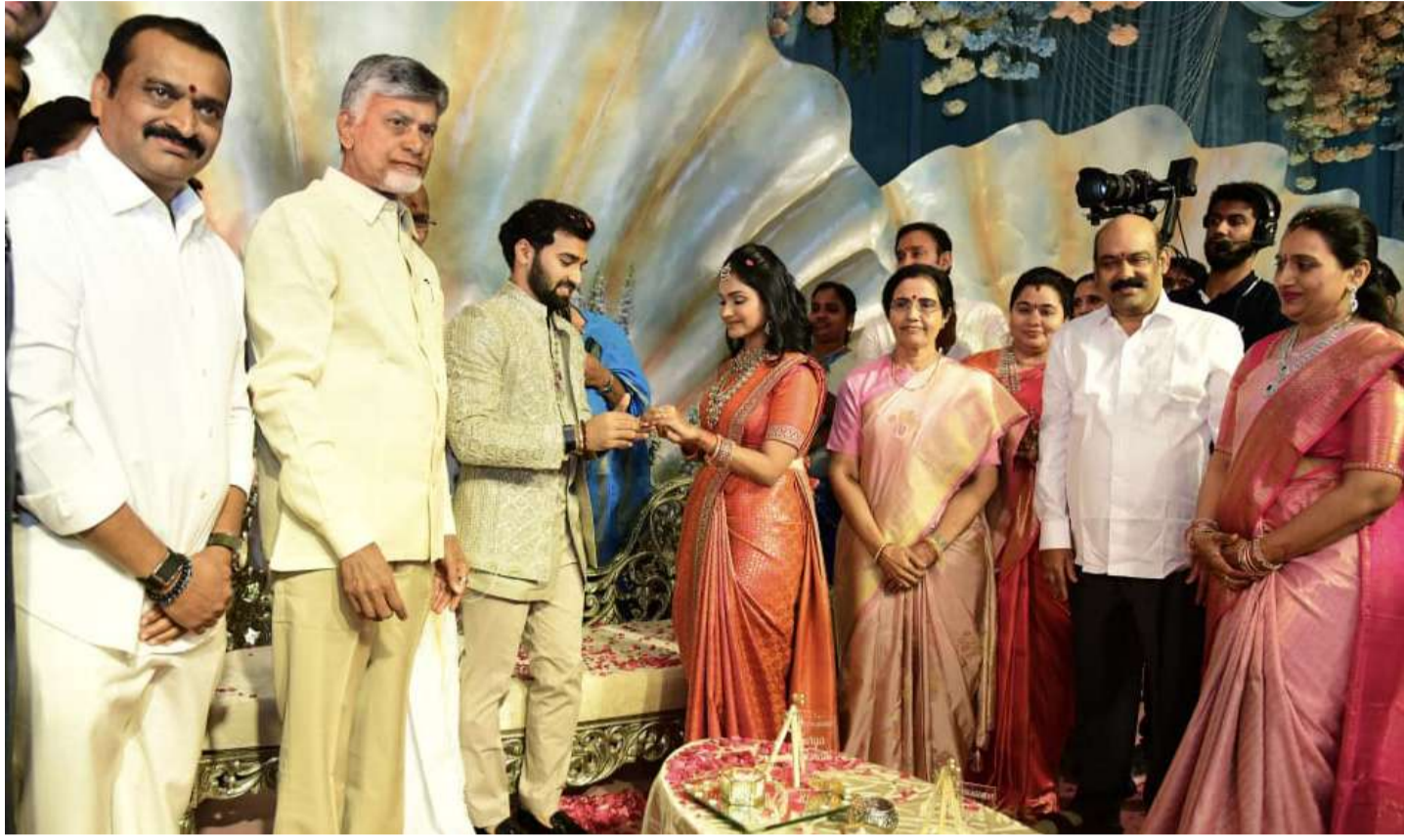
నిశ్చితార్థ వేడుకలకు సీఎం చంద్రబాబు