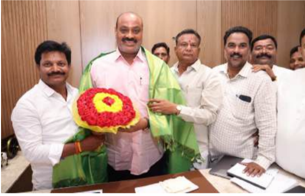
బలోపేతం చేయాలని పిలుపునిచ్చారు. అలాగే, ప్రభుత్వం అమలు చేస్తున్న సంక్షేమ, అభివృద్ధి కార్యక్రమాలను ప్రజల్లో సమర్థవంతంగా అవగాహన కల్పించాలని సూచించారు.

నియమించడం పార్టీ శ్రేణులు, ముఖ్యంగా యువతలో నూతనోత్సాహాన్ని నింపిందని నాయకులు పేర్కొన్నారు. ఈ సందర్భంగా మంత్రి కింజరాపు అచ్చెన్నాయుడు మాట్లాడుతూ... రాష్ట్ర ఐటీ, విద్యాశాఖ మంత్రిగా నారా లోకేష్ అన్ని రంగాల్లో రాష్ట్రాన్ని ముందంజలో నిలిపేందుకు చేపడుతున్న సంస్కరణలు, కృషి ప్రశంసనీయమన్నారు. యువత, పార్టీ శ్రేణులు మరింత ఉత్సాహంతో గ్రామ స్థాయి నుంచి రాష్ట్ర స్థాయి వరకు పార్టీని