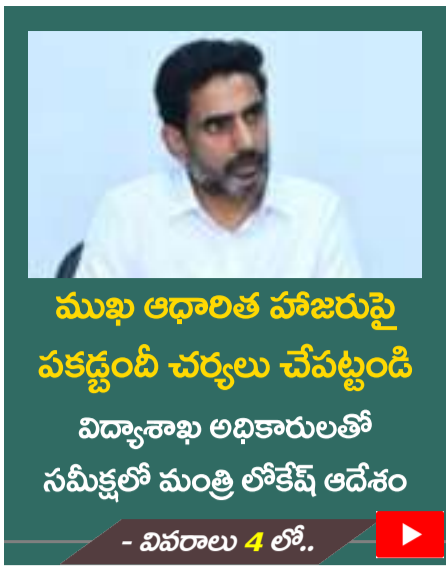
ముఖ ఆధారిత హాజరుపై పకడ్బందీ చర్యలు చేపట్టండి విద్యాశాఖ అధికారులతో సమీక్షలో మంత్రి లోకేశ్ ఆదేశం - వివరాలు 4 లో..