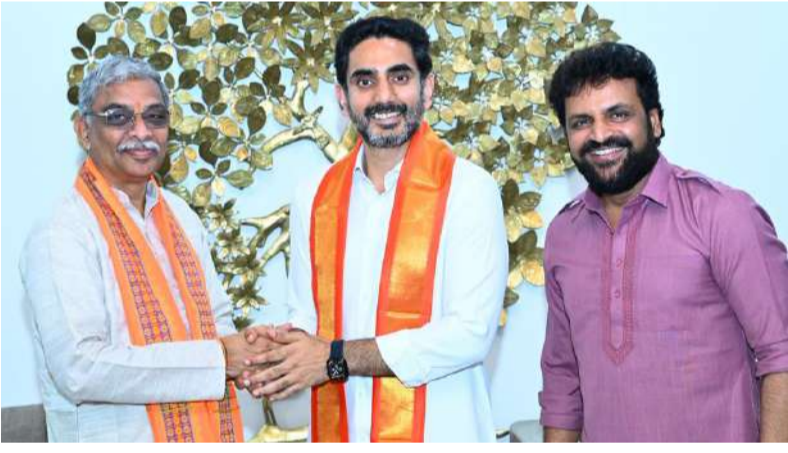
ధార్మిక కార్యక్రమాలపై ప్రభుత్వంతో కలిసి పనిచేస్తామని విశ్వహిందూ పరిషత్ ముఖ్యనేతలు మంత్రి లోకేశ్ కు స్పష్టం చేశారు. గురువారం ఉండవల్లి నివాసంలో మంత్రి లోకేశ్ ను మర్యాద పూర్వకంగా కలిసి.. గోసంరక్షణ, గోవధ నిషేధం, దేవాలయ భూముల పరిరక్షణపై చర్చిస్తున్న దృశ్యం.