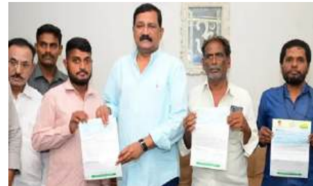
కూటమి నాయకులు పాల్గొన్నారు.