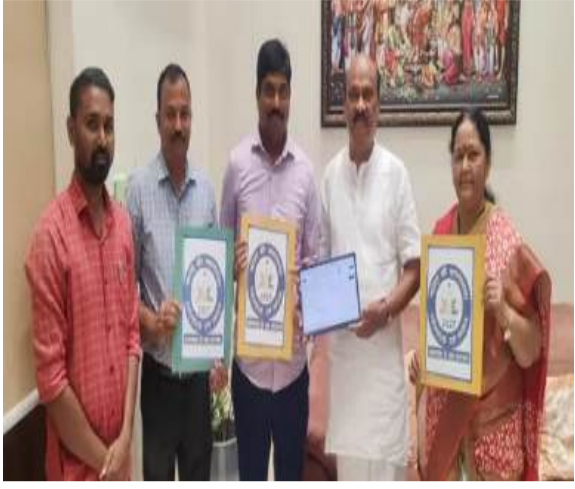
నర్సపట్నం (చైతన్యరథం): భారత ప్రభుత్వం ప్రతిష్టాత్మకంగా చేపట్టిన జనగణన-2027 ప్రక్రియలో

భాగంగా ఏపీ అసెంబ్లీ స్పీకర్ చింతకాయల అయ్యన్నపాత్రుడు గురువారం అనకాపల్లి జిల్లా నర్సపట్నంలోని తన నివాసంలో సెల్స్ ఎన్యూమరేషన్ ప్రక్రియ పూర్తి చేశారు. దేశవ్యాప్తంగా ఇవాల్దీ నుంచి (ఏప్రిల్ 16) ప్రారంభమైన ఇక్కడ జాబితా, ఇక్కడ గణన తొలి విడత కార్యక్రమంలో భాగంగా ఆయన అధికారిక వెబ్సైట్ ద్వారా ఈ ప్రక్రియను పూర్తి చేశారు. ఈ సందర్భంగా అయ్యన్న మాట్లాడుతూ.. ప్రతి ఒక్కరూ బాధ్యతగా ఈ గణనలో