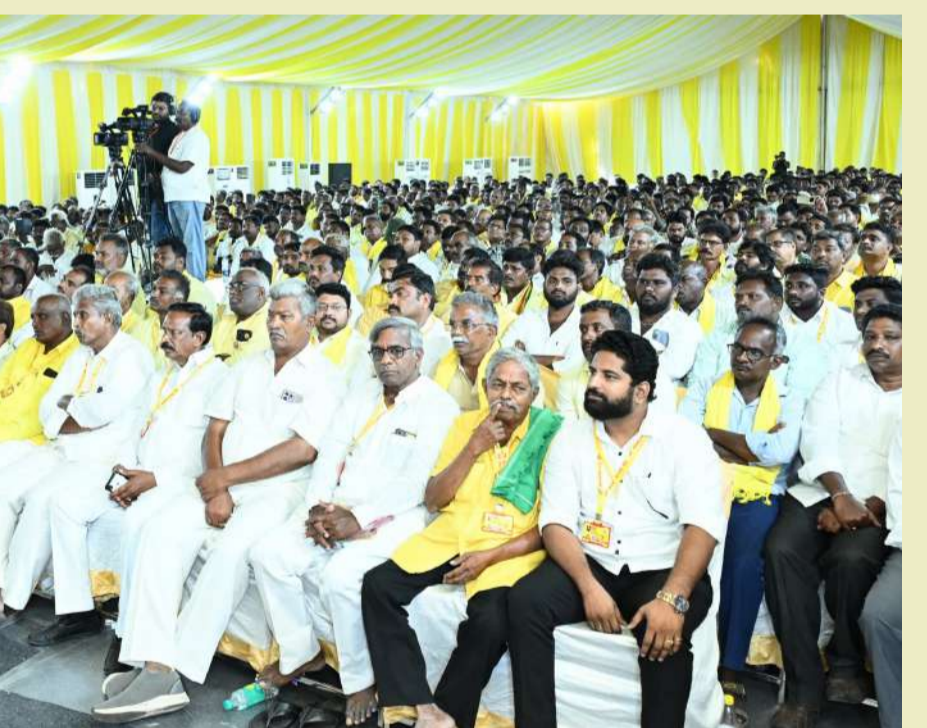
వేమూరు నియోజకవర్గ టీడీపీ నేతలు, కార్యకర్తలతో ముఖ్యమంత్రి చంద్రబాబునాయుడు సమావేశం