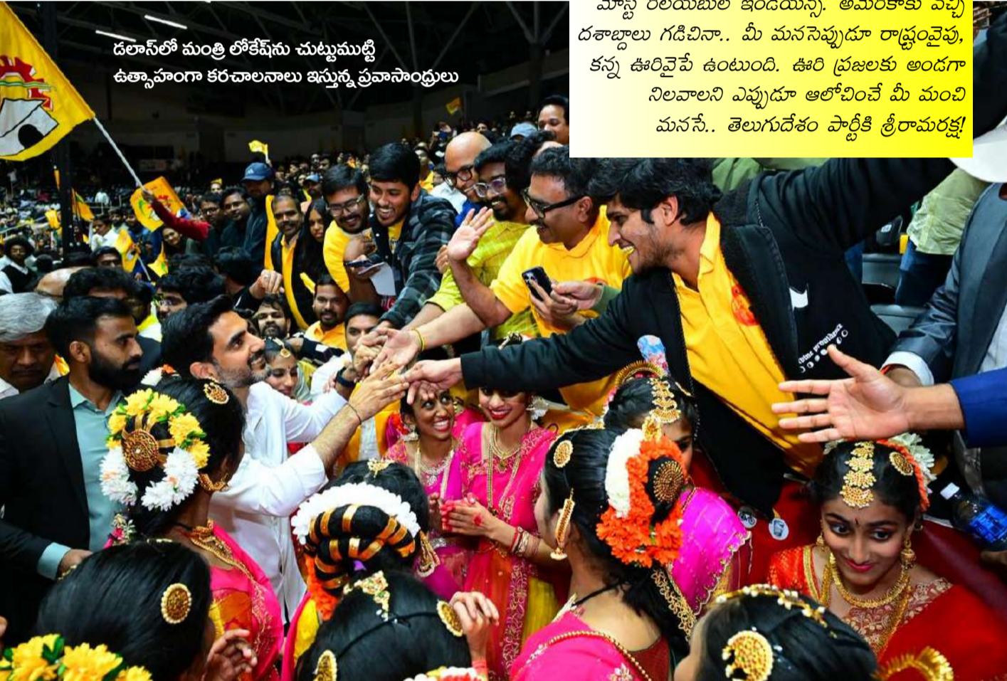
డలాస్ లో మంత్రి లోకేష్ ను చుట్టుముట్టి ఉత్సాహంగా కరచాలనాలు ఇస్తున్న ప్రవాసాంధ్రులు

ప్రతిపక్షంలో ఉన్నప్పుడూ అండగా నిలిచిన ప్రవాసాంధ్రులను గుండెల్లో పెట్టుకుని చూసుకుంటా. మా కుటుంబానికి మీరు కొండంత అండ. డలాస్ లో అడుగుపెట్టినప్పుడు.. అమెరికాలో ఉన్నానా? ఆంధ్రలో ఉన్నానా? అనే అనుమానమొచ్చింది. మీ ఉత్సాహం, జోష్ చూస్తుంటే యువగళం పాదయాత్ర రోజులు గుర్తుకొస్తున్నాయి. ఈ మీటింగ్ చూసిన తర్వాత టీమ్ 11కి నిద్ర వట్టదు. అందరూ మిమ్మల్ని ఎన్ ఆర్ ఐలు అంటారు. కానీ మీరు ఎన్ ఆర్ ఐలు. మోస్ట్ రిలయబుల్ ఇండియన్స్. అమెరికాకు వచ్చి దశాబ్దాలు గడిచినా.. మీ మనసెప్పుడూ రాష్ట్రంవైపు, కన్న ఊరివైపు ఉంటుంది. ఊరి ప్రజలకు అండగా నిలవాలని ఎప్పుడూ ఆలోచించే మీ మంచి మనసే.. తెలుగుదేశం పార్టీకి శ్రీరామరక్ష!