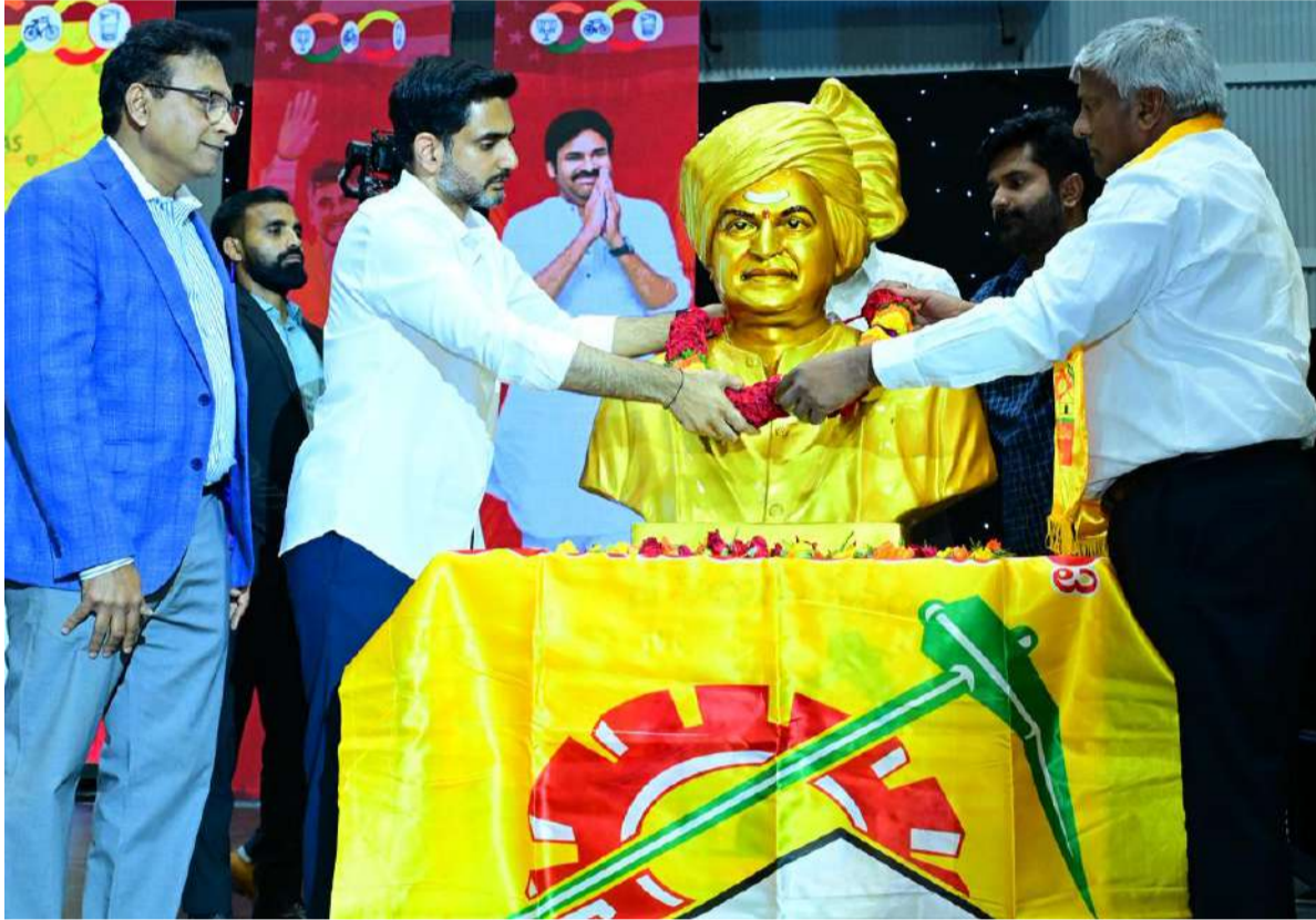
ప్రవాసాంధ్రులను గుండెల్లో పెట్టుకుంటా

“అమెరికాలో ఉన్నానా? ఆంధ్రలో ఉన్నానా? అనే అనుమానం వచ్చింది, మీ ఉత్సాహం, జోష్ చూస్తుంటే. నా యువగళం పాదయాత్ర రోజులు గుర్తుకువస్తున్నాయి. ఆనాటి పాలకులు నన్ను అడుగడుగునా ఆద్యకున్నారు. నడవనివ్వలేదు. మైక్ లాక్కున్నారు. స్టూల్ లాక్కున్నారు. అయినా మనవాళ్లు తొడగొట్టి, తగ్గేదేలేదు అని ఆనాడు ఎలాగైతే చెప్పారో.. అదేవిధంగా ఈరోజు నాకు అంత ఘనస్వాగతం పలికారు. ఇక్కడ చాలామంది నాకు ప్రతిపక్షం రోజులనుంచీ పరిచయం ఉన్నవారున్నారు. వారిని చూసినప్పుడు ఆ రోజులు గుర్తుకువస్తున్నాయి. మిమ్మల్ని గుండెల్లో పెట్టుకుని కాపాడే బాధ్యత లోకేష్ తీసుకుంటాడు. చంద్రబాబుని 53 రోజులుపాటు అక్రమంగా నిర్బంధించినప్పుడు అమెరికాలోని ప్రవాసాంధ్రులు పెద్దఎత్తున బయటకు వచ్చి మాకు అండగా నిలిచారు. డల్లాస్ లో ఏకంగా మూడు కార్యక్రమాలు నిర్వహించారు. మా కుటుంబానికి మీరు కొండంత బలమిచ్చారు. ఈ రాజకీయాలు మనకు అవసరమా? అని ఆనాడు బ్రాహ్మణి అడిగారు. అమెరికాలో, హైదరాబాద్ లోని స్టేడియంలో నిర్వహించిన గ్రాటిట్యూడ్ కార్యక్రమానికి సుమారు 45వేలమంది వచ్చి మాకు అండగా నిలబడ్డారు. ధైర్యమిచ్చారు. ఈ వేదికపై నిల్చిని మాట్లాడుతున్నానంటే మీరు అండగా నిలవడం వల్లే” అని లోకేష్ ఉద్ఘాటించారు.