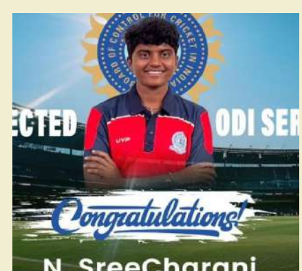
శుభాకాంక్షలు' అంటూ చంద్రబాబు నాయుడు పేర్కొన్నారు.