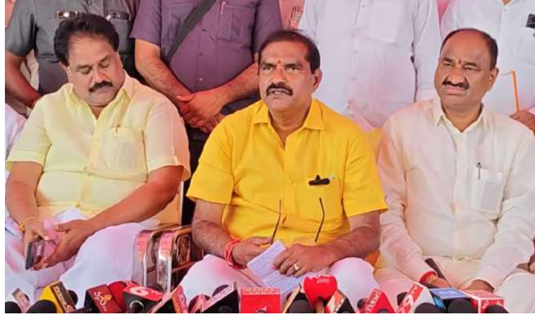
మంత్రి నిమ్మల విమర్శించారు.