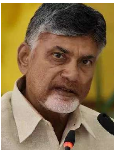
అమరావతి (చైతన్య రథం): సింగపూర్ స్కూల్లో సంభవించిన అగ్నిప్రమాద ఘటన సమాచారంతో