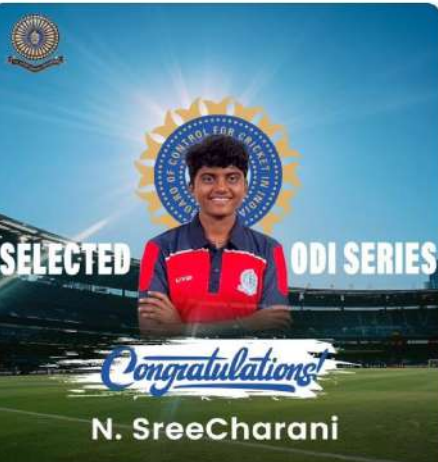
from Andhra Cricket Association on making it to India's squad for