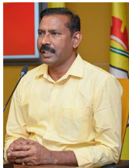
మొదటి సారి కాదు. ఇంతకు ముందు కూడా పలు సందర్భాల్లో ఇదే విధంగా సంస్కారం లేకుండా మాట్లాడారు.