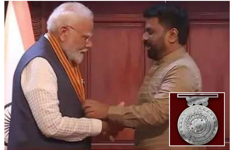
కీలక రక్షణ ఒప్పందం

ముందురోజుల పర్యటనలో భాగంగా ప్రధాని మోదీ శ్రీలంకలో పర్యటిస్తున్న సంగతి తెలిసిందే. ధాయిలాండ్ లో బిమ్ స్టేక్ సదస్సు ముగిసిన అనంతరం శుక్రవారం సాయంత్రం ప్రధాని మోదీ నేరుగా అక్కడకు చేరకన్నారు. కొలంబోలోని బందారునాయకే ఇంటర్నేషనల్ ఎయిర్పోర్టులో దిగిన ప్రధానికి శ్రీలంక ప్రభుత్వం ఘనంగా స్వాగతం పలికింది. శనివారం ఉదయం ఇండిపెండెన్స్ స్ట్రీట్ వద్ద ప్రధానికి ఆ దేశ అధ్యక్షుడు సంప్రదాయ వద్దతుల్లో ఆహ్వానం పలికారు. ఇరుదేశాల మధ్య ఉన్న చరిత్రాత్మక సంబంధాలకు ప్రతీకగా ఈ స్వాగతం నిలిచింది.