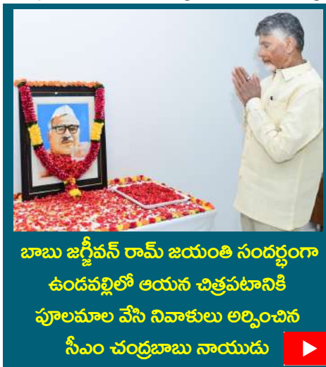
బాబు జగ్జీవన్ రామ్ జయంతి సందర్భంగా ఉండవల్లిలో ఆయన చిత్రవటానికి పూలమాల వేసి నివాళులు అర్పించిన సీఎం చంద్రబాబు నాయుడు