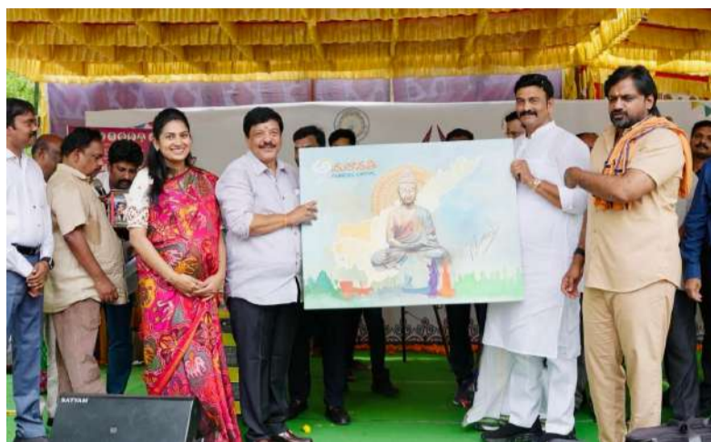
వీధి ప్రజలకు ఒక కొత్త అనుభూతిని కలిగిస్తోంది. కళా శైలిని ప్రపంచానికి చాటి చెప్పే ప్రయత్నంగా ఈ వేడుక మారింది.