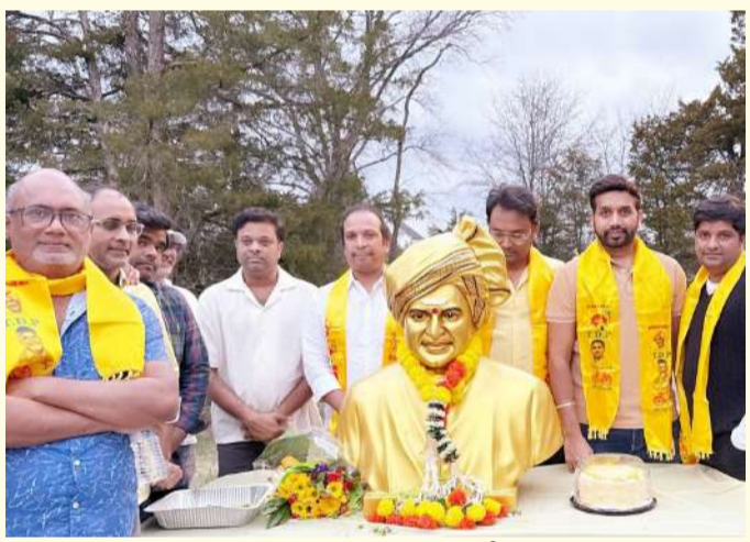
తెలుగు వారి ఆరాధ్య నటుడు ఎన్టీఆర్ స్థాపించిన తెలుగుదేశం పార్టీ, 43 ఏళ్లుగా జయాపజయాల కతీతంగా.. రాష్ట్ర ప్రగతికి కట్టుబడి పాలన సాగిస్తూ.. ముఖ్యంగా పేద, బడుగు, బలహీన, ముస్లిం, మైనారిటీ వర్గాలకు అందించిన