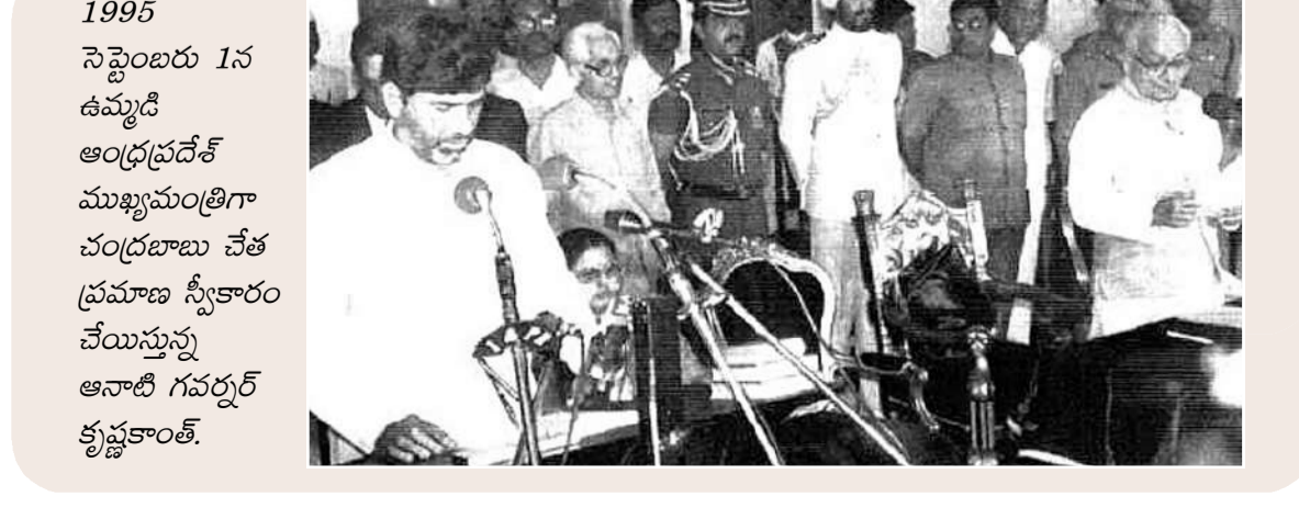
1995 సెప్టెంబరు 1న ఉమ్మడి ఆంధ్రప్రదేశ్ ముఖ్యమంత్రిగా చంద్రబాబు చేత ప్రమాణ స్వీకారం చేయిస్తున్న ఆనాటి గవర్నర్ కృష్ణకాంత్.