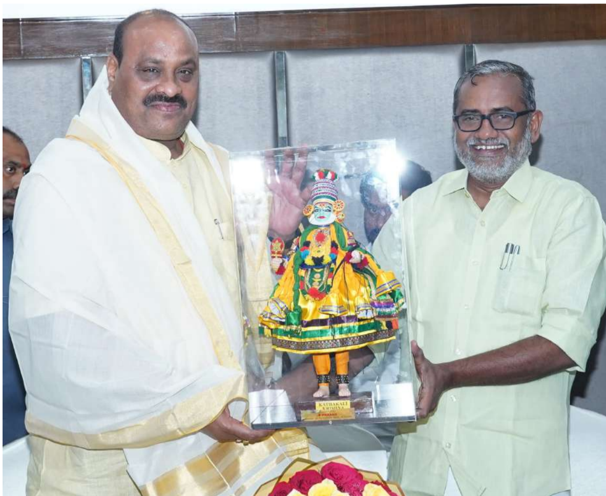
ఏపీ ముఖ్యమంత్రి దూరదృష్టికి అనుగుణంగా వ్యవసాయ విధానాలను అమలుచేయాలని ఆయన