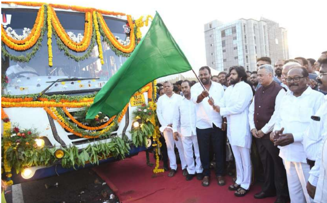
505 కిలోమీటర్లు... 680 రూపాయలు