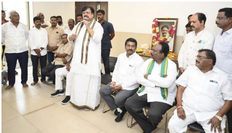
చిరంజీవిగా మనందరి మధ్యలోనే ఉన్నారని కొనియాడారు.