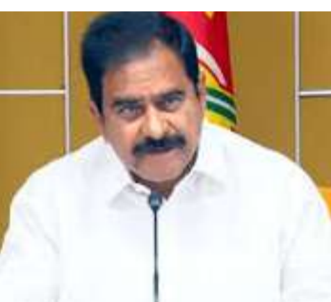
దేవినేని ఉమామహేశ్వరరావు పేర్కొన్నారు. గొల్లపూడిలోని

గొల్లపూడి (చైతన్యరథం): బెయిల్ పై ఉన్న ముద్దాయిలు చట్టాలను కాపాడే వ్యవస్థలను బెదిరించేలా బరితెగిస్తూ మాట్లాడడం దారుణమని మాజీ మంత్రి