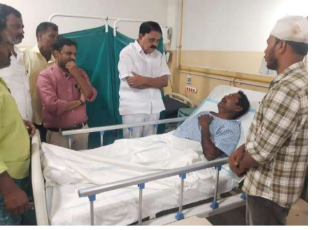
పుట్లపర్తి (చైతన్యరథం): అనంతపురం సవేరా ఆసుపత్రిలో చికిత్స పొందుతున్న పుట్లపర్తి నియోజకవర్గ