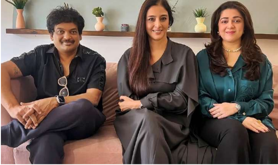
టాలీవుడ్లో ఎంతో పేరు సొంతం చేసుకున్నారు నటి టబు. ప్రస్తుతం ఆమె బాలీవుడ్ లో పరుగు సినిమాలు చేస్తున్నారు. 'అల.. వైకుంఠపురములో' తర్వాత తెలుగు దర్శకుడితో ఆమె వర్క్ చేస్తున్న చిత్రమిది కావడం విశేషం.