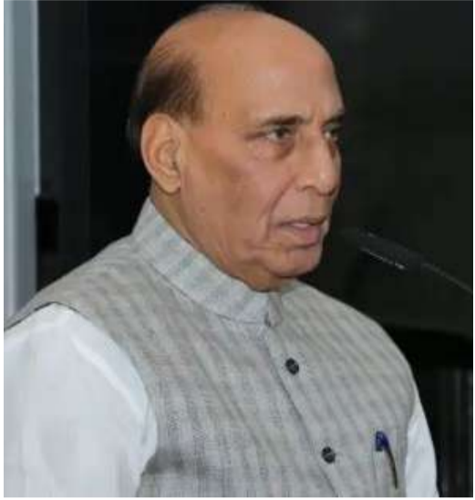
చెన్నై: రాజకీయ, సైనిక లక్ష్యాలను సాధించుకునేందుకు కొందరు సైబర్ దాడులను సాధనాలుగా వినియోగిస్తున్నారని కేంద్ర

రక్షణశాఖ మంత్రి రాజ్ నాథ్ సింగ్ అన్నారు. తప్పుడు సమాచారాన్ని వ్యాప్తి చేయడం కూడా ఇందులో ఓ భాగమని వ్యాఖ్యానించారు. తమిళనాడులోని డిఫెన్స్ సర్వీస్ స్టాఫ్ కాలేజీలో గురువారం కార్యక్రమంలో పాల్గొన్న ఆయన ఈ వ్యాఖ్యలు చేశారు. ప్రస్తుతం కొనసాగుతున్న సంఘర్షణలు, పరిస్థితులు సంప్రదాయ యుద్ధాలకు భిన్నంగా మారుతున్నాయని రాజ్ నాథ్ సింగ్ అన్నారు. నానాటికీ అభివృద్ధి చెందుతున్న సాంకేతికత మానవ ప్రమేయం లేని వ్యవస్థను సృష్టిస్తోంది. చాలా విషయాలను ఏటా అంచనా వేయడం చూస్తున్నాం. ఇప్పుడు సంప్రదాయ యుద్ధాలు (భూమి, జల, వాయు మార్గాల్లో చేసే యుద్ధం) చేసుకునే కాలం పోయింది. ఏటా రాకతో సాంకేతిక యుద్ధం జరుగుతోందన్నారు. ప్రస్తుతం మనమంతా 'గ్రే జోన్', హైబ్రిడ్ యుద్ధ శకంలో