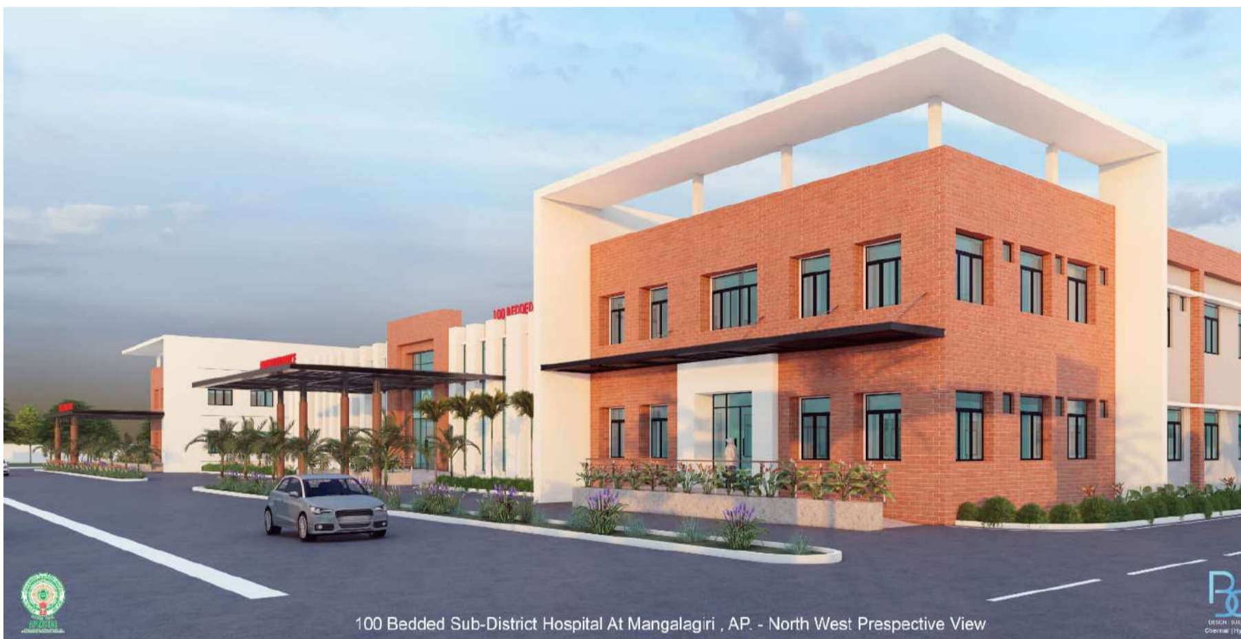
100 Bedded Sub-District Hospital At Mangalagiri . AP - North West Perspective View

మంగళగిరి (చైతన్యరథం): మంగళగిరి ప్రజల 30 ఏళ్ల కల వంద పడకల ఆసుపత్రి నిర్మాణం. తనసు 91వేల భారీ మెజార్లీతో గెలిపించి శాసన సభకు పంపడంతో మంగళగిరి ప్రజల మూడు దశాబ్దాల కలను నెరవేర్చేందుకు విద్య, ఐటీ శాఖల మంత్రి నారా లోకేష్ సిద్ధమయ్యారు. అత్యాధునిక వనతులతో దేశానికే రోల్ మోడల్ గా నిలిచేలా ఇప్పటికే ఆసుపత్రి నిర్మాణానికి ప్రణాళికలు రూపొందించారు. మంగళగిరి సమీపంలోని చినకాకాని వద్ద నిర్మించనున్న వంద పడకల ఆసుపత్రి భవన నిర్మాణానికి ఈ నెల 13వ తేదీన ఆదివారం విద్య, ఐటీ శాఖల మంత్రి నారా లోకేష్ శంకుస్థాపన చేయనున్నారు.