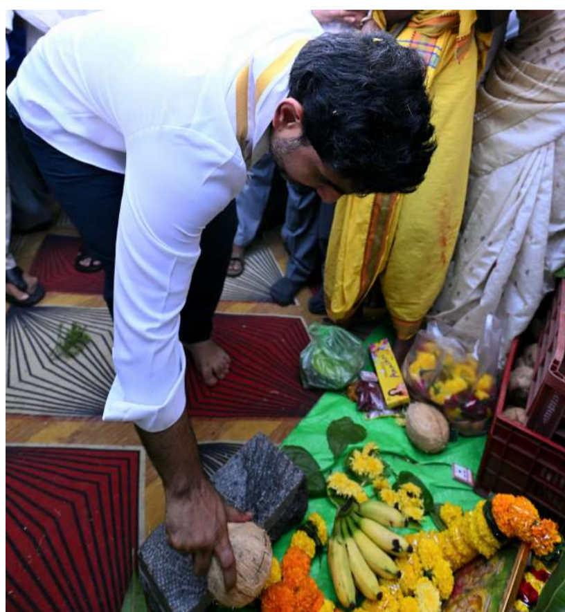
ప్రాజెక్టులో భాగంగా ప్రధానంగా అచ్యుతాపురం జంక్షన్ వద్ద ఫైవర్ తోపాటు రెండు మైన్ర్ బ్రిడ్జిలు, మత్స్యకార గ్రామాలకు ప్రధాన కనెక్టివిటీని అందిస్తుంది. ఇది అచ్యుతాపురం, రాంబిల్లి

అనకాపల్లి(చైతన్యరథం): అనకాపల్లి నుంచి అచ్యుతాపురం వరకు సుమారు 14కి.మీ.ల పొడవైన రోడ్డు విస్తరణ పనులకు రాష్ట్ర విద్య, ఐటీ, ఎలక్ట్రానిక్స్ శాఖల మంత్రి నారా లోకేశ్ సోమవారం శంకుస్థాపన చేశారు. యువగళం పాదయాత్ర సమయంలో ఈ ప్రాంత ప్రజలు రహదారి విస్తరణ చేపట్టాలని యువనేత లోకేశ్ కు విన్నవించారు. ఆనాడు లోకేశ్ ఇచ్చిన హామీ మేరకు ప్రస్తుతం డబుల్ రోడ్డుగా ఉన్న ఈ రహదారిని రూ.347 కోట్ల ఆసియా డెవలప్ మెంట్ బ్యాంక్ (ఏడీబీ) ఆర్థికసాయంతో 4లక్షల రహదారిగా విస్తరించనున్నారు. రెండేళ్ల కాలవ్యవధిలో చేపట్టే ఈ