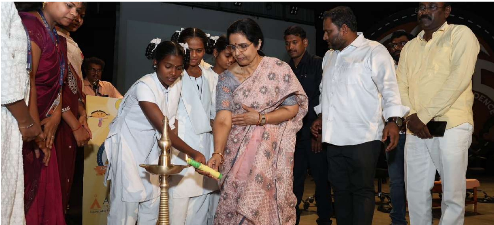
నాన్న కష్టాన్ని కళ్లారా చూశాను.. తల్లిదండ్రులే స్ఫూర్తి

ముఖ్యమంత్రి చంద్రబాబుకు ప్రజలే కుటుంబసభ్యులు. ఆయన నిత్యం ప్రజల గురించే ఆలోచిస్తారు. ఏపీని నెంబర్ వన్ స్టేట్ చేయాలని, పేదరికం