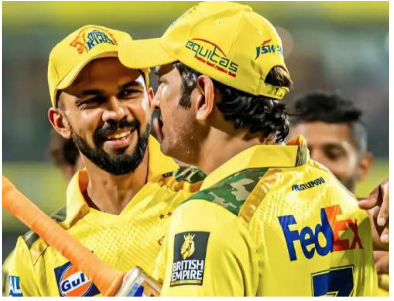
చూసేవాణ్ణి. కానీ మొదటిసారి డ్రెస్సింగ్ రూం నుంచి చూశా' అని రవిచంద్రన్ అశ్విన్ తన యూట్యూబ్ ఛానల్ లో వివరించాడు.

అభిమానులకు ధోనీ మీద ఉన్న క్రేజ్ గురించి టీన్ ఇండియా మాజీ స్పిన్నర్ రవిచంద్రన్ అశ్విన్ తన యూట్యూబ్ ఛానల్ లో వివరించారు. ఐపీఎల్ 2025లో భాగంగా ఆదివారం చెన్నై సూపర్ కింగ్స్, ముంబై ఇండియన్స్ మధ్య మ్యాచ్ జరిగింది. చెన్నై టీమ్ బ్యాటింగ్ చేస్తున్న సమయంలో 19వ ఓవర్ ముగిసిన తర్వాత రవిచంద్రన్ జడేజా రనౌట్ గా వెనుదిరిగాడు. అనంతరం మహేంద్ర సింగ్ ధోనీ మైదానంలో అడుగు పెట్టాడు. ఆ సమయంలో మైదానం అంతా మోత మోగింది. ధోనీ అభిమానులంతా ఈలలు, కేకలతో స్వాగతం పలికారు. అప్పుడు మైదానంలో షోరీ మీటర్ ప్రకారం 122 డెసిబెల్స్ శబ్దం సమాధాంది. దాదాపు 10 సంవత్సరాల తర్వాత అశ్విన్ తిరిగి చెన్నై సూపర్ కింగ్స్ జట్టులో భాగమయ్యాడు. అభిమానుల ఉత్సాహాన్ని అతడు డ్రెస్సింగ్ రూమ్ నుంచి వీక్షించాడు. “చెన్నైలో జరిగిన ఐపీఎల్ మ్యాచ్ లో ఎప్పుడైతే ధోనీ బ్యాటింగ్ చేయడానికి వచ్చాడో... అప్పుడు ఒక్కసారిగా మైదానంలో వాతావరణం మారిపోయింది. అంత వరకు దాదాపు నిశ్శబ్దంగా ఉన్న మైదానంలో ఒక్కసారిగా మోతమోగింది. అభిమానుల కేరింతలు, కేకలతో గ్రౌండ్ అంతా దద్దరిల్లింది. ఇది ఫ్యాన్స్ కు ధోనీ మీద ఉన్న ప్రేమకు తార్కాణం. నేను ఇంతకు ముందు ఈ సన్నివేశాలను బయట నుంచి