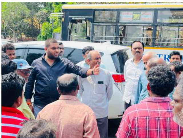
విశాఖపట్నం (చైతన్యరథం): వి.ఎం.ఆర్.డి.ఎకి చెందిన దుకాణాలు, వాణిజ్య సముదాయాల్లో తప్పనిసరిగా అగ్ని