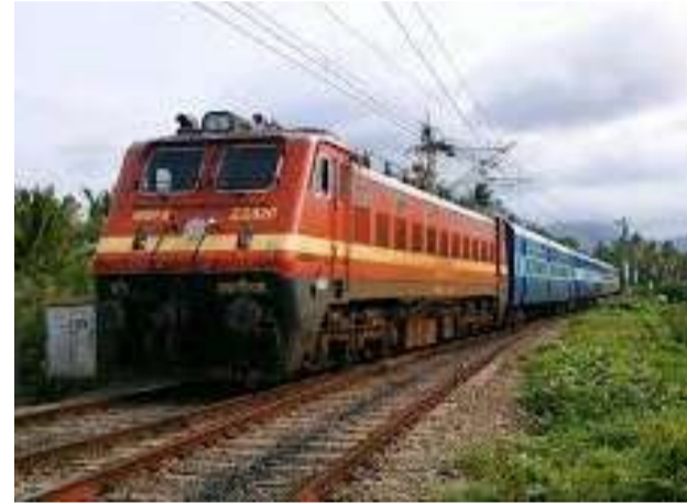
గురు, శనివారాల్లో అందుబాటులో ఉంటాయన్నారు.

పాసింజర్ రైళ్లను రద్దు చేసినట్లు వివరించారు. కాకినాడ-లింగంపల్లి మధ్య రెండు ప్రత్యేక రైళ్లు కాకినాడ-లింగంపల్లి మధ్య ఏప్రిల్ 2 నుంచి జులై 1 వరకు రెండు ప్రత్యేక రైళ్లను నడుపుతారు. కాకినాడ-లింగంపల్లి వరకు రైళ్లు సోమ, బుధ, శుక్రవారాల్లో నడుస్తాయి. లింగంపల్లి నుంచి కాకినాడ వచ్చే రైళ్లు ఏప్రిల్ 3 నుంచి జులై 1 వరకు మంగళ, గురు, శనివారాల్లో అందుబాటులో ఉంటాయన్నారు.