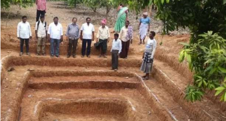
ఎంపీటీసీ, ఉపాధి సిబ్బంది పాల్గొన్నారు.