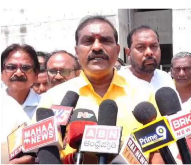
ఎమ్మెల్యేలు అసెంబ్లీకి హాజరు కాకుండా దొంగ చాటుగా సంతకాలు పెట్టి లక్షల్లో జీతభత్యాలు కాజేస్తున్నారని ఆరోపించారు.