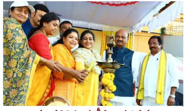
ప్రజాప్రతినిధులకు క్రీడలు ఆటవిడుపు అసెంబ్లీ స్పీకర్ అయ్యన్నపాత్రుడు వ్యాఖ్య ఎమ్మెల్యే, ఎమ్మెల్సీ సోషల్స్ తో కోలాహలంగా స్టేడియం