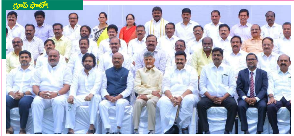
పవీ అసెంబ్లీ ఆవరణలో ఎమ్మెల్యేలు, ఎమ్మెల్సీలకు ఫాటో సెషన్ నిర్వహించారు. మొదటి వరుసలో సీఎం చంద్రబాబు, డిప్యూటీ సీఎం పవన్ కల్యాణ్, స్పీకర్ అయ్యన్నపాత్రుడు, డిప్యూటీ స్పీకర్ రఘురామకృష్ణరాజు, మంత్రులు పాల్గొన్నారు. సీనియారిటీ ప్రకారం ఎమ్మెల్యేలు 2, 3, 4 వరుసల్లో కూర్చున్నారు. అనంతరం ఎమ్మెల్సీల ఫాటో సెషన్ నడిచింది.

మంత్రి లోకేశ్ చేతులమీదుగా నేడు అశోక్ లేలాండ్ ప్లాంట్ ప్రారంభం - తొలివిడతలో 600మందికి, మలివిడతలో 1200 మందికి ఉద్యోగాలు