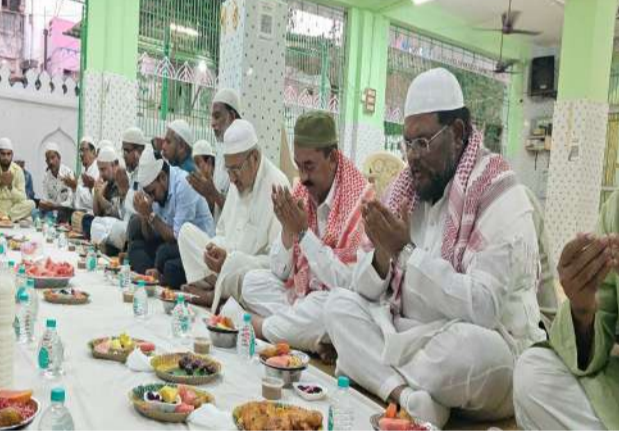
తదనుగుణంగా ప్రణాళిక ఏర్పాటు చేస్తున్నామని ఆయన తెలిపారు.