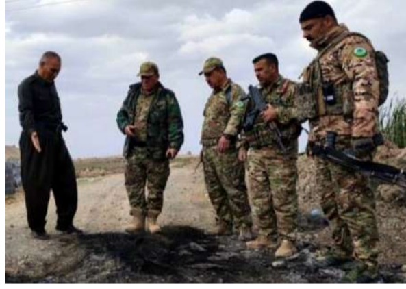
లకు సూసైడ్ బాంబులు అమర్చి ఉన్నాయని, మరీని ఆయుధాలు కూడా వెంటఉన్నట్లు భద్రతా దళాలు తెలిపాయి. గతంలో ఓ ఆపరేషన్నుంచి అబు ఖదీజా శ్రుతిలో తప్పించుకోగా.. అప్పట్లో అతడి డీఎన్ఎ నమూనాను సేకరించారు. దాని ఆధారంగా తాజాగా డీఎన్ఎ పరీక్షలు నిర్వహించి ఖదీజా మృతిని ధ్రువీకరించారు.

ఉగ్రవాద కట్టడిలో అమెరికాకు భారీ విజయం లభించింది. ఇస్లామిక్ స్టేట్ గ్లోబల్ ఆపరేషన్స్ చీఫ్ అబ్దుల్లా మక్తీ ముస్లిమ్ అల్ రిఫాయ్ అలియాస్ అబు ఖదీజాను అగ్రరాజ్యం మట్టుబెట్టింది. ఇరాకీ ఇంటెలిజెన్స్, భద్రతా దళాల సంయుక్త సహకారంతో ఇరాక్లో జరిపిన ఆపరేషన్లో అతడిని క్షిపణి ప్రయోగించి హతమార్చింది. ఇందుకు సంబంధించిన వీడియో దృశ్యాలను అమెరికా సెంట్రల్ కమాండో విడుదల చేసింది.మార్చి 13న జరిగిన ఈ సీక్రెట్ ఆపరేషన్ వివరాలు తాజాగా బయటికొచ్చాయి.అబు ఖదీజా కారులో వెళ్తుండగా అమెరికా దళాలు క్షిపణి ప్రయోగించింది. దీంతో ఘటనాస్థలంలోనే అతడు మరణించారు. అతడితోపాటు మరో ఐసిస్ ఉగ్రవాది కూడా చనిపోయినట్లు యూఎస్ సెంట్రల్ కమాండో వెల్లడించింది. దాడి అనంతరం మృతదేహాలను స్వాధీనం చేసుకున్నారు. వీరిద్దరి శరీరాలకు సూసైడ్ బాంబులు అమర్చి ఉన్నాయని, మరీని ఆయుధాలు కూడా వెంటఉన్నట్లు భద్రతా దళాలు తెలిపాయి. గతంలో ఓ ఆపరేషన్నుంచి అబు ఖదీజా శ్రుతిలో తప్పించుకోగా.. అప్పట్లో అతడి డీఎన్ఎ నమూనాను సేకరించారు. దాని ఆధారంగా తాజాగా డీఎన్ఎ పరీక్షలు నిర్వహించి ఖదీజా మృతిని ధ్రువీకరించారు.