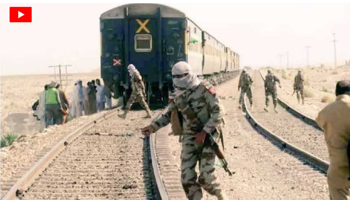
కాపాడుకునేందుకు బదులుగా మాతో పోరాడాలని ప్రయత్నించింది. ఫలితంగా బందీలను కోల్పోయింది. జాఫర్ ఎక్స్ప్రెస్ బోగోల్లోని బందీలను రక్షించేందుకు

ఫలితంగా శత్రు సైన్యానికి చెందిన 214 మందిని మేం హతమార్చాం. బీఎల్ఎం ఎప్పుడూ అంతర్జాతీయ చట్టాలకు అనుగుణంగానే వ్యవహరిస్తుంది. అయితే ఇస్లామాబాద్ సైన్యం తమ సిబ్బందిని