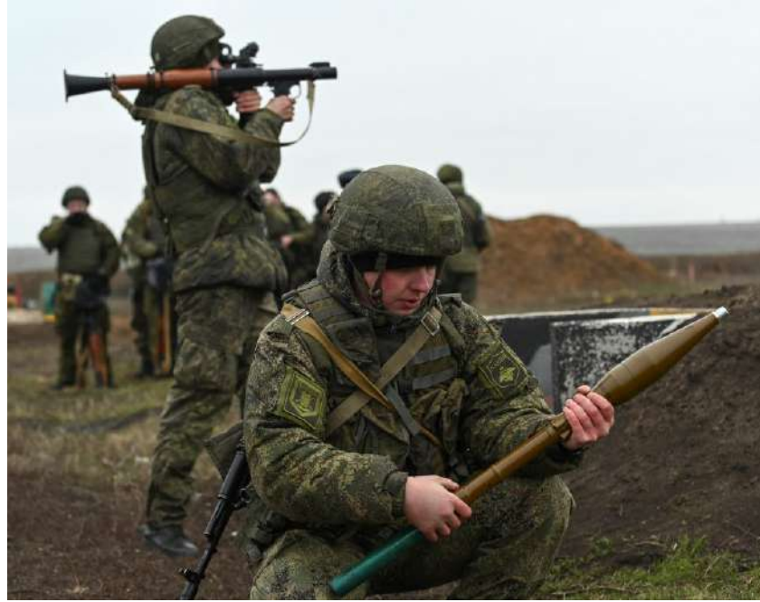
ఎన్నడూ లేనివిధంగా సోమవారం రాత్రి వందల డ్రోన్లతో విరుచుకుపడింది. 10 ప్రాంతాలను

ఒకవైపు శాంతి ప్రయత్నాలు జరుగుతుంటే వారం వ్యవధిలో రష్యాపై ఉక్రెయిన్ రెండోసారి డ్రోన్లతో దాడికి పాల్పడింది. అధ్యక్ష కార్యాలయం క్రిమిన్ సమీపంలో ఉన్న భవనాన్ని ఒక డ్రోన్ ఢీకొట్టింది. రష్యా అధికారులతో చర్చల కోసం అమెరికా రాయబారి స్టీవ్ విట్నాఫ్.. మాస్కోకు రహస్యంగా వెళ్లినట్లు వార్తలు వచ్చిన తరుణంలో ఈ దాడి చోటుచేసుకుంది. కాగా, ఆ డ్రోన్లను తమ వైమానిక దళం అడ్డుకుందని మాస్కో మేయర్ వెల్లడించారు. మూడేళ్లుగా కొనసాగుతున్న యుద్ధంలో ఇటీవల రష్యాపై ఉక్రెయిన్.. అతి పెద్ద దాడి చేసింది. గతంలో