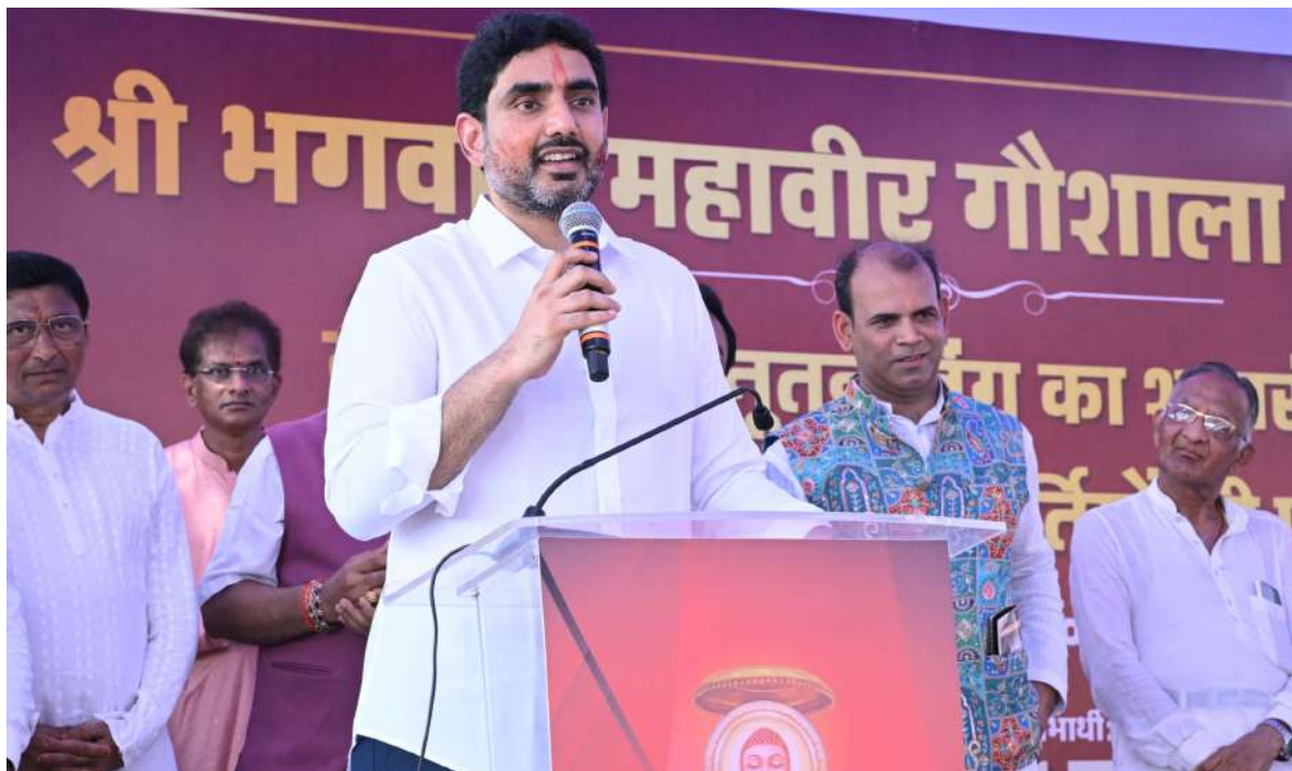
కేంద్ర మంత్రి పెమ్మసాని చంద్రశేఖర్ మాట్లాడుతూ.. ఎన్నికలకు ముందు దుగ్గిరాల కోల్డ్