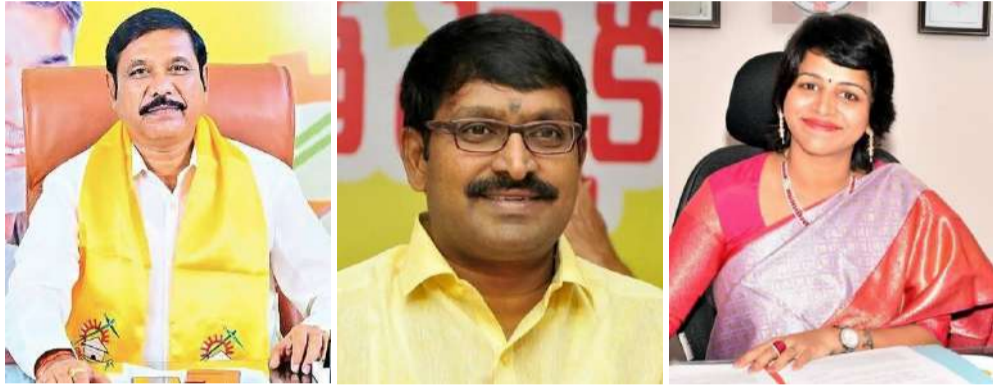
టీడీపీ ఎమ్మెల్యే అభ్యర్థులుగా