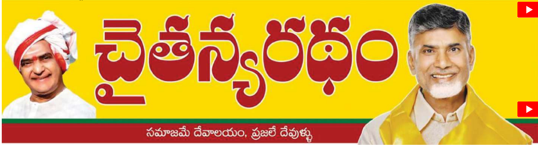
సమాజమే దేవాలయం, ప్రజలే దేవుళ్ళు