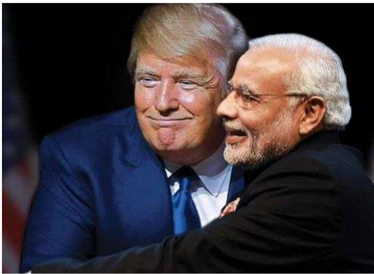
వ్యాఖ్యలు ప్రాధాన్యం సంతరించుకున్నాయి.

అమెరికాపై సుంకాల తగ్గింపునకు భారత్ అంగీకరించిందని యూఎస్ అధ్యక్షుడు డొనాల్డ్ ట్రంప్ పేర్కొన్నారు. భారత్ అత్యధికంగా సుంకాలు వసూలు చేస్తోందని.. ఆ దేశంలో ఏవీ విక్రయించడానికి వీలేనంత భారంగా అవి ఉన్నాయన్నారు. ఈ అంశాన్ని లేవనెత్తడం.. భారత్ చర్యలను తాము బహిరంగ పరచడం వల్ల సుంకాలను తగ్గించడానికి ఆ దేశం అంగీకరించిందని తెలిపారు. వైట్ హౌస్ లో జరిగిన సమావేశంలో అమెరికా అధ్యక్షుడు మరోసారి సుంకాల అంశాన్ని ప్రస్తావించారు. ఎలాన్ మస్క్ నేతృత్వంలోని టెస్లా త్వరలో భారత్ లో అడుగుపెట్టనుంది. ప్రస్తుతం భారత్ కార్ల దిగుమతిపై 110శాతం సుంకాలు విధిస్తోంది. ఈ విషయంపై ఎలాన్ మస్క్ ఇప్పటికే పలుమార్లు భారత్ పై బహిరంగానే విమర్శలు చేశాడు. ప్రపంచంలోనే కార్లపై అత్యధిక సుంకాలు విధించే దేశంగా అభివర్ణించారు. తన సంస్థను సుంకాలు లేకుండా భారత్ లో ప్రవేశపెట్టడానికి మస్క్ అనేక ప్రయత్నాలు చేసి విఫలమయ్యారు. ఈక్రమంలోనే అమెరికా నుంచి దిగుమతి అయ్యే కార్లపై సుంకాలను పూర్తిగా తొలగించేలా ఆ దేశంతో వాణిజ్య ఒప్పందంపై చర్చలు జరుగుతున్నాయి. అయితే భారత్ మాత్రం తక్షణమే సుంకాలను పూర్తిగా తొలగించే విషయంలో ఆవితాచి స్పందిస్తోంది. ఈ నేపథ్యంలో ట్రంప్