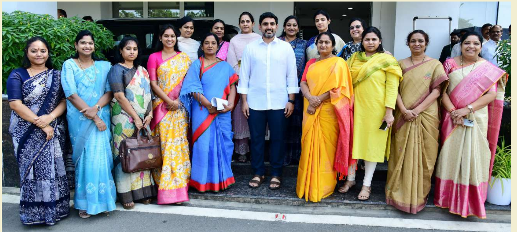
అంతర్జాతీయ మహిళా దినోత్సవం సందర్భంగా మంత్రి లోకేశ్ కలిసిన మహిళా మంత్రులు, ఎమ్మెల్యేలు

మహిళా సంక్షేమం, భద్రత కోసం కూటమి ప్రభుత్వం అహర్నిశలు కృషిచేస్తోంది. రాష్ట్రంలోని ప్రతి మహిళ సామాజిక, ఆర్థిక పురోగతి సాధించాలనే లక్ష్యంతో పనిచేస్తున్నాం. తమతమ రంగాల్లో మహిళలు మరిన్ని విజయాలను సాధిస్తూ, అందరికీ స్ఫూర్తిగా నిలవాలని మంత్రి లోకేశ్ ఆకాంక్షించారు.