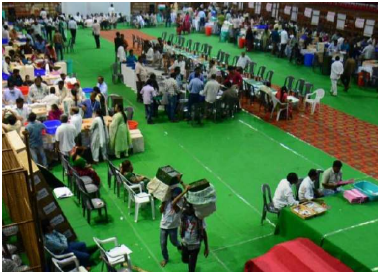
యూనివర్సిటీలోని ట్రిపుల్-ఈ బిల్డింగ్ లో జరగనుంది.