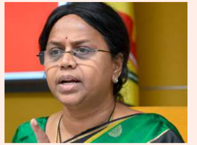
ఆర్థిక ఉగ్రవాది జగన్ రెడ్డిని అబద్ధాలు