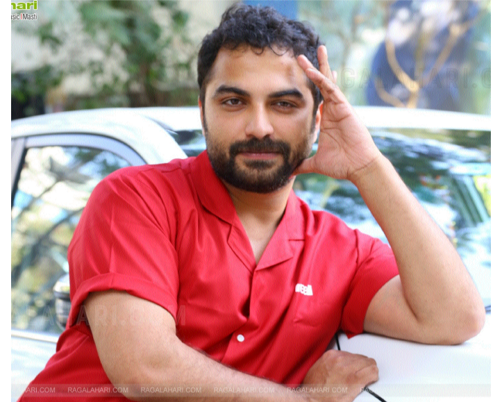
ఈవెంట్లకు పిలవడానికి 100 కారణాలుంటాయి. నిర్మాతతో అనుబంధం, హీరోతో స్నేహం ఇలా చాలా ఉంటాయి” అని ఆస్పరిచ్చారు.

‘మీ ఈవెంట్లకు సందమూరి హీరోలను తెస్తారు. సడెన్ గా బాస్ ను తీసుకొచ్చారు. ఆ కాంపాడ్ నుంచి ఇటు వచ్చారా?’ అని ఒక విలేకరి అడగగా, విశ్వక్ అదిరిపోయే రిపై ఇచ్చారు. “కాంపాండ్లు మీరు వేస్తుంటారు. మాకున్నది ఒకటే కాంపాండ్. ఇది మా ఇంటిది. ఇండస్ట్రీలో అవేమీ లేవు. అంతా ఒకటే. ఇక -బాస్ ఈజ్ బాస్. మమ్మల్ని అభిమానించే వాళ్ళు ఎలా ఉంటారో.. మేము అభిమానించే వాళ్ళు ఉంటారు. అనుబంధం ఉందని, ప్రతిసారి వాళ్లను పిలిచి ఇబ్బంది పెట్టలేం కదా. ఒక హీరోను