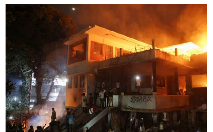
హసీనా తండ్రి ముజిబుర్ రెహమాన్ కు బంగ్లాదేశ్ లో పేరొందిన బంగ్లాదేశ్ విమక్తి పోరాటాన్ని భారత్ సాయంతో పూర్తిచేశారు. అనంతరం 1975లో ఆయన అధికార నివాసంలో ఉండగా సైన్యం దాడి చేసి ఆయనతో సహా ఇంట్లో వారిని చంపేసింది. రెహమాన్ తో సహా ఆ కుటుంబంలో మొత్తం 18 మంది ప్రాణాలు కోల్పోయారు. ఆ సమయంలో హసీనా, ఆమె సోదరి రెహనా జర్నీలో ఉండటంతో బతికిపోయారు. బంగ్లా చరిత్రలో ముజిబుర్ నివాసం ఒక ఐకానిక్ చిహ్నంగా గుర్తింపు పొందింది. అవామీ లీగ్ పాలనలో దీనిని మ్యూజియంగా మార్చారు.

ఆమె ప్రసంగంలో మహమ్మద్ యూనస్ నేతృత్వంలోని మధ్యతర ప్రభుత్వానికి వ్యతిరేకంగా నిరసనలు చేయాలని అవామీ లీగ్ పార్టీకి ఆమె పిలుపునిచ్చారు. ఈ నేపథ్యంలోనే ధాకాలో ఘటనలు చెలరేగినట్లు తెలుస్తోంది. ఇంటికి నిప్పు పెట్టడంపై సైతం ఆమె స్పందించారు. ‘వారు ఒక భవనాన్ని కూల్చివేయగలరు. కానీ, చరిత్రను కాదు. దీనిని వారు గుర్తించుకోవాలి’ అని పేర్కొన్నారు. ఈ ఇల్లు అధికారవాదం, ఫాసిజానికి చిహ్నమని నిరసనకారులు పేర్కొన్నారు. అంతేకాక.. 1972 నాటి రాజ్యాంగాన్ని రద్దు చేస్తామని ప్రతిజ్ఞ చేశారు.