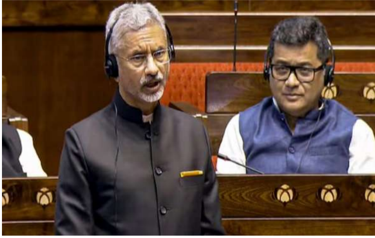
దేశస్థులు విదేశాల్లో చట్టవిరుద్ధంగా ఉంటే వారిని స్వదేశాలకు రప్పించడం ఆయా దేశాల బాధ్యత" అని జైశంకర్ వివరించారు.