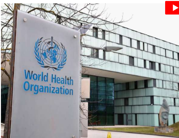
ప్రసంగిస్తూ ఈ మేరకు ప్రకటన చేశారు. అర్జెంటీనా ఏ అంతర్జాతీయ సంస్థను తన సార్వభౌమాధికారంలో జోక్యం చేసుకోవడానికి

ప్రపంచ ఆరోగ్య సంస్థ నుంచి వైదొలుగుతున్నట్లు అర్జెంటీనా తాజాగా ప్రకటించింది. కొవిడ్ మహమ్మారిని కట్టిడి చేయడంలో విఫలం, ఇతర కారణాల వల్ల ఈ నిర్ణయం తీసుకున్నట్లు అర్జెంటీనా అధ్యక్ష కార్యాలయం వెల్లడించింది. అధ్యక్ష ప్రతినిధి మాన్యుయేల్ అదోర్నీ ఓ సమావేశంలో