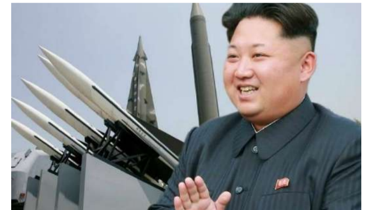
కూడా నిర్వహించలేక పోయింది. కానీ, రష్యా సౌజన్యంతో ఇప్పుడు క్షిపణుల కచ్చితత్వాన్ని గణనీయంగా మెరుగుపర్చుకొంది. వోల్గా రిజియన్ లో రష్యా రహస్య పరీక్షలు మాస్కో యారీ క్షిపణిని రాదార్ల నుంచి తప్పిస్తూ ప్రయోగించేలా సాధన చేస్తోంది. దీనికి వోల్గా రిజియన్ ను అది ఎంచుకొన్నట్లు అల్ అరేబియా పత్రిక పేర్కొంది. మంచుతో కప్పేసిన అడవుల్లో వీటిని నిర్వహిస్తోంది. ఈ క్షిపణిని ట్రక్ పైనుంచి లేదా బోరియల్లో నుంచి ప్రయోగించే అవకాశం ఉంది.