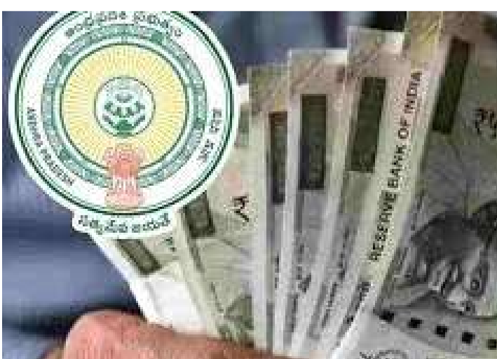
చేసుకోవాలనుకుంటున్నారో చిరునామా ఇవ్వాలి. నివాసం ఉంటున్న జిల్లా, మండలం, సచివాలయం పేరు నమోదు చేయాలి. ఈ విధానంతో పంపిణీ శాతం మరింత పెరిగే అవకాశం ఉన్నట్లు అధికారులు అభిప్రాయపడుతున్నారు.

సామాజిక పంచన్న బదిలీ సౌకర్యంతో లబ్ధిదారులకు మేలు కలగనుంది. సాధారణంగా ప్రతినెలా పంచను తీసుకునేందుకు దూరప్రాంతాల్లో ఉంటున్నవారు ఉరుకులు పరుగుల మీద తమ సొంతూళ్లకు వెళ్లి తీసుకుంటున్నారు. దీనికి రవాణా ఛార్జీల రూపంలో అధిక మొత్తంలో చేతిచమురు వదులుతోంది. ఇతర ప్రాంతాల్లో నివాసం ఉంటున్న వారు పంచను బదిలీ చేయించుకుంటే అక్కడే నగదు తీసుకునే వీలు కలగనుంది. రాష్ట్రంలో పంచన్న తీసుకునే సమయంలో ఇతర ప్రాంతాల నుంచి స్వగ్రామాలకు వచ్చేవారి సంఖ్య ప్రతి సచివాలయం పరిధిలో 5 నుంచి 10 మంది వరకు ఉంటున్నారు. 3 నెలలకోసారి తీసుకునే వెసులుబాటు కల్పించడంతో ఇతర ప్రాంతాల వారికి కొంత మేర ఉపశమనం కలిగింది. కాని ఇప్పుడు బదిలీ చేసుకునే అవకాశం కూడా కల్పించడంతో వారికి మరింత లబ్ధి కలగనుంది. ఎన్టీఆర్ భరోసా పంచను బదిలీ చేసుకోవాలనుకుంటే ముందుగా దగ్గర్లోని సచివాలయానికి వెళ్లి దరఖాస్తు చేసుకోవాలి. దీనికి సంబంధించి వెబ్సైట్లో ప్రభుత్వం ఆప్షన్ ఇచ్చింది. పెన్షన్ టీడీ, ఏ ప్రాంతానికి బదిలీ