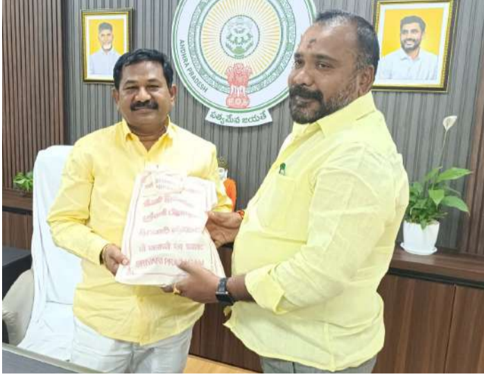
పూతలపట్టు, (చైతన్యరథం): రాష్ట్ర సాంఘిక సంక్షేమ శాఖ మంత్రి డౌలా బాల వీరాంజనేయ స్వామిని పూతలపట్టు

సాంఘిక సంక్షేమ శాఖ మంత్రిని కలిసిన పూతలపట్టు ఎమ్మెల్యే