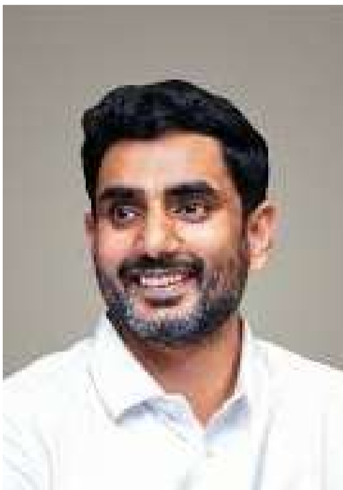
చంద్రబాబునాయుడు చేసిన ప్రయత్నాలు ఫలింఛాయన్నారు. కేంద్రప్రభుత్వ పెద్దలతో ముఖ్యమంత్రి నిరంతరం

అమరావతి (చైతన్యరథం): గత పాలకులు కేసుల మాఫీ కోసం రాష్ట్ర ప్రయోజనాలను తాకట్టు పెడితే.. చంద్రబాబు నాయుడు నేతృత్వంలోని ప్రగతిశీల ప్రభుత్వం నిరంతరం రాష్ట్ర ప్రజల ప్రయోజనాల కోసం పరితపిస్తోందని రాష్ట్ర విద్య, బడిశాఖల మంత్రి నారా లోకేష్ స్పష్టం చేశారు. రాష్ట్రంలో మిర్చి రైతులను ఆదుకునేందుకు ముఖ్యమంత్రి