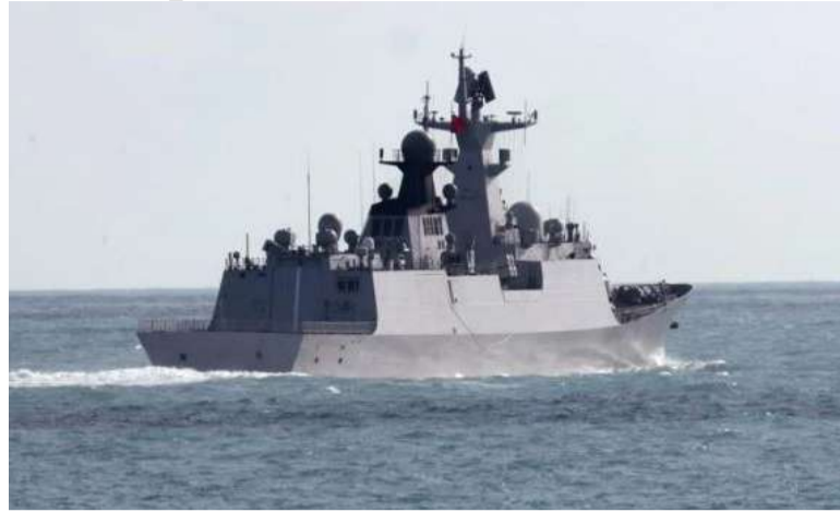
ఆకారణంగా ఆరోపణలు చేస్తోందని పేర్కొంది. చైనా ముందస్తు నోటీసులు ఇచ్చినట్లు వెల్లడించింది.

112 లాంచ్ సెల్స్, యాంటీపిమ్ బాలిస్టిక్ క్షిపణులు ఉన్నట్లు పేర్కొన్నారు. వీటి రేంజి సుమారు 540 నాటికల్ మైళ్లు ఉండొచ్చని వెల్లడించారు. ఈ విన్యాసాలపై చైనా ప్రభుత్వ మీడియా స్పందిస్తూ.. పశ్చిమ దేశాలు కూడా వాటి సముద్ర జలాల్లో ఇలాంటి విన్యాసాలకు అలవాటు పడాలని సలహా ఇచ్చింది. చైనా మిలటరీ వ్యూహాల నిపుణుడు షాంగ్ జోంగ్ పింగ్ గ్రోబల్ లైమ్లైట్ మాట్లాడుతూ పీపుల్స్ లిబరేషన్ ఆర్మీ నేవీ భవిష్యత్తులో చైనా తీరాల్లోనే కాకుండా.. అంతర్జాతీయ జలాల్లో కూడా ఇటువంటి విన్యాసాలు నిర్వహిస్తుందని వెల్లడించింది. ఆస్ట్రేలియా ప్రధాని ఆంథోనీ అల్బానీస్ స్పందిస్తూ చైనా యుద్ధవిన్యాసాలు అంతర్జాతీయ చట్టాలను పాటించినా.. తమకు ముందస్తు సమాచారం ఇచ్చి ఉండాలిందన్నారు. ఆ దేశ విదేశాంగ మంత్రి పోనీ వాంగ్ స్పందిస్తూ.. ఈ పరిణామాలపై చైనాను వివరణ కోరనున్నట్లు వెల్లడించారు. కానీ, బీజింగ్ మాత్రం వీటిని కొట్టిపారేసింది. ఆ దేశ విదేశాంగశాఖ స్పందిస్తూ.. ఆస్ట్రేలియా