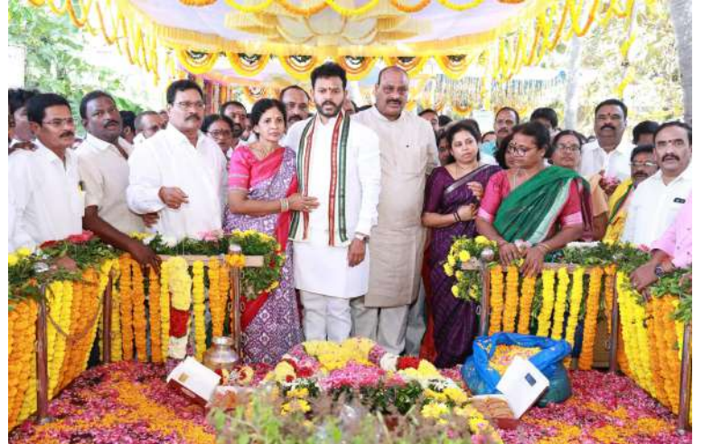
తరలివచ్చిన అభిమాన గణం

తొలినాళ్లలోనే గుర్తింపు పొందిన వైనం ఎన్నటికీ, ఎప్పటికీ చెరగని స్ఫూర్తికి నిదర్శనం అని కొనియాడారు. అన్నయ్య ఆశయంలో భాగంగానే తామంతా పనిచేస్తామని ఎర్రన్న సోదరులు పునరుద్ఘాటించారు. ఈ ప్రాంత అభివృద్ధికి, ముఖ్యంగా ఉద్ధానంకు తాగునీటి అందించే ప్రాజెక్టుకు ఆయన చేసిన కృషి చిరస్మరణీయం అన్నారు. అన్నయ్య స్నేహానికి విలువ ఇచ్చే గొప్ప వ్యక్తి అని అన్నారు. కోటబొమ్మాలి పరిసర ప్రాంతాలలో స్థానిక సమస్యల పరిష్కారానికి ఎంతో చొరవ చూపేవారన్నారు. విలువలు, విశ్వసనీయతకు చిరునామా.. ప్రజాసేవలో ఎందరికో ఆదర్శనీయులు.. ప్రజల పౌదర్యంలో చిరస్థాయిగా నిలిచి ఉండే నాయకుడని కొనియాడారు.