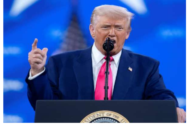
వ్యాఖ్యలు అర్థం లేని ఆరోపణలేనని కాంగ్రెస్ స్పష్టం చేసింది. యూఎస్ ఎయిడ్ ద్వారా దశాబ్దాలుగా భారత్ లోని ప్రభుత్వ ప్రభుత్వేతర సంస్థలకు అందిన సాయంపై కేంద్రం శ్రేష్ట పత్రాన్ని విడుదల చేయాలని డిమాండ్ చేసింది.

కాగా ఈ విషయంలో దేశంలో అధికార ప్రతిపక్షాల మధ్య మాటల యుద్ధం కొనసాగుతోంది. 2024 ఎన్నికల్లో విదేశీ శక్తులు పని చేస్తున్నాయని అప్పట్లో ప్రధాని మోదీ చేసిన ఆరోపణలు తాజాగా ట్రంప్ వ్యాఖ్యలతో నిజమని తేలిందని భాజపా పేర్కొంది. అమెరికా అధ్యక్షుడి