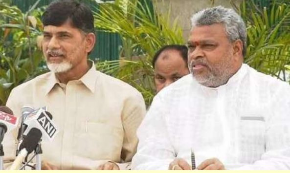
ఎర్రన్నాయుడితో ఉన్న ఫోటోను చంద్రబాబు షేర్ చేశారు.

అమరావతి (చైతన్యరథం): తెలుగుదేశం పార్టీ నేత, కేంద్ర మాజీమంత్రి కింజరాపు ఎర్రన్నాయుడు జయంతి సందర్భంగా ఆదివారం ముఖ్యమంత్రి చంద్రబాబు ఘనంగా నివాళు లర్పించారు. ప్రజా సేవలో తిరుగులేని నిబద్ధత, నిజాయితీ, ఆత్మీయత కలబోసిన నాయకుడు ఎర్రన్నాయుడు అని కొనియ దారు. మూడు దశాబ్దాలకు మించిన రాజకీయ జీవితంలో మచ్చ లేని చరిత్రను సొంతం చేసుకున్నారని గుర్తుచేశారు. తన ఆత్మీయ నేస్తం ఎర్రన్నాయుడు జయంతి సందర్భంగా ఆయన సేవలను స్మరించుకుందామని పిలుపునిచ్చారు. సోషల్ మీడియా వేదికగా