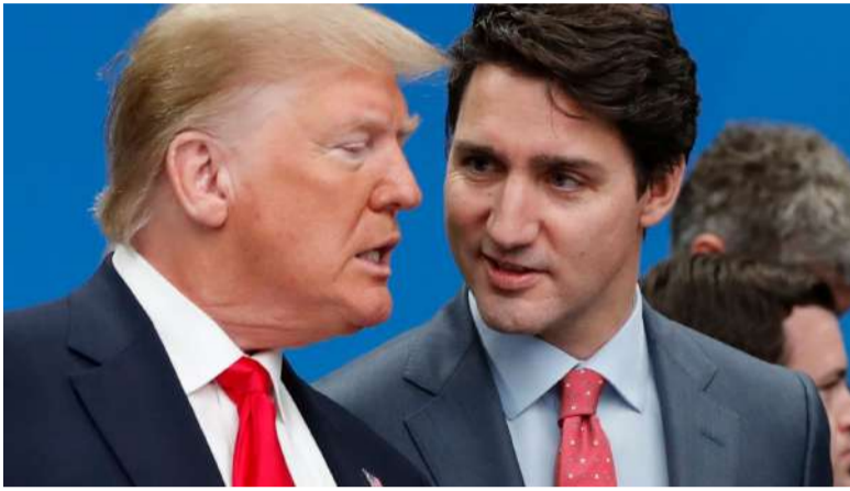
మ్యాచ్ అనంతరం తన ఎక్స్ ఖాతాలో ‘మీరు మా దేశాన్ని తీసుకోలేరు.. మా గేమ్ను తీసుకోలేరు’ అని కౌంటర్ ఇచ్చారు.

టీఫ్లెన్ వేదికగా 4 నేషన్స్ ఫేస్-ఆఫ్ ఐస్ హాకీ టోర్నమెంట్ జరిగింది. ఫైనల్ మ్యాచ్లో అమెరికా-కెనడా తలపడ్డాయి. ఈ మ్యాచ్కు ముందు ట్రంప్ దీనిపై స్పందిస్తూ.. “త్వరలోనే మన 51వ రాష్ట్రంగా మారే కెనడాపై గ్రేట్ అమెరికా హాకీ జట్టు విజయం సాధిస్తుందని విశ్వసిస్తున్నా” అని రాసుకొచ్చారు. అయితే, ఫైనల్ పోరులో కెనడా చేతిలో అగ్రరాజ్య జట్టు ఓటమి పాలైంది. దీంతో ట్రంప్ వ్యాఖ్యలకు ట్రూడో దీటుగా బదులిచ్చారు.