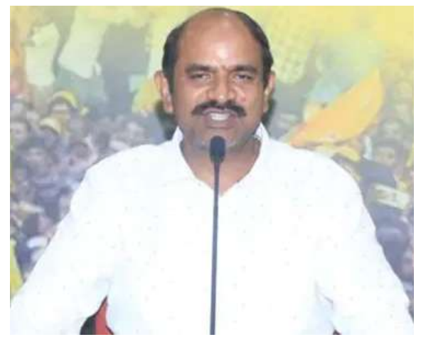
ఎంతో గర్వకారణమన్నారు. ఎన్నో కుటమి పార్టీలు ఉమ్మడిగా తీసుకునే నిర్ణయాల్ని ప్రతిఒక్కరూ గౌరవించి, మన నాయకుడు చంద్రన్న గౌరవాన్ని మరింత పెంచాలని ఈ సందర్భంగా ఎంపీ అప్పలనాయుడు కోరారు.

ఎంపీలతో ప్రత్యేక సమావేశాలు నిర్వహించి ఎంపీలకు మార్గనిర్దేశం చేసేవారని తెలిపారు. ఇటీవల ఢిల్లీలో పర్యటించిన లోకేశ్.. విద్యావ్యవస్థలో చేపట్టాల్సిన సంస్కరణలు, అమలు చేయాల్సిన కార్యచరణ గురించి కేంద్ర మావనవనరులశాఖ మంత్రి ధర్మేంద్ర ప్రధాన్ తో ప్రత్యేకంగా చర్చించారని తెలిపారు. ఏపీలో అమలౌతున్న ప్రభుత్వ విద్యా విధానం, వినూత్నంగా నిర్వహిస్తున్న పేరంట్స్ - టీచర్స్ మీటింగ్ వంటి కార్యక్రమాలు కేంద్రమంత్రుల్ని సైతం ఆకర్షించాయని, వాటిని దేశం మొత్తం అమలు చేసేలా చర్యలు ప్రారంభించడం ఎంతో సంతోషాన్ని ఇచ్చిందన్నారు. కేంద్ర ప్రభుత్వం సైతం అన్నివిధాలా రాష్ట్రాభివృద్ధికి సహకరిస్తోందని, ఢిల్లీ ఎన్నికల ఫలితాల అనంతరం ముఖ్యమంత్రి చంద్రబాబు దార్శనికత గురించి ఎన్నో కుటమి సమావేశంలో దేశ ప్రధాని సరేంద్రమోదీ ప్రశంసించారని గుర్తుచేస్తూ ఇది తెలుగువారందరికి