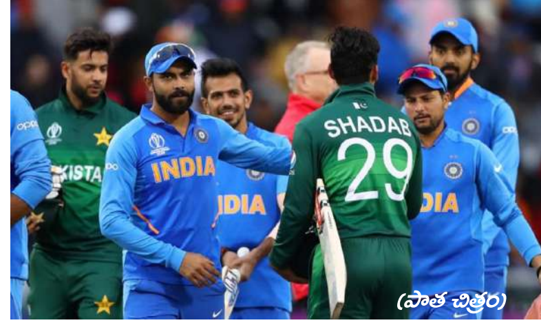
భారత్ మ్యాచ్లు దుబాయ్కు షిఫ్ట్ అవ్వడం వల్ల వాళ్లు నిరాశ చెందినట్లు తెలుస్తోంది.

ప్లేయర్లవారిని కూడా హాగ్ చేసుకోవద్దని చెప్పారు. ఈ మేరకు పాక్ జర్నలిస్ట్ ఒకరు సోషల్ మీడియాలో ఓ వీడియో పోస్టు చేశారు. ప్రస్తుతం ఇది వైరల్గా మారింది. ఈ ఎడిషన్కు పాకిస్తాన్ ఆతిథ్యం ఇస్తోంది. దీంతో చాలా ఏళ్ల తర్వాత పాక్ గడ్డపై టీమిండియా మ్యాచ్ ఆడుతుందని అక్కడి ఫ్యాన్స్ ఆశించారు. కానీ, భద్రతా కారణాల వల్ల భారత్ జట్టును పాకిస్తాన్కు పంపేది లేదని బీసీసీఐ తేల్చి చెప్పింది. దీంతో భారత్ మ్యాచ్లను దుబాయ్ వేదికగా జరగనున్నాయి. అయితే పాకిస్తాన్ గడ్డపై భారత్తో మ్యాచ్ జరిగితే చూడాలని ఎన్నో ఏళ్లుగా ఎదురుచూస్తున్నట్లు అక్కడి ఫ్యాన్స్ చెబుతున్నారు. రోహిత్ శర్మ, విరాట్ కోహ్లా లాంటి పెద్ద స్టార్లను చూడవచ్చని ఆశించారట. అయితే