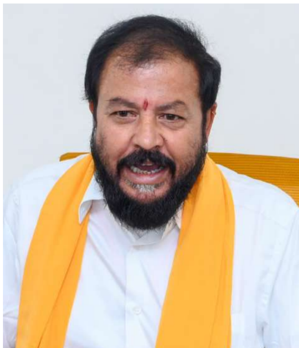
చింతమనేని నిప్పులు చెరిగారు.

నాపై ఏ తప్పు లేకుండా ఎస్సీ, ఎస్టీ కేసులు, హత్యాయత్నం కేసులు నమోదు చేశారు. 67 రోజులు జైల్లో పెట్టారు. అన్యాయంగా చంద్రబాబుని స్కిల్ డెవలప్మెంట్ కేసులో 53 రోజులు జైల్లో పెట్టారు.