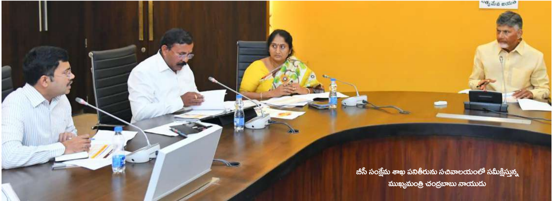
బీసీ సంక్షేమ శాఖ పనితీరును సచివాలయంలో సమీక్షిస్తున్న ముఖ్యమంత్రి చంద్రబాబు నాయుడు

పెట్టిన రూ.2.02 కోట్ల బకాయిలు, ఈ ఏడాది ఫిబ్రవరి వరకు చెల్లించాల్సివున్న రూ.2.33 కోట్ల బకాయిలు మొత్తం కలిపి రూ.4.35 కోట్లు చెల్లించాల్సి ఉందని అధికారులు సీఎం దృష్టికి తీసుకురాగా, వెంటనే చెల్లించేందుకు అనుమతి ఇచ్చారు.