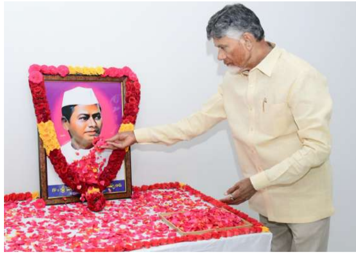
మాజీ ముఖ్యమంత్రి దామోదరం సంజీవయ్య జయంతి సందర్భంగా ఉండవల్లి నివాసంలో ఆయన చిత్రపటానికి పూలమాల వేసి నివాళులర్పించిన ముఖ్యమంత్రి చంద్రబాబు నాయుడు.

మొత్తం 200 పాయింట్లకుగాను 129 పాయింట్లతో ఎన్టీఆర్ జిల్లా మొదటి స్థానంలో నిలిచింది. 127 పాయింట్లతో విశాఖ రెండో స్థానంలో, 125తో కడప గోదావరి 3వ స్థానం, 122తో అనంతపురం జిల్లా 4వ స్థానం, 120 పాయింట్లతో అన్నమయ్య 5వ స్థానం, శ్రీకాకుళం 6వ స్థానంలో ఉన్నాయి. 118 పాయింట్లతో కడప 7వ స్థానం, 117 పాయింట్లతో గుంటూరు 8వ స్థానం, 115 పాయింట్లతో బాపట్ల 9వ స్థానం, 115 పాయింట్లతో నెల్లూరు 10వ స్థానం, 115 పాయింట్లతో వెస్ట్ గోదావరి 11వ స్థానం, 113 పాయింట్లతో అనకాపల్లి 12వ స్థానం, 111 పాయింట్లతో తిరుపతి 13వ స్థానం, 109 పాయింట్లతో కాకినాడ 14వ స్థానంలో ఉన్నాయి. 108 పాయింట్లతో ఏలూరు 15వ స్థానం, 108 పాయింట్లతో కృష్ణ 16వ స్థానం, 105 పాయింట్లతో కోనసీమ 17వ స్థానం, 105 పాయింట్లతో మన్యం పాడేరు 18వ స్థానం, 105 పాయింట్లతో సత్యసాయి 19వ స్థానం, 103 పాయింట్లతో పల్నాడు 20వ స్థానం, 99 పాయింట్లతో కర్నూలు 21వ స్థానం, 99 పాయింట్లతో ప్రకాశం 22వ స్థానం, 94 పాయింట్లతో నంద్యాల 23వ స్థానం, 93 పాయింట్లతో విజయనగరం 24వ స్థానం, 88 పాయింట్లతో చిత్తూరు 25వ స్థానం, 81 పాయింట్లతో అల్లూరి సీతారామరాజు 26వ స్థానంలో నిలిచాయి.