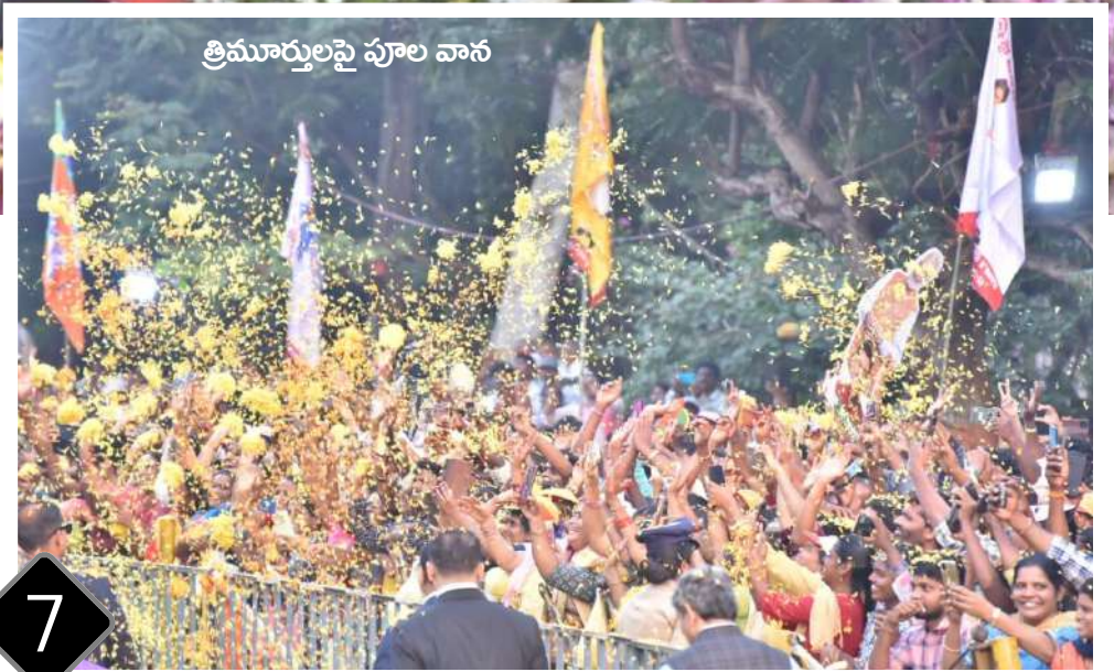
త్రిమూర్తులపై పూల వాన

ప్రధాని నరేంద్ర మోదీ విశాఖ పర్యటనలో భాగంగా నిర్వహించిన రోడ్ షో సూపర్ సక్సెస్ అయ్యింది. ప్రధాని మోదీ, ముఖ్యమంత్రి చంద్రబాబు, ఉప ముఖ్యమంత్రి పవన్ కల్యాణ్ ఒకే వాహనంపై సిరిపురం కూడలి నుంచి బహిరంగ సభా వేదికైన ఏయూ ఇంజనీరింగ్ కళాశాల మైదానం వరకు రోడ్ షో నిర్వహించారు. రోడ్ షోలో అడుగుడుగునా పూలు చల్లుతూ ప్రజలు ఘనస్వాగతం పలికారు. మోదీ, చంద్రబాబు, పవన్ ప్రజలకు అభివాదం చేస్తూ ముందుకు సాగారు. రోడ్ షో అనంతరం ఏయూ ఇంజనీరింగ్ గ్రౌండ్ మైదానంలో ఏర్పాటు చేసిన బహిరంగసభకు హాజరైన మోదీకి రాష్ట్ర ప్రజల తరపున అనకాపల్లి ఎంపీ సీఎం రమేష్ స్వాగతం పలికారు. వేదికపై ప్రధాని మోదీని సీఎం చంద్రబాబు సత్కరించి.. శేషశయసుడి విగ్రహం, అరకు కాఫీ కిట్ను బహూకరించారు. గవర్నర్ జస్టిన్ అబ్దుల్ నజీర్, డిప్యూటీ సీఎం పవన్ కల్యాణ్, మంత్రి నారా లోకేశ్, ఎంపీలు భరత్, పురందేశ్వరి, రాష్ట్ర మంత్రులు, ఎమ్మెల్యేలు సభకు హాజరయ్యారు.