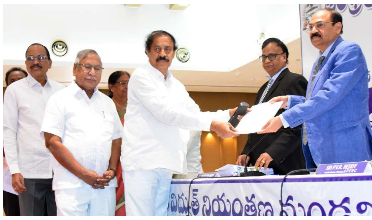
ప్రభుత్వం దృష్టికి తీసుకువెళ్తామని తెలిపారు.