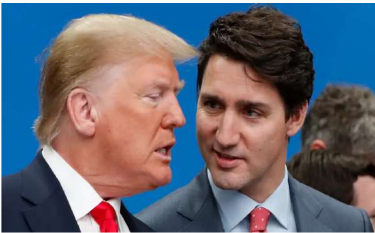
వస్తువుపై 25 శాతం సుంకం విధించే ఉత్తరువుపై జనవరి 20న సంతకం చేస్తానని ట్రంప్ చెప్పారు. ఫెంటానిల్ సృష్టిం గా చైనా అరికట్టే వరకు ఆ దేశం సుంచి వచ్చే వస్తువులపై అదనంగా 10 శాతం సుంకం విధించాలనుకుంటున్నట్లు తెలిపారు.

ఇదిలావుండగా అమెరికా అధ్యక్ష ఎన్నికల్లో గెలుపొందిన ట్రంప్ తాను అధ్యక్షుడిగా బాధ్యతలు చేపట్టిన మొదటిరోజే కెనడా, మెక్సికో, చైనా వస్తువులపై భారీ సుంకాలు విధిస్తానని ప్రకటించిన విషయం తెలిసింది. అమెరికాలోకి అక్రమ వలసలు, మదక ద్రవ్యాలు సృష్టిం గా నివారణకు ఇవి సహాయపడతాయని ఆయన చెప్పారు. మెక్సికో, కెనడాలు సుంచి వచ్చే ప్రతి