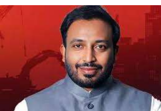
కాకినాడ (చైతన్యరథం): రాజోయే మర్యాదపూర్వకంగా కలిశారు. పండుగ

సంక్రాంతి పండుగను పురస్కరించుకుని జిల్లావ్యాప్తంగా తీసుకునే ముందస్తు చర్యల గురించి చర్చించేందుకు కాకినాడ ఎంపీ తంగెళ్ల ఉదయశ్రీనివాస్ ఎస్పి విక్రాంతపాటిల్ను మంగళవారం నేపథ్యంలో శాంతిభద్రతలను పరిరక్షించడంతోపాటు రోడ్డు ప్రమాదాల నివారణకు పటిష్ట చర్యలు తీసుకోవాలని ఎస్పిని కోరారు. ముఖ్యంగా విస్తరణ పనులు చేపడుతున్న సామర్లకోట కాకినాడ ఏడీబీ రోడ్డులో తరచూ ప్రమాదాలు జరుగుతున్న దృష్ట్యా హెచ్చరిక బోర్డులు ఏర్పాటు చేయడంతోపాటు రాత్రి సమయాల్లో లైటింగ్ లేని ప్రదేశాల్లో తాత్కాలిక ఏర్పాట్లు చేయాలన్నారు. అలాగే డ్రాక్ అండ్ డ్రైవ్ తనిఖీలు విస్తృతంగా చేయాలని ఎంపీ కోరారు.