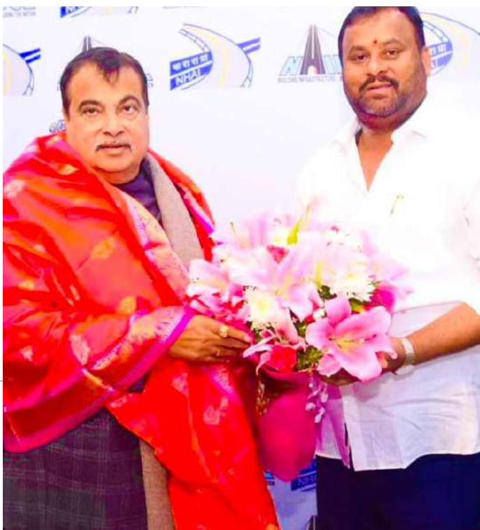
పూర్తిగా సహకరిస్తామని హామీ ఇచ్చారు. ఈ కార్యక్రమంలో రహదారి శాఖకు సంబంధించిన ఉన్నతాధికారులు పాల్గొన్నారు.

కేంద్రాలు, జిల్లా హెడ్ క్వార్టర్స్ మధ్య మెరుగైన కనెక్టివిటీ సులభతరం చేసేందుకు నిధులు మంజూరు చేయాలని కోరారు. ఎన్ హెచ్ నేషనల్ హైవేస్ లాజిస్టిక్ మేనేజ్మెంట్ ప్రాజెక్టును ఆమోదించి పనులను త్వరితగతిన పూర్తి చేసేందుకు చర్యలు చేపట్టే విధంగా ఆదేశాలు జారీ చేయాలని విజ్ఞప్తి చేశారు. అలాగే కడప నుంచి రాయచోటి వరకు 4 లైన్ల రహదారి మంజూరుకు అవసరమైన చర్యలు తీసుకోవాలని కోరారు. రాజంపేట - రాయచోటి - కదిరి రహదారి - రాష్ట్ర రహదారి నుంచి జాతీయ రహదారిగా అభివృద్ధి చేసేందుకు శాఖావరమైన ఆదేశాలు జారీ చేయాలని కోరారు. దీనిపై గడ్కరీ స్పందిస్తూ రాష్ట్ర రహదారి అభివృద్ధికి