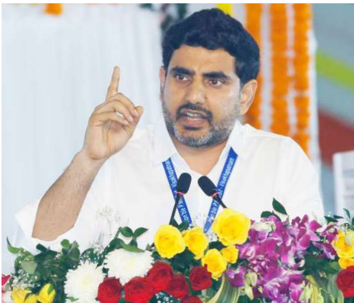
శంకుస్థాపన చేశారు. ఉత్తరాంధ్ర ప్రజల చిరకాల కోరిక విశాఖ రైల్వే జోన్. గత ప్రభుత్వం కనీసం భూమి కేటాయింపు చేశారు. కూటమి ప్రభుత్వం వచ్చిన తరువాత విశాఖ రైల్వే జోన్ ట్రాక్ ఎక్స్టిండ్. నేడు