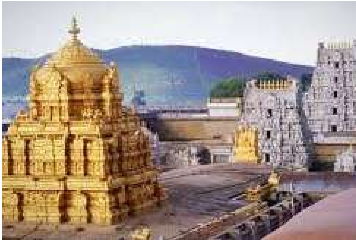
రేపటి నుంచి సర్వదర్శన టోకెన్ల జారీ

తిరుపతిలోని 8 కేంద్రాల్లో ఏర్పాటు చేసిన 90 కౌంటర్లు, తిరుమలలో ఏర్పాటు చేసిన ఒక కేంద్రంలోని 4 కౌంటర్లలో ఎస్ఎస్డీ టోకెన్లు జారీ చేస్తారు. జనవరి 9న ఉదయం 5 గంటలకు 10, 11, 12 తేదీలకు సంబంధించి 1.20 లక్షల టోకెన్లను భక్తులకు కేటాయించారు. 13 నుంచి 19వ తేదీ వరకు ఏరోజుకారోజు టోకెన్లు జారీ చేస్తారు. సామాన్య భక్తులకు పెద్దపీట వేస్తూ పదిరోజులకు 4.32 లక్షల ఎస్ఎస్డీ టోకెన్లు జారీ చేస్తారు. తిరుపతిలోని ఇందిరా మైదానం, రామచంద్ర పుష్పరిణి, శ్రీనివాసం కాంప్లెక్స్, విష్ణు నివాసం కాంప్లెక్స్, భూదేవి కాంప్లెక్స్, భైరాగిపట్టణంలోని రామా నాయుడు ఉన్నత పాఠశాల, ఎంఆర్ పల్లిలోని జిల్లా పరిషత్ ఉన్నత పాఠశాల, జీవకోసలోని జిల్లా పరిషత్ ఉన్నత పాఠశాల, తిరుమల వాసులకు బాలాజీ నగర్ కమ్యూనిటీ హాలులో ఎస్ఎస్డీ టోకెన్లు జారీ చేస్తారు. ఇప్పటికే పది రోజుల వైకుంఠ ద్వార దర్శనాలకు సంబంధించి 1.40 లక్షల ఎస్ఎస్డీ టికెట్లను, 19500 శ్రీవాణి టికెట్లను ఆన్లైన్లో విడుదల చేసినట్లు తెలిపారు.