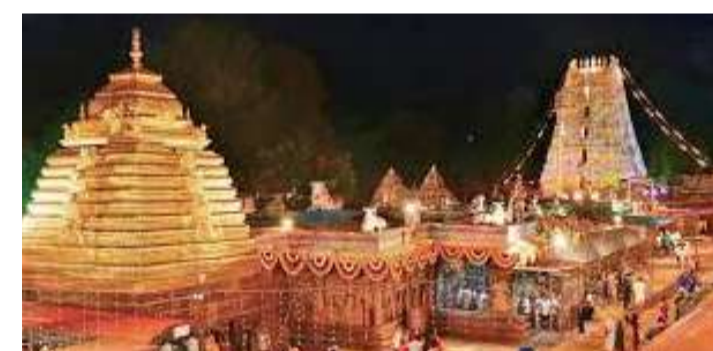
బ్రహ్మోత్సవాల్లో రెండో రోజైన 12 నుండి భ్రమరాంబ సమేత మల్లికార్జున స్వామివారి వాహనసేవలు జరుగుతాయి. 14వ తేదీ సంక్రాంతి రోజున కల్యాణం, 16న ఉదయం యాగపూర్ణావతి, కలశోద్ఘాటన, త్రిశూలస్థానం, సాయంత్రం సదస్యం, నాగవల్లి, ధ్వజారోహణ కార్యక్రమాలు జరుగుతాయి. చివరిరోజైన 17న పుష్కొత్సవం, శయనోత్సవం, ఏకాంత సేవలతో ఉత్సవాలు ముగుస్తాయి. ఉత్సవాల సందర్భంగా 11 నుంచి 17 మధ్య ఆర్థిత, ప్రత్యక్ష, పరోక్ష సేవలను రుద్రహోమం, చండీహోమం, మృత్యుంజయహోమం, గణపతి హోమం, సుబ్రహ్మణ్యేశ్వరస్వామి కల్యాణం, స్వామిఅమ్మవార్ల కల్యాణం, ఉదయాస్తమానసేవ, ప్రాతఃకాలసేవ, ఏకాంతసేవలను నిలిపివేశారు.

శ్రీశైలం (చైతన్యరథం): ఆదిదంపతులు కొలువైన శ్రీగిరి క్షేత్రంలో ఈ నెల 11 నుండి సంక్రాంతి బ్రహ్మోత్సవాలు ప్రారంభం కానున్నాయి. శ్రీశైలం మల్లికార్జున స్వామి ఆలయంలో ఏటా రెండుసార్లు బ్రహ్మోత్సవాలు నిర్వహించడం ఆనవాయితీగా వస్తున్నది. మకర సంక్రమణం సందర్భంగా సంక్రాంతి బ్రహ్మోత్సవాలు జరుగుతుండగా.. మహాశివరాత్రి సమయంలో శివరాత్రి బ్రహ్మోత్సవాలు జరుగుతుంటాయి. ఈనెల 11వ తేదీ ఉదయం 8.45 గంటలకు స్వామివారి యాగశాల ప్రవేశ కార్యక్రమంలో ఉత్సవాలకు శ్రీకారం చుడతారు. అనంతరం లోకకల్యాణాన్ని కాంక్షిస్తూ అర్చకులు బ్రహ్మోత్సవ సంకల్పాన్ని పలిస్తారు. ఆ తర్వాత కార్యక్రమం నిర్వహించి జరిగేందుకు గణపతిపూజ నిర్వహిస్తారు. అనంతరం వృద్ధి, అభ్యుదయాల కోసం స్వస్తి పుణ్యహవాచనం జరుగుతుంది. ఆ తర్వాత చండీశ్వరుడికి విశేష పూజలు జరుగుతాయి. ఇక సాయంత్రం 5.30 గంటల నుంచి అంకూరోపణ, అగ్నిప్రతిష్ఠాపన కార్యక్రమాలు, రాత్రి 7 గంటల నుంచి ధ్వజారోహణం క్రతువులు జరుగుతాయి. బ్రహ్మోత్సవాల్లో భాగంగా ప్రతిరోజూ స్వామి అమ్మవార్లకు విశేషపూజలు చేయనున్నారు.