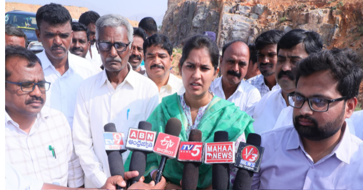
సమర్పిస్తామని హైవే అధికారులు తెలిపారు. వీలైనంత త్వరగా బస్టాప్ సమస్యను పరిష్కరిస్తామని ప్రజలకు ఎమ్మెల్యే బండారు శ్రావణిశ్రీ హామీ ఇచ్చారు.