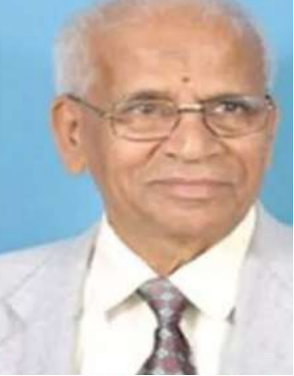
వి రాఘవేంద్రాచార్య పంచముఖి