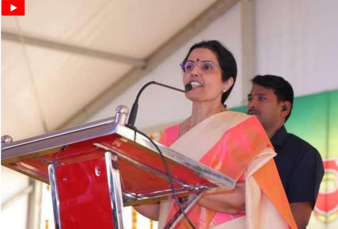
అదేస్థాయిలో పోరాడి ఎన్నీవి కూటమికి పట్టం కట్టారు. బెంగుళూరు టీడీపీ ఫోరంను అభినందిస్తున్నా