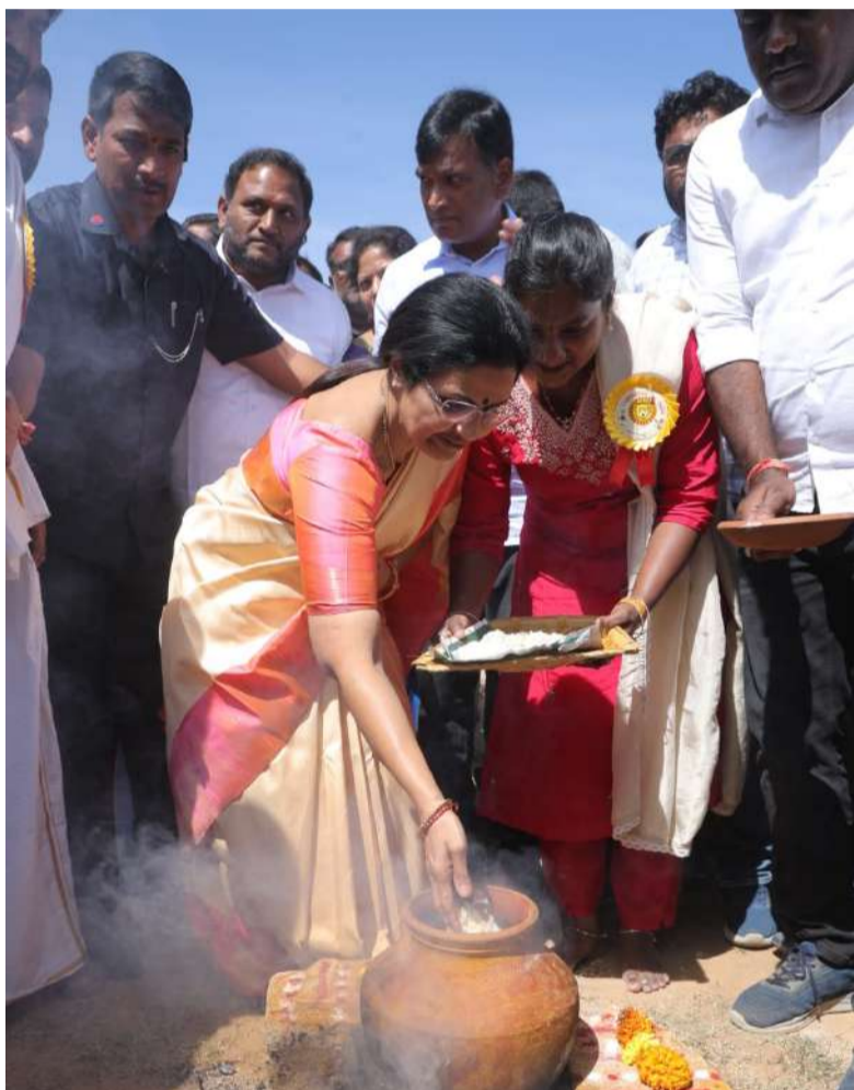
బెంగుళూరు (చైతన్యరథం): పండుగలు మనుషుల మధ్య అనుబంధాలను బలోపేతం చేస్తాయి..సంస్కృతి, సంప్రదాయాలకు అద్దం