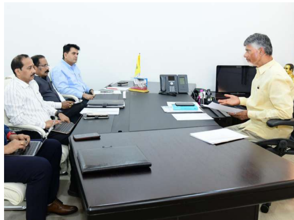
దావోస్ పర్యటన ముగించుకుని శుక్రవారం నగరానికి చేరుకున్న ముఖ్యమంత్రి చంద్రబాబు సీఎస్, సీఎంవో అధికారులతో నిర్వహించిన సమావేశం

ఆరునెలల కాలంలో వాటిని ముందుకు తీసుకెళ్లేందుకు తీసుకోవాల్సిన చర్యలపై సూచనలు చేశారు. వరల్డ్ ఎకనమిక్ ఫోరం సదస్సులో జరిగిన చర్చల కొనసాగింపుగా పలు దేశాల ప్రతినిధులు, పలు సంస్థల సీఈఓలు, ఆయా దేశాల మంత్రుల బృందాలు త్వరలో రాష్ట్రంలో పర్యటించనున్నాయని, అందుకు ఆయా శాఖలు సన్నద్ధంగా ఉండాలని అధికారులను ముఖ్యమంత్రి ఆదేశించారు. దిగ్గజ కంపెనీల సీఈఓలతో జరిగిన చర్చలపై సంకల్పవంతి వ్యక్తం చేసిన ముఖ్యమంత్రి చంద్రబాబు ఆయా ప్రతిపాదనలు కార్యరూపం దాల్చి, పెట్టుబడులు పెట్టేందుకు తీసుకోవాల్సిన చర్యలపై అధికారులకు దిశానిర్దేశం చేశారు. కంపెనీలతో నిరంతరం సమీక్షలు, సంప్రదింపులు జరపడం ద్వారా పెట్టుబడులు కార్యరూపం దాల్చేలా చూడాలని, వీటిని ఎప్పటికప్పుడు సమీక్షించాలని సీఎం విజయానంద్ కు ముఖ్యమంత్రి చంద్రబాబు సూచించారు.