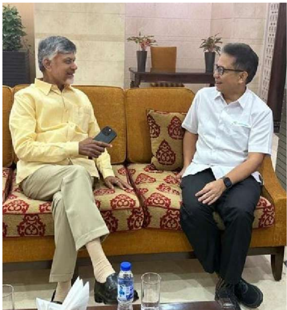
ఢిల్లీ చేరుకున్న సీఎం చంద్రబాబు విమానాశ్రయంలో కలిసిన ఇండోనేషియా వైద్యశాఖ మంత్రి బుడి సాదికిన్ ను మర్యాద పూర్వకంగా కలిసి ముచ్చటిస్తున్న దృశ్యం