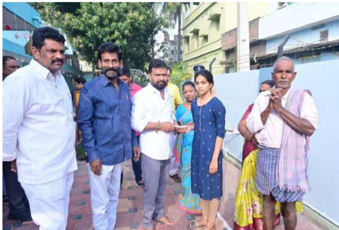
రామచంద్రపురం, (చైతన్యరథం): రామచంద్రపురం మండలం