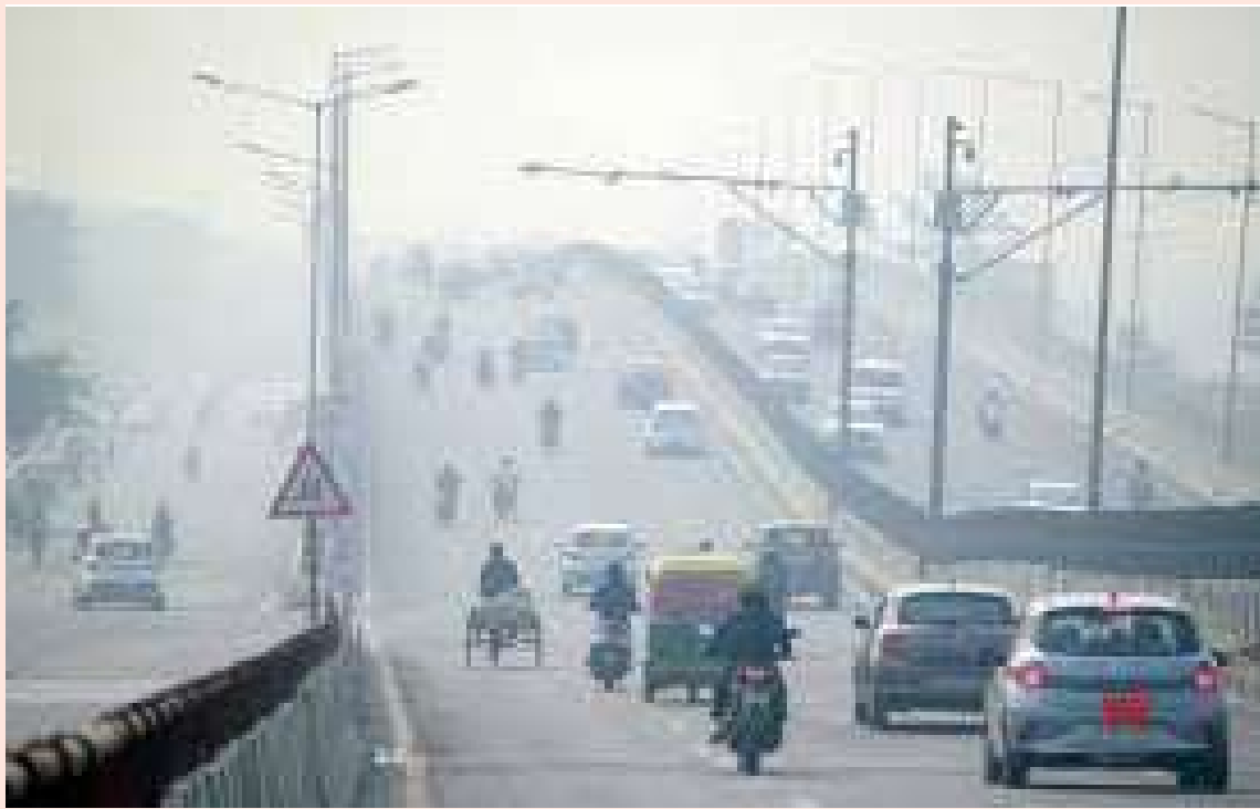
సంబంధిత కార్యకలాపాలపై తాత్కాలిక నిషేధం, 10, 12 తరగతులు మినహా మిగతా విద్యార్థులకు ఆన్లైన్ క్లాసులు తదితర చర్యలు తీసుకుంటారు. ప్రతికూల వాతావరణం, వాహనాల ఉద్గారాలు,

ఢిల్లీ వాయు కాలుష్య కోరల్లో చిక్కుకుంది. వాయు నాణ్యత తీవ్రస్థాయికి చేరుకోవడంతో కాలుష్య కట్టడి కోసం తక్షణమే కఠిన నిబంధనలు అమలు చేయాలని 'ఎయిర్ క్వాలిటీ మేనేజ్మెంట్ కమిషన్' నిర్ణయించింది. ఈ క్రమంలోనే దేశ రాజధాని పరిధిలో మరోసారి 'గ్రేడెడ్ రెస్పాన్స్ యాక్షన్' ఆంక్షలు విధించింది. స్థానికంగా వాయునాణ్యత సూచీ మంగళవారం 275గా ఉండగా.. బుధవారం సాయంత్రం 6 గంటలకు 396కు పెరిగింది. దట్టమైన పొగమంచు, కనిష్ట ఉష్ణోగ్రతల వంటి పరిస్థితుల కారణంగా గాలి నాణ్యత పడిపోయినట్లు తెలుస్తోంది. స్థానికంగా ఏకకూట త్వరలోనే 400 దాటే అవకాశం ఉందని భారత వాతావరణ విభాగం అంచనా వేసింది. ఈ నేపథ్యంలోనే జీఆర్ఎఫ్-3, 4 ఆంక్షలు అమలు చేయాలని అధికార యంత్రాంగాన్ని సీఎక్సాం ఆదేశించింది. 'జీఆర్ఎఫ్-4' కింద నిర్మాణ