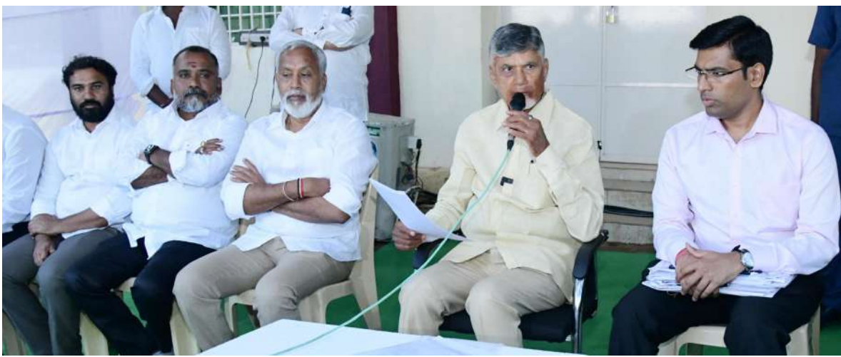
సమాజం బాగుంటుంది. దాని కోసం నేను పనిచేస్తున్నట్లు చెప్పారు.

ప్రధానమంత్రి పర్యటన సందర్భంగా రూ.2.8 లక్షల కోట్లతో పలు అభివృద్ధి పనులకు ఫౌండేషన్, ప్రారంభోత్సవాలు మన రాష్ట్రంలో ఒక చరిత్ర. పబ్లిక్, ప్రైవేట్ భాగస్వా మ్మంతో ప్రజలకు మంచిగా అన్ని రంగాల్లో మెరుగైన పనులు కల్పిస్తున్నాం. పేద వాళ్లు పేద వాళ్లుగా ఉండకూడదనే ఉద్దేశంతో పీ4 పబ్లిక్, ప్రైవేట్, పీపల్స్, పార్సనల్ పిప్ విధానం తీసుకుని వస్తున్నాం. అభివృద్ధి చెందిన వాళ్లు తమ తోటి ప్రజలు కూడా అభివృద్ధి అయ్యేలా తమ పూర్తి సహకారం అందించాలి. అప్పుడు అందరూ ఆనందంగా ఉంటారు.