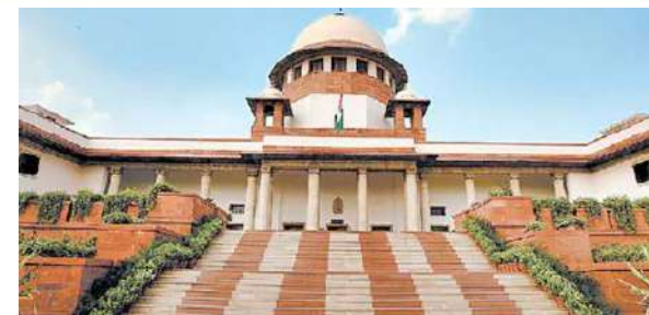
పొరుగు రాష్ట్రాల్లో పంట వ్యర్థాల దహనం, ఇతర కాలుష్య కారకాల కారణంగా ఏటా శీతాకాలంలో ఢిల్లీ-ఎన్సీఆర్లో వాయునాణ్యత తీవ్రంగా ప్రభావితమవుతోంది.