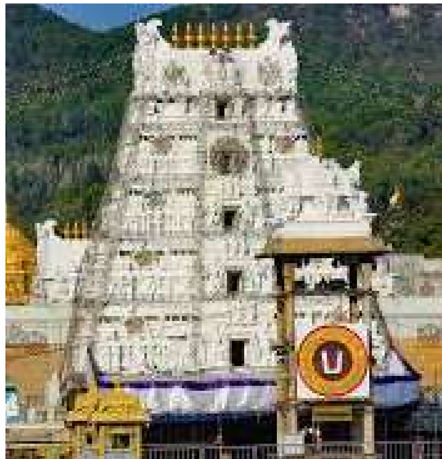
(చెన్నై) ద్వారా భక్తులకు టికెట్లు విక్రయిస్తున్నట్లు తేల్చారు. హైదరాబాద్, ప్రార్థుటూరు,బెంగళూరుకు చెందిన 11మంది భక్తుల నుంచి రూ. 19వేలు వసూలు చేసినట్లు విచారణలో వెల్లడైంది. ప్రస్తుతం ఈ ఐదుగురు నిందితులను తితిదే విజిలెన్స్ అధికారులు, వన్ టౌన్ పోలీసులు విచారిస్తున్నారు.