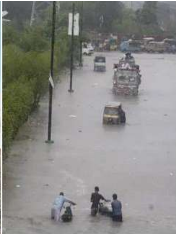
పరిగణించింది. దేశాల మధ్య సాయుధ ఘర్షణలు, విపత్కర వాతావరణ పరిస్థితులు, భౌగోళిక-వాణిజ్య వివాదాలు, తప్పుడు సమాచార వ్యాప్తి, సామాజిక

విభజనలను ఈ ఏడాదికి సంబంధించి మొదటి ఐదు తీవ్ర ముప్పులుగా పేర్కొంది. వచ్చే రెండేళ్లలో తప్పుడు సమాచార వ్యాప్తి అతిపెద్ద ముప్పుగా తేల్చింది. దీంతోపాటు ప్రకృతి ప్రకోపాలు, దేశాల సాయుధ ఘర్షణలు, సామాజిక విభజనలు, సైబర్ గూఢచర్యాలను స్వల్పకాలిక ముప్పులుగా వర్గీకరించింది. వచ్చే పదేళ్లలో వాతావరణ వైపరీత్యాలను తీవ్ర ముప్పుగా పరిగణించింది. జీవవైవిధ్య నష్టం- పర్యావరణ వ్యవస్థ పతనం, భూమి అవరణ వ్యవస్థలో మార్పులు, ప్రకృతి వనరుల కొరత, తప్పుడు సమాచార వ్యాప్తిని దీర్ఘకాలిక ముప్పులుగా పేర్కొంది.