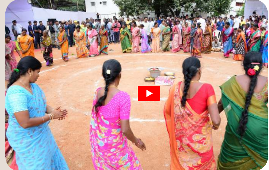
నారావారిపల్లెలో మహిళల పండుగ నృత్యం