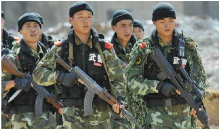
దళాలకు అవసరమైన పరికరాలు, ఆహారం వంటివి సరఫరా చేయడంపై సాధన చేస్తున్నారు. ఈ విన్యాసాలు చేపట్టిన ప్రదేశం కూడా లడఖ్ను ఆనుకొని ఉంది. ఇక్కడి వాతావరణం కారణంగా శారీరకంగా

తాజాగా బీజింగ్ చేపట్టిన లాజిస్టిక్స్ సపోర్ట్ ఎక్స్రెసిజ్లు చాలా ప్యూహాత్మకమైనవి. అత్యంత ఎత్తైన ప్రదేశాల్లో యుద్ధం వేళ వేగంగా