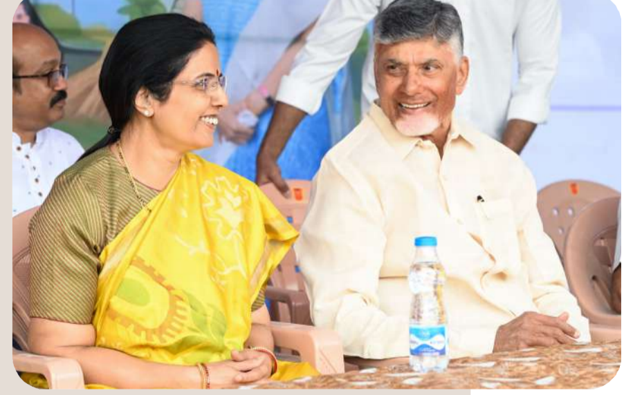
పండుగరోజు పిల్లల ఆనందం చూసి మురిసిపోతున్న సీఎం దంపతులు