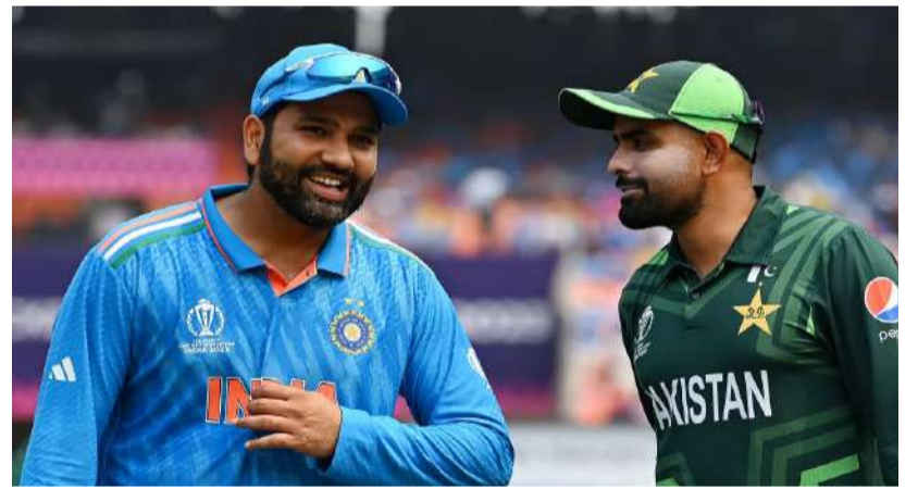
దానికి కూడా హైలైట్ వేదిక!

ఈ ఫోటోషూట్ కోసం రోహిత్ పాకిస్థాన్ వెళ్తే మాత్రం సెన్సేషన్ అవుతుంది. ఈ టోర్నీకి కూడా వరల్డ్వైడ్గా విపరీతమైన బజ్ క్రియేట్ అవుతుంది. కానీ, రోహిత్ పాక్ వెళ్లడం అసాధ్యమే. ఆ దేశంతో దౌత్యపరంగా ఉన్న సమస్యల మధ్యలో బీసీసీఐ రోహిత్ను అక్కడకు పంపే సాహసం చేయదని విశ్లేషకుల మాట.