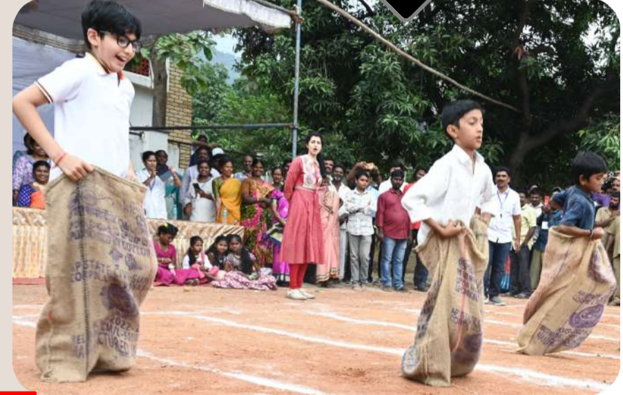
గోనె సంచితో పరిగెత్తే సంప్రదాయ ఆటలో కేరింతలు కొడుతున్న దేవాన్స్

54వ రోజు ప్రజాదర్బార్లో సమస్యలు విన్నవించిన ప్రజలు పరిష్కారానికి కృషిచేస్తామని మంత్రి లోకేష్ హామీ