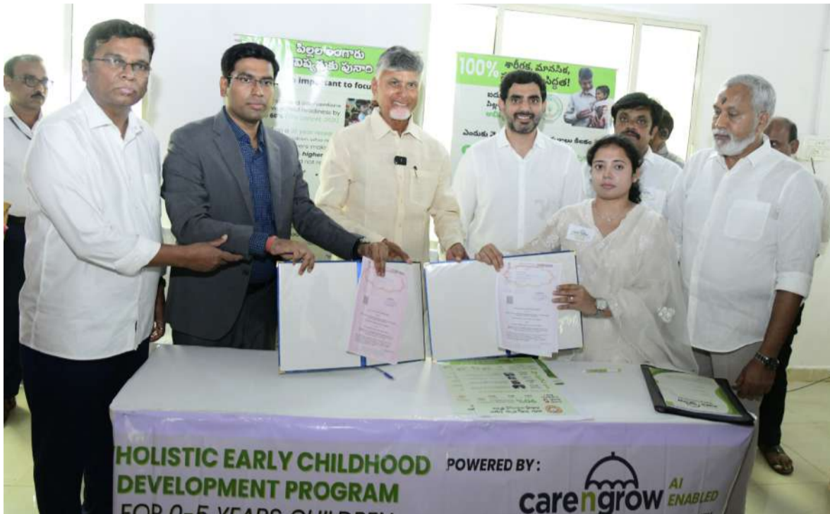
అభివృద్ధి కార్యక్రమాలకు అధికారులతో కలిసి శంకుస్థాపన చేశారు.