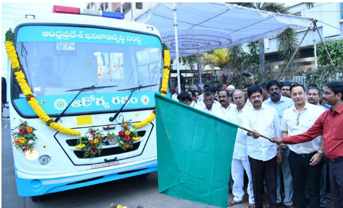
మైనింగ్ జరిగే ప్రాంతాల్లో ప్రజలకు వైద్య సౌకర్యాలు అందించేందుకు ముఖ్యమంత్రి చంద్రబాబు ఆదేశాలకు అనుగుణంగా ఆరోగ్య రథాలను తీసుకువచ్చామన్నారు. ఇప్పటికే ఏపీఎండీసీ