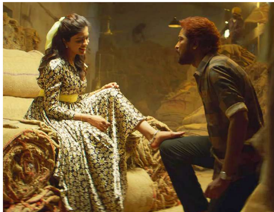
చిత్రం స్ట్రీమింగ్ కి వస్తున్నట్టుగా కన్ఫర్మ్ చేశారు. సో, ధియేటర్ లో మిస్ అయ్యినవారు ఈటీవీ వన్ లో సినిమా

ఇక ఈ సినిమా ఓటిటి రిలీజ్ కి అయితే ఇప్పుడు రెడీ అయ్యింది. ఈ సినిమా ఓటిటి హక్కులు మొత్తం మూడు సంస్థలు తీసుకోగా అమెజాన్ ప్రైమ్ వీడియో, సన్ నెక్స్ట్ అలాగే ఈటీవీ వన్ సొంతం చేసుకోగా లేటెస్ట్ గా ఈటీవీ వన్ డేట్ ని ఇచ్చేసారు. జనవరి 10 నుంచే