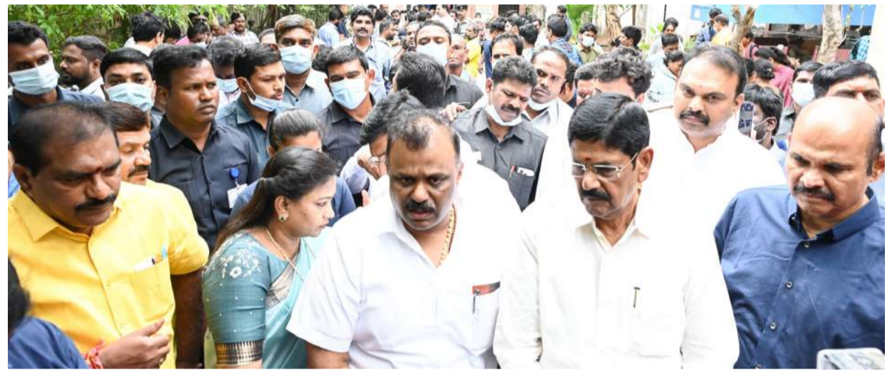
ముఖ్యమంత్రి ఆదేశాల మేరకు ఆగమేఘాలమీద సంఘటనా ప్రాంతానికి వెళ్లిన మంత్రుల బృందం