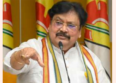
వైసీపీ పుట్టుకలోనే శవరాజకీయాలు..