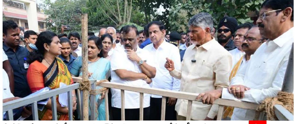
సంఘటనా ప్రాంతాన్ని పరిశీలించి.. బాధ్యతా వైఫల్యంపై అధికారులను నిలదీస్తున్న సీఎం చంద్రబాబు