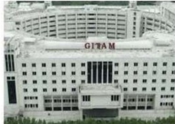
విశాఖపట్నం (చైతన్యరథం): గీతం డి.పి. వర్చుల్ టెక్నాలజీ విభాగంలో ఇన్స్టిట్యూట్ ఆఫ్ ఎలక్ట్రానిక్స్ అండ్ ఎలక్ట్రీకల్ (ఐఈఈఈ) విద్యార్థి విభాగం అధ్యక్షులు విద్యాసంస్థలో సెంటర్ ఆఫ్ ఎక్సలెన్స్ (సీఈఎ), పరిశోధన