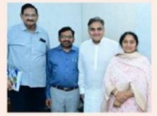
మహిళలకు సిడాప్ ఉపాధి