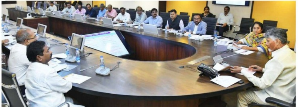
సంక్షేమ హాస్టళ్లలో వసతుల కల్పన