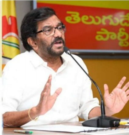
ట్రెండెండ్ అండ్ నాల్గ్స్ కంపెనీల పేరుతో లబ్ధి టన్నుల బొగ్గును దిగుమతి చేశారు. దీనిపై కూడా భయపడి బొగ్గు దంపి చేశారు. టన్ను రూ. 8,500 చొప్పున రూ. 382 కోట్లు పెట్టి బొగ్గును ఏపీ జెన్కోకు అరబిందో సంస్థ అమ్మింది. జగన్ రెడ్డి హయాంలో

40 శాతం ప్లాంట్ లోడ్ ఫాక్టర్ ఉండగా ప్రభుత్వం మారానే 55 శాతానికి పెరిగింది. నాసిరకం బొగ్గును కొనడం, మార్కెట్ ధర కంటే ఎక్కువ వెచ్చించి విద్యుత్ కొనుగోలు చేయడం వంటి వాటి వల్ల ఏపీ జెన్కోకు సుమారు రూ. 700 నుంచి రూ. వెయ్యి కోట్ల వరకు నష్టం వాటిల్లింది. అన్నీ తెలిసి కూడా విజయసాయిరెడ్డి విద్యుత్తుకుడికి ఆదాయం సమకూర్చు దం కొనసాగిస్తూ, బొగ్గు అంటూ తదితర చార్జీల పేరుతో ప్రజలపై జగన్ రెడ్డి భారం మోపారు. పీఎల్ఎఫ్ శాతం పడిపోవడంతో పరిశ్రమలు, ఆత్మా పరిశ్రమలకు 24 గంటల విద్యుత్ అందించలేకపోయారు. నేడు ఏ అధికారిని లంచం తీసుకుంటే వెంటనే ఏపీపీ చర్యలు తీసుకుంటుంది. అరబిందోకు ప్రత్యేక చట్టమేమీ లేదు. కారు చట్టాలకు అతిథులు కారు. పెద్ద మొత్తంలో అరబిందో సంస్థ కుంభకోణాలకు పాల్పడినట్లు ఆధారాలు ఉంటే అధికారులు ఎందుకు చర్యలు తీసుకోవడం లేదు? దీనిపై సీఐటీ, విజిలెన్స్ విచారణ జరిపి అరబిందో డోపిడీ దరంఠాల బయటపెట్టి ఏపీ జెన్కోకు జరిగిన నష్టాన్ని అరబిందో వద్ద నుండి రాబట్టాలని కోరారు. 104, 108 అంబులెన్స్ సర్వీసులలో కూడా అరబిందో కుంభకోణాన్ని అసెంబ్లీ సాక్షిగా నేను బయటపెట్టాను. దీనిపై కూడా విచారణ జరిపించాలని డిమాండ్ చేశారు.