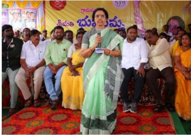
కుప్పం అభివృద్ధి మా ధ్యేయం

కుప్పం/రామకుప్పం (వైతన్యరథం): ముఖ్యమంత్రి చంద్రబాబు విజన్ తో కుప్పంలో అభివృద్ధి పరుగులు పెట్టడం ఖాయమని ఆయన సతీమణి నారా భువనేశ్వరి ఉద్ఘాటించారు. గత ఐదేళ్ల పాటలో భిన్నాభిన్నమైన రాష్ట్రాన్ని టిడిగి గాడిలో పెట్టే సామర్థ్యం చంద్రబాబుకి మాత్రమే ఉందని విశ్లేషించి ప్రజలు ఛాలీ మెచాలీతో గెలిపించారన్నారు. 3వ రోజు కుప్పం పర్యటనలో భాగంగా శనివారం రామకుప్పం మండలంలో భువనేశ్వరి విస్తృతంగా పర్యటించారు. మొదటపంక గ్రామం, గాంధీనగర్ లో మహిళలతో నిర్వహించిన ముఖాముఖి కార్యక్రమంలో పాల్గొన్నారు. దారిపాదవునా పూలు పరిచి, దేవు వాయిద్యాలు, జానపద గీతాలతో గ్రామస్థులు, డిడీపీ కార్యకర్తలు భువనేశ్వరికి స్వాగతం పలికారు. అనంతరం విజలాపురంలోని కస్తూర్బా పాఠశాలను భువనేశ్వరి సందర్శించారు. విద్యార్థులతో కలిసి సహపంక్తి భోజనం చేశారు.