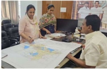
భాగస్వామ్యంతో నుదా వదిలో లేజిట్టును అభివృద్ధి చేసి ఆదాయం పెంచే విధంగా చర్యలు తీసుకుంటున్నట్లు వెల్లడించారు.

మంత్రి పొంగూరు నారాయణ ఆదేశాల మేరకు లేజిట్టు యజమానులకు 24 గంటల్లోనే అనుమతులు ఇవ్వాలన్నారు. నిబంధనలకు విరుద్ధంగా