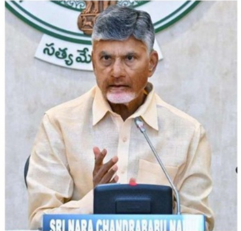
SRI NARA CHANDRABABU NAIDU

కేంద్రకృతమై ఉంది. చెన్నైకు ఈశాన్యంగా 480 కిలోమీటర్లు, ఒడిశాలోని గోపాల్ పూర్కు దక్షిణంగా 590 కిలోమీటర్ల దూరంలో కేంద్రకృతమైందని వాతావరణశాఖ తెలిపింది. రాగల 12 గంటలపాటు ఇది తూర్పు ఈశాన్యం దిశగా కదులుతూ వాయుగుండంగా కొనసాగి అవకాశం ఉంది. ఆ తరువాతి క్రమంగా సముద్రంలోనే బల పీనవడే సూచనలు ఉన్నట్లు పేర్కొంది. దీని ప్రభావంతో రాగల 24 గంటల్లో ఉత్తర కొస్తా, దక్షిణ కొస్తాంధ్ర రాయలసీమ జిల్లాల్లో తేలికపాటి నుంచి మోస్తరుగా వర్షాలు కురిసి సూచనలు ఉన్నాయని పేర్కొంది.