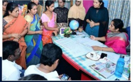
టీజీపీ ఎల్.ఎల్.సీ, గజులదిన్నె, సోమనాటి సంఘాల ఎన్నికలు ఏకగ్రీవం