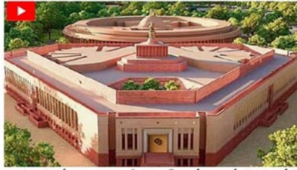
అధికరణను చేర్చాల్సి ఉంది. పార్లమెంట్ పదవీకాలంలో మార్పు కోసం 83 అధికరణ, అసెంబ్లీ పదవీకాలం సవరణ కోసం 327 అధికరణను సవరించాల్సి ఉంటుంది. మాజీ రాష్ట్రపతి రామనాథ్ కోవింద్ నేతృత్వంలోని ఉద్యమకర్తల స్వయం కమిటీ సిఫారసుల మేరకు రాజ్యాంగ (129వ సవరణ) బిల్లును కేంద్రం రూపొందించిన విషయం తెలిసిందే.

న్యూఢిల్లీ: ఒకే దేశం-ఒకే ఎన్నికల సంబంధించిన బిల్లుపై కేంద్ర ప్రభుత్వం పునరాలోచనలో పడినట్లు తెలుస్తోంది. వాస్తవానికి, సోమవారం పార్లమెంట్లో బిల్లు ప్రవేశపెట్టినప్పటికీ కేంద్రం ప్రకటించింది. ఈ క్రమంలో రాజ్యాంగం (129వ సవరణ) బిల్లు, కేంద్ర పాలిత ప్రాంత చట్టాల (సవరణ) బిల్లులను సోమవారం లోక్ సభలో ప్రవేశపెట్టేందుకు జాబితా సిద్ధం చేసింది. కాగా సవరించిన లోక్ సభ బిల్లును జాబితాలో సోమవారం నాటి ఎజెండాలో ఈ రెండు బిల్లులను తొలగించింది. పార్లమెంట్ కీలాకాల సమావేశాలు డిసెంబర్ 20న ముగియనున్నాయి. గురువారం తేదినే రాజ్యాంగ (129వ సవరణ) బిల్లు- 2024, కేంద్రపాలిత ప్రాంతాల చట్టాలు (సవరణ బిల్లు), 2024కి ఆమోద ముద్ర వేసింది.