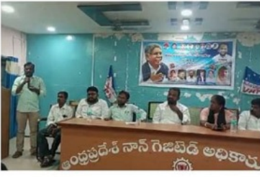
అంతర్జాతీయ దివ్యాంగుల దినోత్సవం