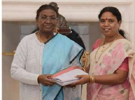
పూసపాటి కుటుంబం ప్రజా సేవ కోసం చేసిన త్యాగాల గురించి రాష్ట్రపతికి వివరించారు. ఈ సందర్భంగా రాష్ట్రపతి ద్రౌపది ముర్ముని మాట్లాడుతూ... తప్పకుండా విజయనగరం వస్తానని, ఆలోచి గజపతిరాజు బంగ్లాను కూడా సందర్శిస్తానని తెలియజేశారు.