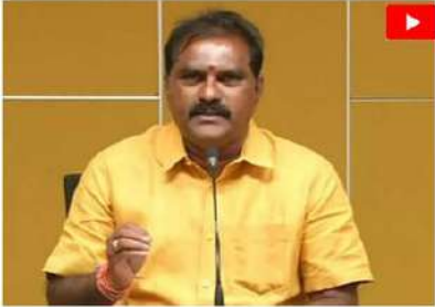
పాలకొల్లు (చైతన్యరథం): జగన్ పాలనలో యువత గంజాయి, మాదక ద్రవ్యాలకు ఆలూటు పడి నిర్దోషమయ్యారని మంత్రి

నిమ్మల రామనాయుడు అన్నారు. ఆదివారం ఆయన విలేజ్ క్రకేట్ మాట్లాడుతూ పాలకొల్లులో డిసెంబర్ 15వ తేదీన సీన్ డి గర్ల చైల్డ్ పేరుతో 2కే రన్ నిర్వహించనున్నట్లు తెలిపారు. ఆదేశాలను దక్షిణమకుండా, భ్రాణి హత్యలు విద్యార్థిత్వానే నినాదంతో ప్రత్యేక కార్యక్రమాలు నిర్వహిస్తున్నట్లు చెప్పారు. అనపిల్లలే జాతికి నిజమైన సంపద అని, ఆ సంపదను కాపాడుకోవటానికి ప్రతిఒక్కరూ కలిసి రావాలని మంత్రి నిమ్మల పిలుపునిచ్చారు.